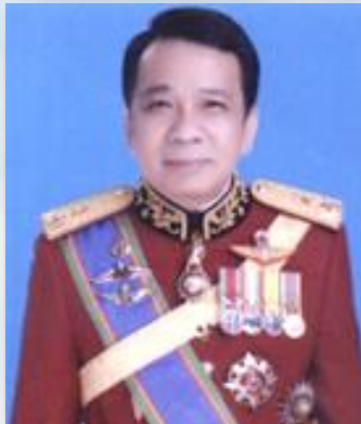
พลตรี วีระ โรจนวาส