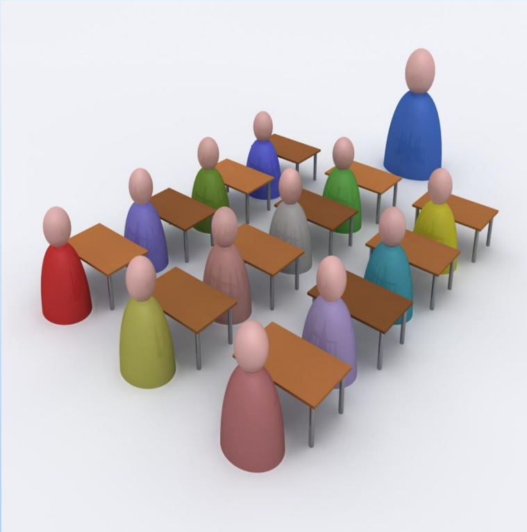
คณะกรรมการร่างรัฐธรรมนูญ

เมื่อจบการศึกษาภาคบังคับ เพื่อศึกษาตามความถนัดของตน