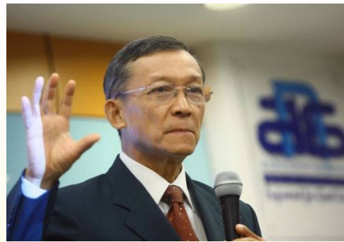
ศ. ร.ต.อ. ดร.ปุระชัย เปี่ยมสมบูรณ์

ดังนั้น เมื่อมีการจัดตั้งรัฐบาล ปัญหาที่ต้องเริ่มแก้ คือ ปัญหาด้านเศรษฐกิจ ซึ่งเป็นเรื่องที่สำคัญมากที่สุดเรื่องหนึ่ง โดยเฉพาะปัญหาปากท้องของประชาชนซึ่งเป็นเรื่องที่สามารถโค่นล้มรัฐบาลมาได้หลายรัฐบาลแล้ว ดังนั้น สิ่งที่ประชาชนคาดหวังมากที่สุด ณ ตอนนี้ก็คือนโยบายการช่วยเหลือเพื่อลดค่าครองชีพให้แก่ประชาชน ไม่ว่าจะเป็นเรื่องสินค้าเครื่องใช้อุปโภคบริโภคในชีวิตประจำวัน ราคาค่าน้ำค่าไฟ ค่าน้ำมันต่าง ๆ เป็นต้น