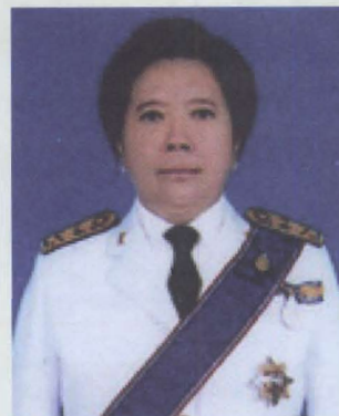
นางสาวสุภาสินี ชมะสุนทร รองเลขาธิการสภาผู้แทนราษฎร