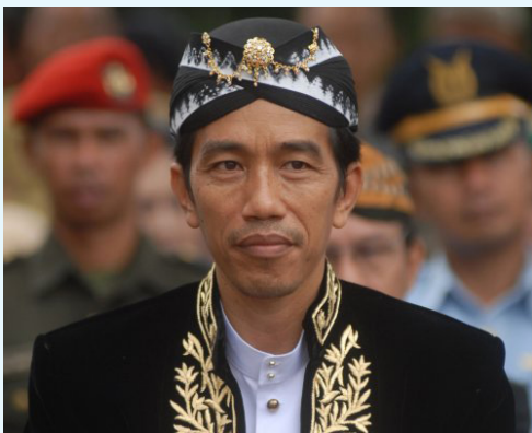
นายโจโก วิโดโด

และในวันฉลองเอกราช ประธานาธิบดีจะมีกำหนดการกล่าวต่อที่ประชุมรัฐสภา โดยมีประเด็นสำคัญคือความไม่เสมอภาคทางเศรษฐกิจ และภัยคุกคามจากกลุ่มหัวรุนแรง ซึ่งประธานาธิบดีกล่าวว่า จะต้องมีการทำงานร่วมกันเพื่อสร้างความเท่าเทียมกันทางเศรษฐกิจ ศาสนา การเมือง และสังคม เพื่อรับมือความท้าทายใหม่ในอนาคต ความไม่มั่นคงทางเศรษฐกิจ และการก่อการร้ายที่เป็นภัยคุกคาม โดยหวังว่าหน่วยงานของรัฐบาลจะมีความสามารถสร้างความเชื่อมั่นให้แก่ประชาชนได้