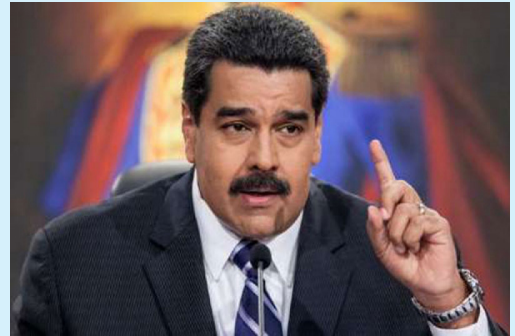
นายนิโกลัส มาดูโร

การยอมรับในอำนาจดังกล่าวถือเป็นการแสดงตัวอย่างให้กับสถาบันอื่น ๆ ของรัฐบาล โดยเฉพาะอย่างยิ่ง รัฐสภาที่อยู่ภายใต้การควบคุมของฝ่ายค้าน ซึ่งต่อต้านการจัดตั้งสมัชชาร่างรัฐธรรมนูญ และปฏิเสธที่จะยอมรับอำนาจของสมัชชาร่างรัฐธรรมนูญ โดยที่ผ่านมาพรรคฝ่ายค้านได้คว่ำบาตรการเลือกตั้งสมาชิกสมัชชาร่างรัฐธรรมนูญ ๕๔๕ คน เมื่อวันที่ ๓๐ กรกฎาคม ๒๕๖๐ เนื่องจากเชื่อว่าสมัชชาร่างรัฐธรรมนูญจะเปิดทางสู่การสืบทอดอำนาจเผด็จการของพรรคสังคมนิยม ทั้งนี้ สมัชชาร่างรัฐธรรมนูญมีสิทธิแก้ไขรัฐธรรมนูญและปฏิรูปรัฐบาล รวมทั้ง มีอำนาจสูงสุดเหนือหน่วยงานทั้งหมดของรัฐบาลด้วย