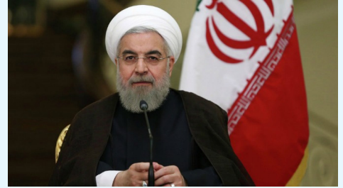
นายฮัสซัน โรฮานี

ทั้งนี้ เมื่อเดือนกรกฎาคมปี ๒๕๕๘ อิหร่านและ ๖ ประเทศมหาอำนาจ ได้แก่ สหราชอาณาจักร จีน ฝรั่งเศส เยอรมนี รัสเซีย และสหรัฐอเมริกา ได้ลงนามในแผนปฏิบัติการร่วมฉบับสมบูรณ์ หรือ Joint Comprehensive Plan of Action: JCPOA อย่างเป็นทางการ ซึ่งในแผนการดังกล่าวนี้ อิหร่านได้ให้คำมั่นว่าจะระงับกิจกรรมต่างด้านนิวเคลียร์ เช่น การเสริมสมรรถนะยูเรเนียม เพื่อแลกกับการยกเลิกมาตรการคว่ำบาตรในด้านพลังงานและการเงิน แต่ในช่วงเวลาที่ผ่านมานั้น คณะทำงานของนายดอนัลด์ ทรัมป์ ประธานาธิบดีสหรัฐอเมริกา ยังคงใช้มาตรการคว่ำบาตรต่ออิหร่านในระดับที่รุนแรงขึ้น โดยอ้างว่าอิหร่านยังคงพัฒนาโครงการซีปนาวูธ ทั้งนี้ นายโรฮานี จึงเพิกเฉยต่อข้อตกลงต่างๆ ของนานาชาติ ตั้งแต่ข้อตกลง JCPOA ไปจนถึงความตกลงปารีสว่าด้วยการแก้ปัญหาโลกร้อน และข้อตกลงหุ้นส่วนเศรษฐกิจภาคพื้น