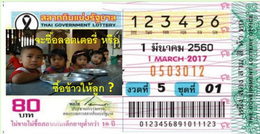
ภาพที่ ๑ ข้อเสนอแนะสลากกินแบ่งรัฐบาลที่มีภาพค่าเดือน