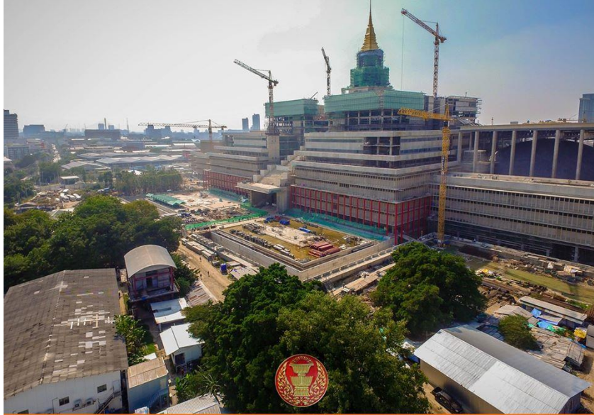
โครงการก่อสร้างอาคารรัฐสภาแห่งใหม่ พร้อมอาคารประกอบ