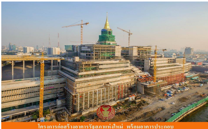
โครงการก่อสร้างอาคารรัฐสภาแห่งใหม่ พร้อมอาคารประกอบ