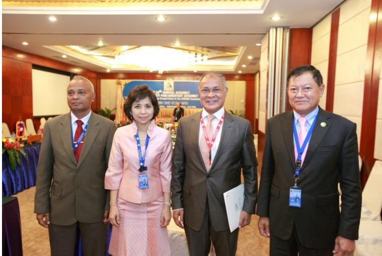
พลอากาศเอก อาคม กาญจนศิริ และ นางสาวรณิ สิริเวชชะพันธ์ สมาชิกสภานิติบัญญัติแห่งชาติ เข้าร่วมการประชุมหารือระหว่างประเทศสมาชิก AIPA สาธารณรัฐประชาธิปไตยติมอร์ - เลสเต