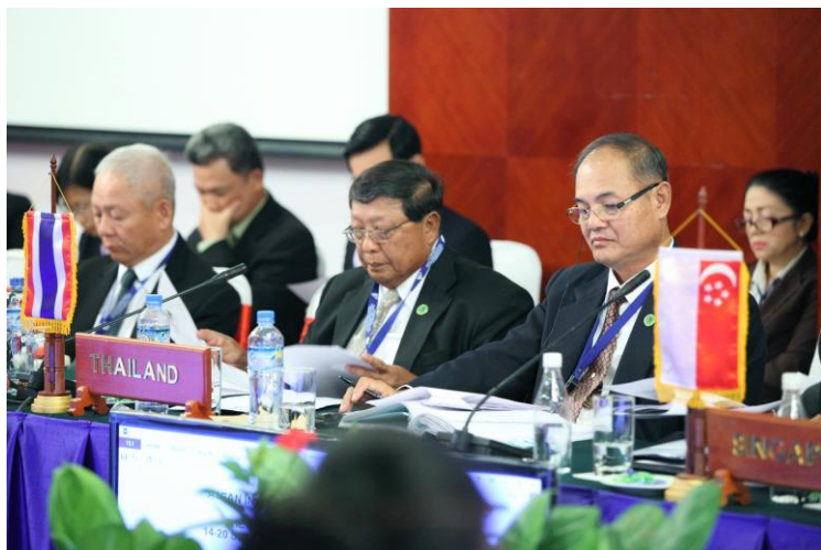
พลอากาศเอก ชาลี จันทร์เรือง และพลเอก สิงห์ศึก สิงห์ไพร สมาชิกสภานิติบัญญัติแห่งชาติ เข้าร่วมการประชุมคณะกรรมการด้านการเมือง ในการประชุมใหญ่สมาชิกรัฐสภาอาเซียน ครั้งที่ ๓๕

๓. ข้อมติว่าด้วยความร่วมมือเชิงรัฐสภาในการสร้างประชาคมการเมืองและความมั่นคงอาเซียน ที่ประชุมฯ ได้พิจารณาร่างข้อมติซึ่งมีสาระสำคัญ ในการยกระดับความร่วมมือของประเทศสมาชิก AIPA ต่อการสนับสนุนการเข้าสู่ประชาคมอาเซียนปี ๒๕๕๘ ผ่านแผนงานการจัดตั้งประชาคมการเมืองและความมั่นคงอาเซียน รวมถึงส่งเสริมบทบาทของสมาชิกรัฐสภาของประเทศสมาชิก AIPA ในการสนับสนุนการดำเนินการตามกฎบัตรอาเซียน ในการสร้างสันติภาพและความมั่นคงในภูมิภาค นอกจากนี้ ที่ประชุมฯ ยังให้ความสำคัญกับประเด็นการส่งเสริมความร่วมมือด้านความมั่นคงทางทะเล ภายใต้อนุสัญญาสหประชาชาติว่าด้วยกฎหมายทะเล พ.ศ. ๒๕๒๕ ปฏิญญาว่าด้วยแนวปฏิบัติของภาคีในทะเลจีนใต้และแนวปฏิบัติในทะเลจีนใต้ในกรอบอาเซียน