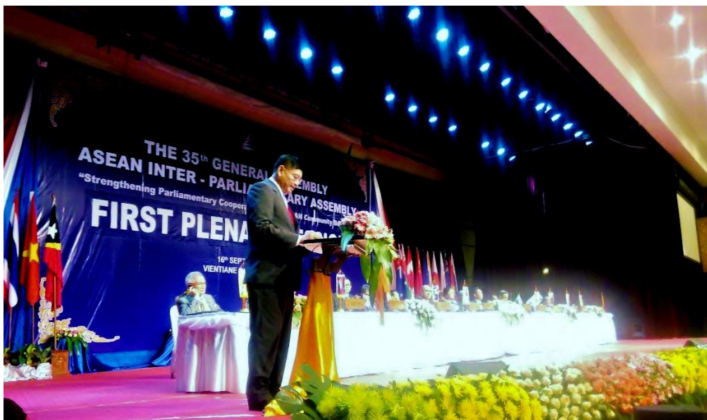
นายพีระศักดิ์ พอจิต รองประธานสภานิติบัญญัติแห่งชาติ คนที่สอง

ในตอนท้าย ในฐานะหัวหน้าคณะผู้แทนสภานิติบัญญัติแห่งชาติ ยังเน้นย้ำว่า สภานิติบัญญัติแห่งชาติ พร้อมจะเข้าร่วมทุกกิจกรรมในกรอบสมัชชารัฐสภาอาเซียน เพื่อยกระดับ AIPA ให้เป็นสถาบันที่มีบทบาทนำและทำงานเชิงรุกด้านนิติบัญญัติระดับภูมิภาค เพื่อสนับสนุนอาเซียนในการมุ่งสู่ประชาคมอาเซียนในปี ๒๕๕๘