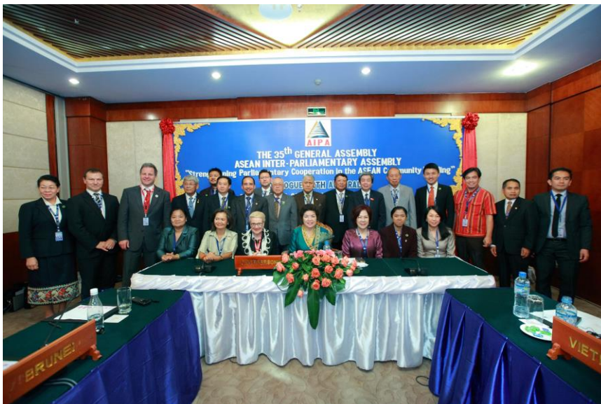
พลอากาศเอก ชาลี จันทร์เรือง สมาชิกสภานิติบัญญัติแห่งชาติ เข้าร่วมการประชุมหารือระหว่างประเทศสมาชิก AIPA กับเครือรัฐออสเตรเลีย

ทั้งนี้ พลอากาศเอก ชาลี จันทร์เรือง สมาชิกสภานิติบัญญัติแห่งชาติ กล่าวแสดงความยินดีกับออสเตรเลียในวาระครบรอบ ๔๐ ปี ความสัมพันธ์ระหว่างอาเซียน – ออสเตรเลีย รวมถึงหารือในประเด็นกรณีแผ่นดินไหวที่เกิดขึ้นทางภาคเหนือของไทยและพม่าในปี ๒๕๕๗ และความเป็นไปได้ที่ออสเตรเลียจะให้การสนับสนุนเงินทุนและแลกเปลี่ยนประสบการณ์ในการจัดการด้านภัยพิบัติ การตอบโต้อาณานิคมกับอาเซียน นอกจากนี้ยังได้กล่าวถึงการยกระดับความร่วมมือด้านความมั่นคงในภูมิภาค รวมทั้งการแลกเปลี่ยนการเยือนระหว่าง AIPA และเครือรัฐออสเตรเลีย อีกด้วย