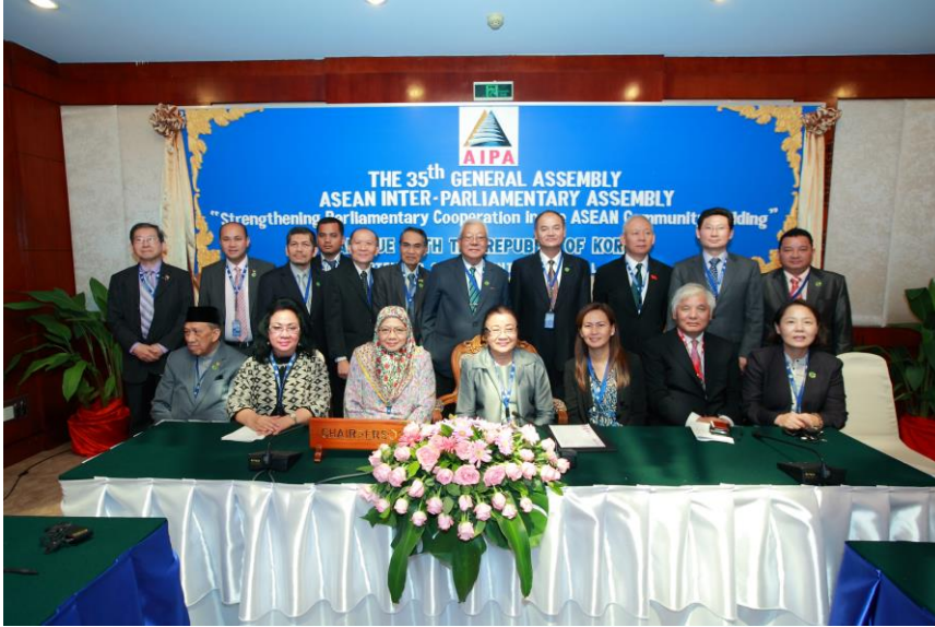
พลเอก ลิงห์ศึก ลิงห์ไพร์ สมาชิกสภานิติบัญญัติแห่งชาติ เข้าร่วมการประชุมหารือระหว่างประเทศสมาชิก AIPA กับสาธารณรัฐเกาหลี