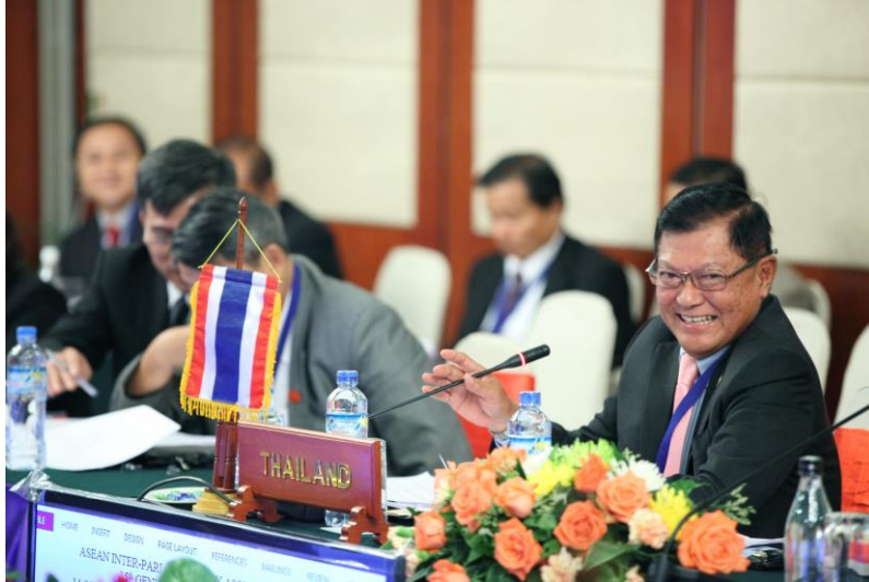
พลอากาศเอก อาคม กาญจนหิรัญ สมาชิกสภานิติบัญญัติแห่งชาติ เข้าร่วมการประชุมหารือระหว่างประเทศสมาชิก AIPA กับญี่ปุ่น