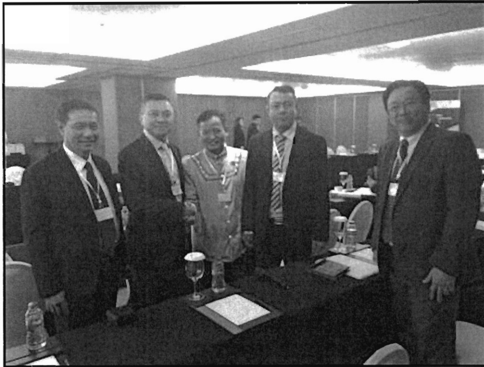
คณะผู้แทนสภานิติบัญญัติแห่งชาติถ่ายภาพร่วมกับคณะผู้แทนรัฐสภาสาธารณรัฐแห่งสหภาพเมียนมา

สอดคล้องระหว่างกฎหมายภายในกับกฎหมายและระเบียบวิธีปฏิบัติสากล และแสดงความชื่นชมความร่วมมือระหว่าง AIPA และกลุ่มรัฐสภาว่าด้วยอาวุธขนาดเล็กและอาวุธเบาในการจัดการสัมมนาครั้งนี้ ซึ่งถือเป็นครั้งแรกและเป็นจุดเริ่มต้นสำคัญที่จะนำไปสู่การพัฒนาความร่วมมือต่อไปในอนาคต