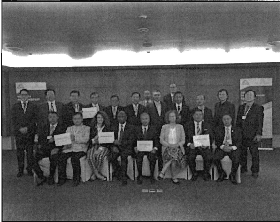
พิธีเปิดการสัมมนาระดับภูมิภาคของกลุ่มรัฐสภาว่าด้วยอาวุธขนาดเล็กและอาวุธเบา สำหรับรัฐสภาในเอเชียตะวันออกเฉียงใต้ผ่านกรอบสมัชชารัฐสภาอาเซียน (AIPA) วันที่ ๗ พฤษภาคม ๒๕๖๑

สัมมนาในครั้งนี่ยังมีเป้าหมายในการรวบรวมความคิดเห็นของรัฐสภาของภูมิภาคเอเชียตะวันออกเฉียงใต้ เพื่อรวบรวมข้อเสนอแนะและจัดทำเป็นรายงานเพื่อนำเสนอต่อการประชุมทบทวนแผนปฏิบัติการสหประชาชาติเกี่ยวกับปัญหาอาวุธขนาดเล็กและอาวุธเบา ครั้งที่ ๓ (Preparatory step to the United Nations Program of Action on Small Arms : UNPoA 3rd review conference) ซึ่งจะจัดขึ้นระหว่างวันที่ ๑๘ – ๒๙ มิถุนายน ๒๕๖๑ ณ นครนิวยอร์ก สหรัฐอเมริกา