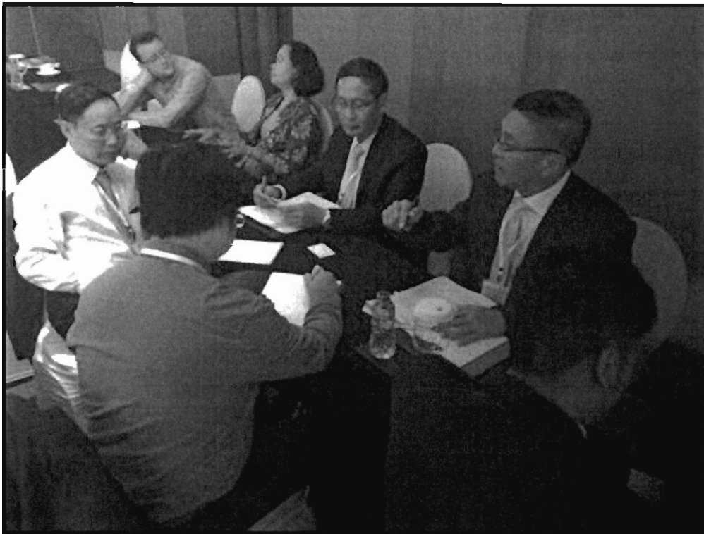
คณะผู้แทนสภานิติบัญญัติแห่งชาติร่วมการประชุมกลุ่มย่อยระหว่างการสัมมนา

พันธกรณีและให้สัตยาบันต่อข้อตกลงระหว่างประเทศว่าด้วยอาวุธขนาดเล็กและอาวุธเบา ๒) การปรับปรุงและออกกฎหมายที่เกี่ยวข้องกับการป้องกันและปราบปรามปัญหาอาวุธขนาดเล็กและอาวุธเบา และ ๓) การสร้างความตระหนักรู้ในบริบทของสมาชิกรัฐสภา ทั้งนี้ เห็นควรว่าการดำเนินการจะมีประสิทธิภาพได้นั้นจะต้องเกิดจากการควบคุมดูแลอย่างเคร่งครัดของสหประชาชาติจากบนลงล่าง ผ่านการรายงานผลการปฏิบัติประจำปี การประเมินผล และการให้ความช่วยเหลือเฉพาะทาง ทั้งด้านการเงิน การบริหารจัดการข้อมูล การแลกเปลี่ยนประสบการณ์ และการพัฒนาศักยภาพของบุคลากรที่เกี่ยวข้อง โดยมีอุปสรรคที่สำคัญ ๓ ประการ ได้แก่ ๑) ความยากจนของประชาชน ๒) การจัดการภายหลังสงคราม (Post-war management) และ ๓) การสร้างความตระหนักรู้ในสังคม