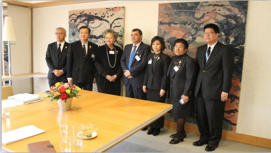
คณะผู้แทนสภานิติบัญญัติแห่งชาติ พร้อมด้วยเอกอัครราชทูต ผู้แทนถาวรไทยประจำสหประชาชาติ ณ นครเจนีวา ถ่ายภาพร่วมกับประธานสหภาพรัฐสภา

❖ วันจันทร์ที่ ๒๔ ตุลาคม ๒๕๕๙ เวลา ๑๒.๐๐ นาฬิกา