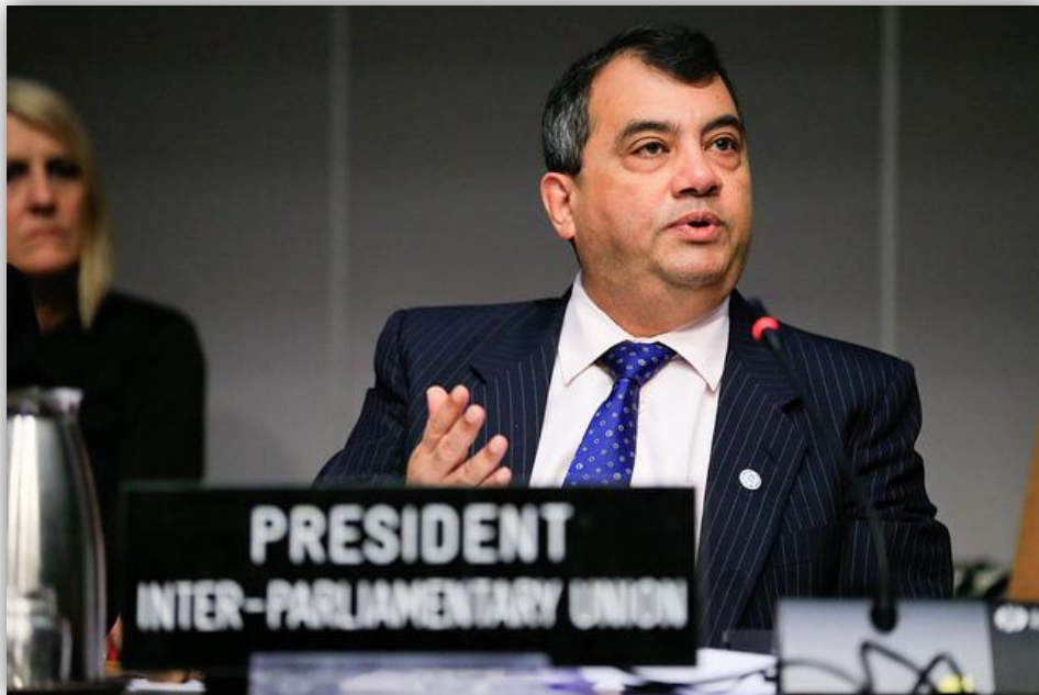
นายซาเบอร์ โฮชเซน ชาว์ดรี (Mr. Saber Hossain Chowdhury) ประธานสหภาพรัฐสภา ทำหน้าที่ประธานการประชุมสมัชชาสหภาพรัฐสภา ครั้งที่ ๑๓๕

เมื่อวันจันทร์ที่ ๒๔ ตุลาคม ๒๕๕๙ เวลา ๑๑.๐๐ นาฬิกา ณ ศูนย์การประชุมนานาชาติ นครเจนีวา สมาพันธรัฐสวิส นายซาเบอร์ โฮชเซน ชาว์ดรี (Mr. Saber Hossain Chowdhury) ประธานสหภาพรัฐสภา ทำหน้าที่ประธานการประชุมสมัชชาสหภาพรัฐสภา ครั้งที่ ๑๓๕ (The 135 th Assembly of the Inter-Parliamentary Union) และในพิธีเปิดการประชุมอย่างเป็นทางการ ได้กล่าวถึงหัวข้อในการอภิปรายทั่วไปในครั้งนี้อ่า เป็นหัวข้อที่พ้องกับการครบรอบ ๔๐ ปีของการก่อตั้งคณะกรรมการสหภาพรัฐสภาว่าด้วยสิทธิมนุษยชนของสมาชิก-รัฐสภา ซึ่งที่ประชุมฯ จะได้อภิปรายต่อปัญหาสิทธิมนุษยชนที่เกิดขึ้นทั่วโลก อาทิ ปัญหาบุคคลชายขอบ การกีดกันทางการเมือง ความขัดแย้งทางศาสนา และความยากจนที่สามารถนำไปสู่การปะทะและปัญหาความขัดแย้งตลอดจนปัญหาการเหยียดเพศ การล่วงละเมิดทางเพศ และการใช้ความรุนแรงต่อสตรีในรัฐสภาอันแสดงถึงสิ่งที่ยังต้องดำเนินการต่อไปเพื่อปกป้องและสนับสนุนสมาชิกรัฐสภาสตรี นอกจากนี้ ประธานสหภาพรัฐสภายังได้กล่าวถึงสิ่งสำคัญในการประชุมครั้งนี้อีกสองสิ่ง คือ การรับรองร่างยุทธศาสตร์สหภาพรัฐสภา ระหว่างปี ๒๕๖๐ – ๒๕๖๔ ที่ได้รับการทบทวนแล้ว และการเพิ่มภาษาอาหรับและสเปนเพื่อใช้แสดงเนื้อหาของเว็บไซต์รูปแบบใหม่ของสหภาพรัฐสภา