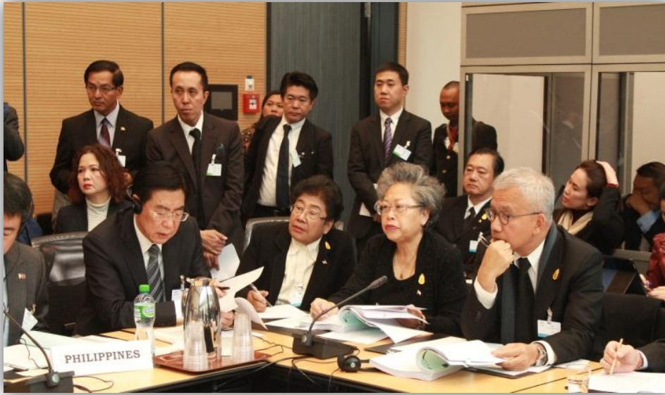
คณะผู้แทนสถานิติบัญญัติแห่งชาติ ระหว่างเข้าร่วมการประชุมกลุ่มอาเซียน + ๓

ในวาระอื่น ๆ กัมพูชา จีน และมาเลเซียหยิบยกประเด็นด้านสิทธิมนุษยชนของสมาชิกรัฐสภา ซึ่งต่างมีความเห็นตรงกันว่าเรื่องดังกล่าวเกี่ยวข้องกับการตีความและการดำเนินการทางกฎหมายภายใน และอาจแตกต่างกันตามบริบทของประเทศนั้น ๆ การตัดสินใจและเปรียบเทียบสถานการณ์ด้านสิทธิมนุษยชนของประเทศหนึ่งกับอีกประเทศหนึ่งจึงอาจดูเป็นสิ่งที่ไม่ถูกต้องนัก รวมถึงสิทธิในการชี้แจงต่อที่ประชุมคณะมนตรี-สหภาพรัฐสภาของรัฐสภาสมาชิกที่มีประเด็นด้านสิทธิมนุษยชนของสมาชิกรัฐสภา