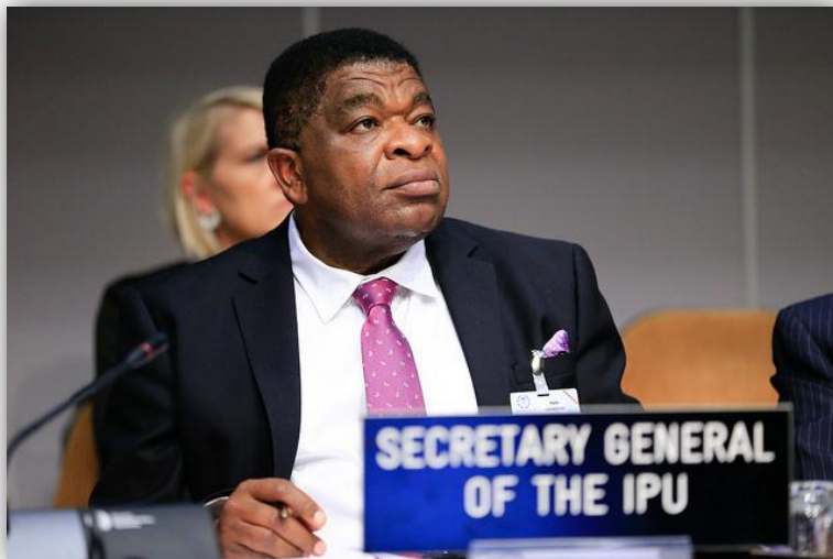
นายมาร์ติน จุนกอง เลขาธิการสหภาพรัฐสภา