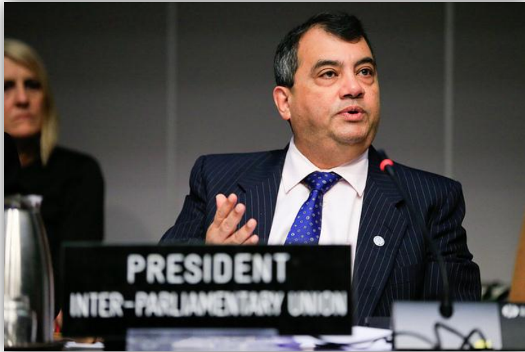
นายซาแบร์ โยซเซน เซา์ดรี ประธานสหภาพรัฐสภา