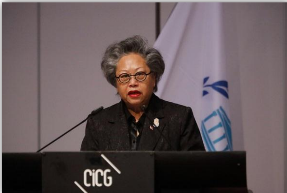
นางพิไลพรธม สมบัติศิริ ประธานคณะกรรมการการต่างประเทศ สภานิติบัญญัติแห่งชาติ และหัวหน้าคณะผู้แทนสภานิติบัญญัติแห่งชาติ ได้กล่าวอภิปรายทั่วไป ในหัวข้อ "การละเมิดสิทธิมนุษยชน ในฐานะที่เป็นสัญญาณแห่งความขัดแย้ง : รัฐสภาในฐานะผู้ตอบสนองต่อปัญหาให้ทันการณ์"

- สร้างความมั่นใจว่าเจ้าหน้าที่ผู้มีหน้าที่บังคับใช้กฎหมายจะดำเนินการตามความจำเป็นเสมอและเคารพมาตรฐานสิทธิมนุษยชนสากล