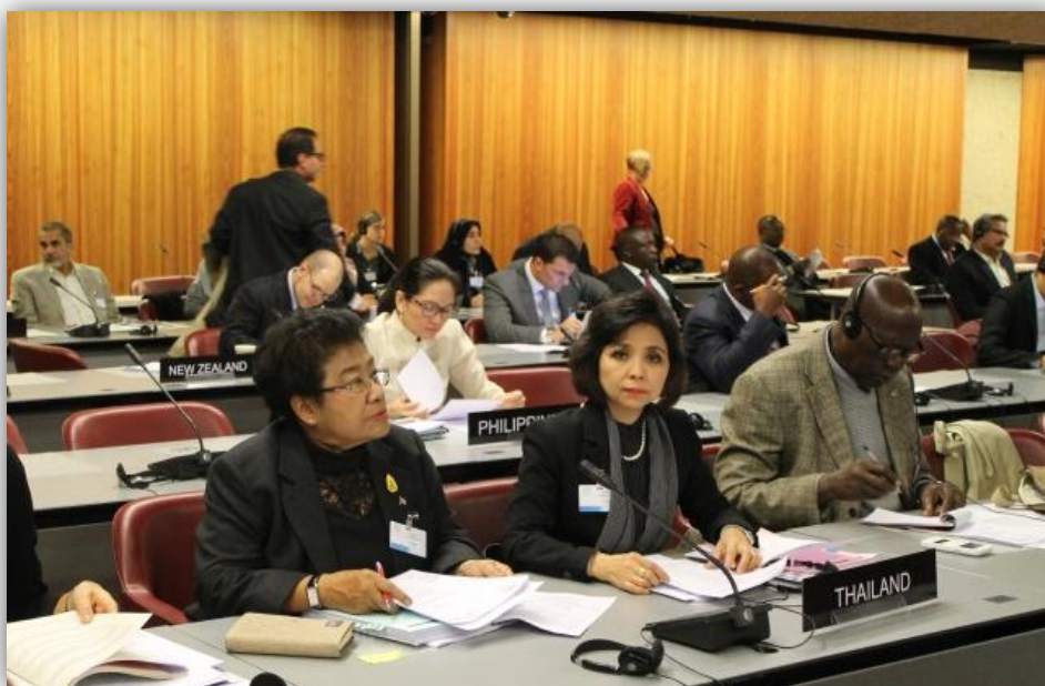
คณะผู้แทนสภานิติบัญญัติแห่งชาติ ระหว่างเข้าร่วมการประชุมคณะกรรมการสิทธิมนุษยชน สภาพรัฐสภาว่าด้วยประชาธิปไตยและสิทธิมนุษยชน

❖ วันจันทร์ที่ ๒๔ และวันพุธที่ ๒๖ ตุลาคม ๒๕๕๙