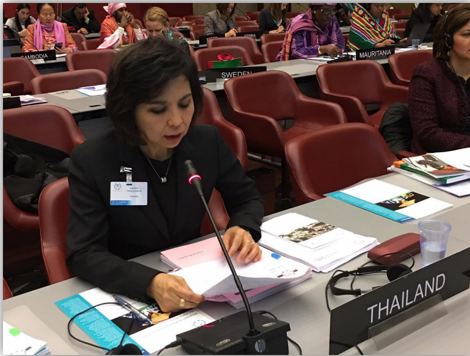
นางสุวรรณี สิริเวชชะพันธ์ สมาชิกสภานิติบัญญัติแห่งชาติ ในการประชุมสหภาพรัฐสภาสตรี ครั้งที่ ๒๔

ส่วนในช่วงเวลา ๑๔.๓๐ - ๑๗.๓๐ นาฬิกา เป็นการอภิปรายในหัวข้อ "การประกันสิทธิและอนาคตของสตรีและเด็กหญิงในห้วงเวลาแห่งสงครามและความขัดแย้ง" (Securing the rights and future of women and girls during war and conflict) ที่ประชุมได้อภิปรายให้เห็นความชัดเจนของโครงการต่าง ๆ จำนวนมากที่ทำให้สตรีและเด็กหญิงสามารถเข้ารับการศึกษ เข้าถึงการดูแลสุขภาพ รับการฝึกอบรมอาชีพ และกิจกรรมสร้างรายได้อื่น ๆ ในห้วงเวลาแห่งความขัดแย้ง เป็นผู้พลัดถิ่น และเป็นผู้อพยพ ผู้เข้าร่วมอภิปรายหลายท่านเห็นว่าเป็นเรื่องจำเป็นสำคัญที่สตรีและเด็กจะต้องสามารถได้รับการบริการขั้นพื้นฐาน ได้รับการตระหนักถึงสิทธิของเขาและได้รับโอกาสต่าง ๆ ไม่ว่าจะอยู่ ณ ที่แห่งใดก็ตาม และเรียกร้องให้มีการปฏิบัติตามข้อมติของคณะมนตรีความมั่นคงแห่งสหประชาชาติ ที่ ๑๓๒๕ ว่าด้วยผู้หญิง สันติภาพ และความมั่นคง อย่างเคร่งครัด โดยให้ผู้หญิงได้เข้ามามีส่วนร่วมในการตัดสินใจในทุกระดับโดยการเพิ่มจำนวนผู้หญิงในกองกำลังรักษาสันติภาพให้มากขึ้นและนำผู้กระทำความผิดที่กระทำการล่วงละเมิดทางเพศในช่วงเวลาสงครามเข้าสู่กระบวนการยุติธรรม นอกจากนี้ ผู้เข้าร่วมประชุมยังได้เรียกร้องให้มีการแต่งตั้งผู้หญิงเป็นทูตพิเศษเพื่อสันติภาพด้วย