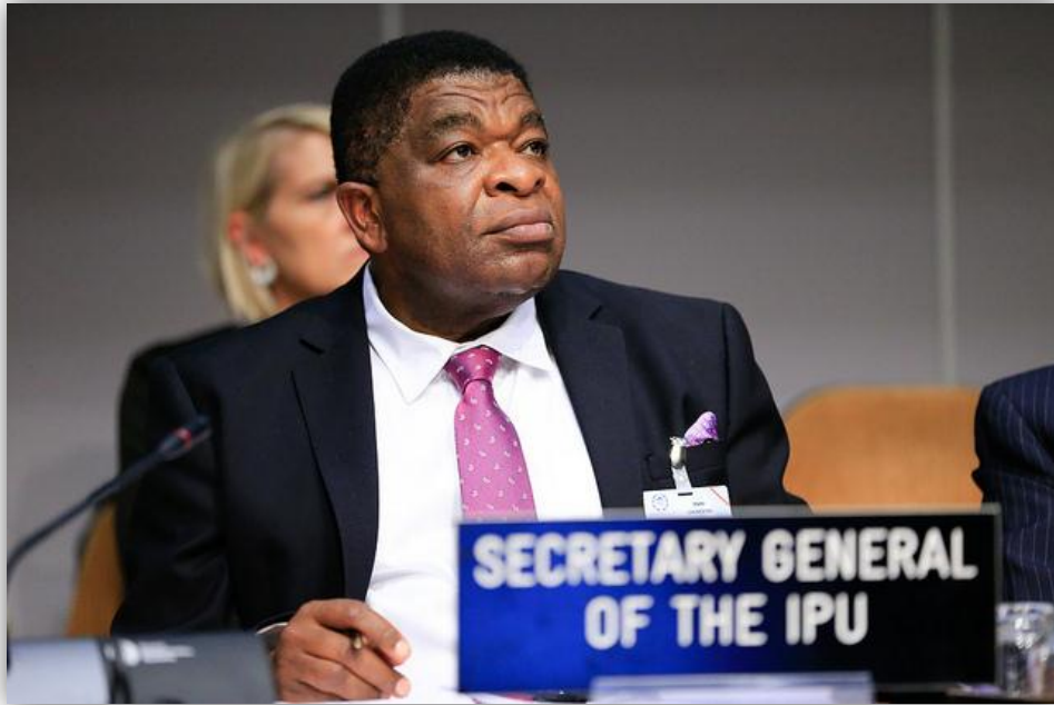
นายมาร์ติน จุนกอง เลขาธิการสหภาพรัฐสภา ในพิธีเปิดการประชุมสมัชชาสหภาพรัฐสภา ครั้งที่ ๑๓๕