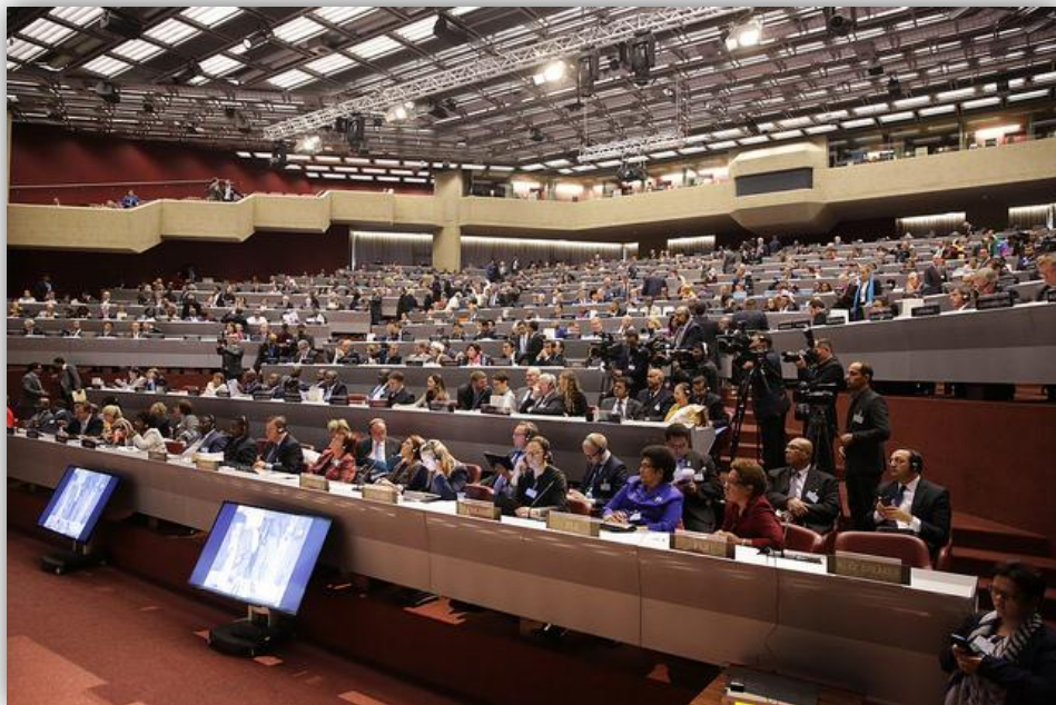
บรรยากาศในการประชุมสมัชชาสหภาพรัฐสภา ครั้งที่ ๑๓๕