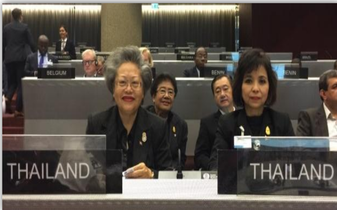
คณะผู้แทนสถานิติบัญญัติแห่งชาติ ระหว่างเข้าร่วมการประชุมคณะกรรมการบริหารสหภาพรัฐสภา ครั้งที่ ๑๙๙