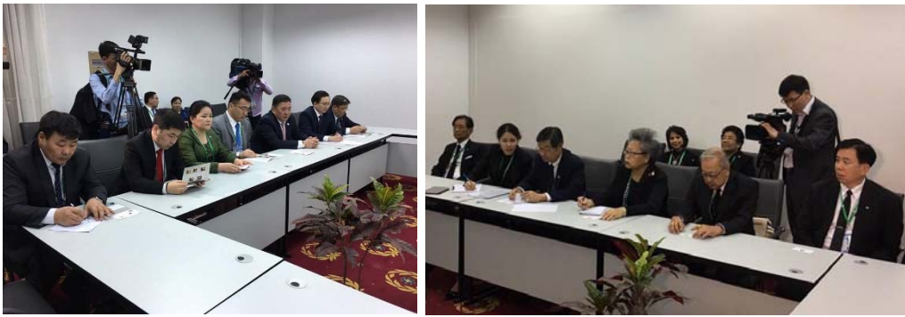
นายสุรชัย เลี้ยงบุญเลิศชัย รองประธานสภานิติบัญญัติแห่งชาติ คนที่หนึ่ง ในฐานะหัวหน้าคณะผู้แทนสภานิติบัญญัติแห่งชาติ นำคณะผู้แทนฯ เข้าพบหารือกับ H.E. Mr. Miyegombo Enkhbold ประธานรัฐสภามองโกเลีย และคณะผู้แทนรัฐสภามองโกเลีย

นอกจากนี้ ทั้งสองฝ่ายยังได้หารือเกี่ยวกับความสัมพันธ์ระหว่างประเทศไทยและมองโกเลีย ซึ่งปีนี้ นับเป็นปีที่ความสัมพันธ์ระหว่างประเทศไทยและมองโกเลียครบรอบ ๔๓ ปี และการหารือทวิภาคีระหว่าง รองประธานสภานิติบัญญัติแห่งชาติ คนที่หนึ่ง กับประธานรัฐสภามองโกเลีย และคณะผู้แทนรัฐสภามองโกเลียในครั้งนี้ จะเป็นการกระชับความสัมพันธ์ระหว่างสองประเทศซึ่งจะนำไปสู่ความร่วมมือระหว่างรัฐสภาของประเทศทั้งสองต่อไป ในอนาคต ในโอกาสนี้ รองประธานสภานิติบัญญัติแห่งชาติ คนที่หนึ่ง ได้เชิญให้ประธานรัฐสภามองโกเลียเดินทางเยือน ประเทศไทยด้วย