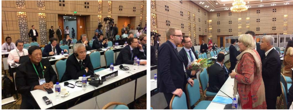
พลอากาศเอก ชาลี จันทร์เรือง ประธานคณะกรรมการการวิทยาศาสตร์ เทคโนโลยี สารสนเทศ และการสื่อสารมวลชน สภานิติบัญญัติแห่งชาติ และนายอนุศาสน์ สุวรรณมงคล สมาชิกสภานิติบัญญัติแห่งชาติ เข้าร่วมการประชุมคณะกรรมการสามัญสหภาพรัฐสภาว่าด้วยสันติภาพและความมั่นคงระหว่างประเทศ และร่วมพิจารณาแก้ไขร่างข้อมติเรื่อง “บทบาทของรัฐสภาในการเคารพต่อหลักการไม่แทรกแซงกิจการภายในของรัฐ”

สามัญสหภาพรัฐสภาว่าด้วยสันติภาพและความมั่นคงระหว่างประเทศ ณ ห้อง Celebrity Hall โดยที่ประชุมฯ ในวันที่สามได้พิจารณาการให้การรับรองร่างข้อมติฯ อย่างไรก็ดี ที่ประชุมฯ มีมติแก้ไขข้อหัวข้อจากเดิมเป็น “บทบาทของรัฐสภาในการเคารพต่อหลักการไม่แทรกแซงกิจการภายในของรัฐ” (The role of parliament in respecting the principle of non-intervention in the internal affairs of States) และให้การรับรองร่างข้อมติดังกล่าว