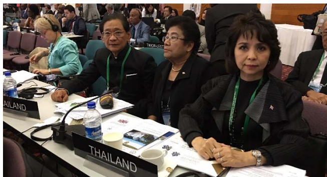
คณะผู้แทนสภานิติบัญญัติแห่งชาติ ระหว่างเข้าร่วมการประชุมคณะมนตรีบริหารสหภาพรัฐสภา

โอกาสนี้ ที่ประชุมฯ ได้พิจารณาระเบียบวาระการประชุม พิจารณาข้อเสนอแนะของคณะกรรมการบริหารของสหภาพรัฐสภาในเรื่องการขอกลับเข้าเป็นสมาชิกสหภาพรัฐสภาของรัฐสภาแห่งสาธารณรัฐแอฟริกากลาง และการขอเข้าเป็นสมาชิกสหภาพรัฐสภาของรัฐสภาตุวาลู นอกจากนี้ ที่ประชุมฯ ยังได้รับฟังรายงานจากเลขาธิการสหภาพรัฐสภาเกี่ยวกับสถานการณ์ด้านสิทธิมนุษยชน พัฒนาการทางการเมืองของประเทศสมาชิกต่าง ๆ การดำเนินการตามแผนยุทธศาสตร์ของสหภาพรัฐสภา ปี ๒๕๖๐ - ๒๕๖๔ และความร่วมมือกับระบบงานขององค์การสหประชาชาติ