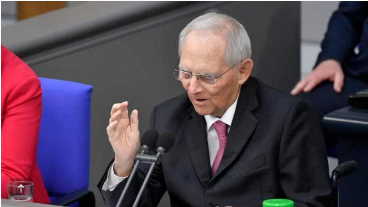
Bundestagspräsident Wolfgang Schäuble.

สรุป สภาผู้แทนราษฎรมีมติไม่เห็นชอบต่อข้อมติและรายงานของคณะกรรมการ ตามเอกสารหมายเลข ๑๙/๒๕๓๐๗