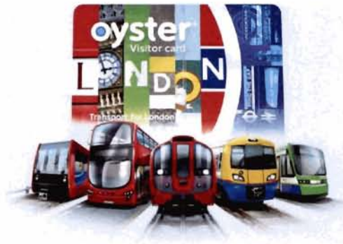
ภาพที่ 1 ตัวอย่างตั๋วร่วม Oyster card ของประเทศอังกฤษ

ระบบตั๋วร่วม เป็นระบบที่ฟังดูใหม่ในบ้านเรา แต่ในต่างประเทศมีใช้มานานแล้วทั้งในยุโรปและเอเชีย เป็นระบบตั๋วที่สามารถใช้บริการขนส่งสาธารณะได้ทุกรูปแบบทั้งรถโดยสารสาธารณะ (รถเมล์) รถไฟฟ้า เรือ รวมถึงการชำระค่าผ่านทางพิเศษต่าง ๆ หรือจะนำไปใช้กับบริการนอกภาคขนส่ง เช่น ร้านอาหาร ร้านสะดวกซื้อ ที่จอดรถ หากมีการติดตั้งด้วยระบบเดียวกัน จะช่วยให้ประชาชนได้รับความสะดวกสบายในการเชื่อมต่อการเดินทางเมื่อต้องการเปลี่ยนระบบหรือเส้นทาง โดยไม่ต้องกังวลการแลกเหรียญ แลกบัตรให้เสียเวลา ซึ่งบัตรนี้ จะทำหน้าที่เป็นตั๋วร่วมเชื่อมโยงทุกการเดินทางไว้ในบัตรเดียว สำหรับประเทศไทยมีชื่อเรียกว่า “บัตรแมงมุม” เป็นบัตรเพื่อการรองรับบริการขนส่งในรูปแบบระบบตั๋วร่วม (Common Ticketing System) ที่กระทรวงคมนาคม พยายามผลักดัน ที่มาของชื่อ “บัตรแมงมุม” ใช้เปรียบกับใยของแมงมุมที่มีสายใยเชื่อมโยงต่อเนื่อง (กรุงเทพฯธุรกิจ, 2560) การใช้บริการระบบขนส่งสาธารณะโดยสามารถใช้บัตรเพียงใบเดียว สำหรับการเดินทางในภาคขนส่งได้ทุกระบบ เช่นเดียวกับเมืองใหญ่ทั่วโลกที่มีระบบตั๋วร่วมเพื่อการขนส่งสาธารณะมากมาย เช่น ลอนดอน ประเทศอังกฤษมี Oyster card เกาหลีใต้มี T Money card และฮ่องกง มี Octopus card (themomentum, 2560)