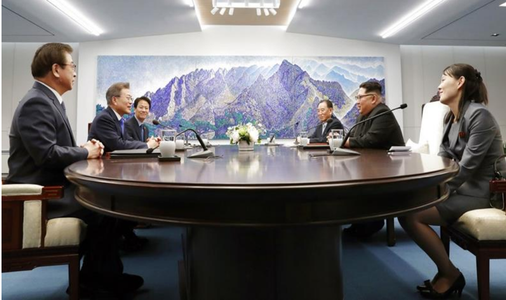
ภาพที่ 4 บรรยากาศบนโต๊ะเจรจาระหว่างผู้นำของเกาหลีเหนือและเกาหลีใต้

โดยรวมกันเป็นหนึ่งอย่างสันติ ไม่คำนึงถึงความเชื่อและอุดมการณ์ แต่ในปัจจุบันอนาคตของการรวมประเทศ ยังคงอีกยาวนาน เพราะทั้งสองชาติมีสภาพเศรษฐกิจและสังคมไม่สอดคล้องกันแล้วหลังจากแยกกันมา ประมาณกว่า 65 ปี (อนาคตของสันติภาพคาบสมุทรเกาหลี, 2561)