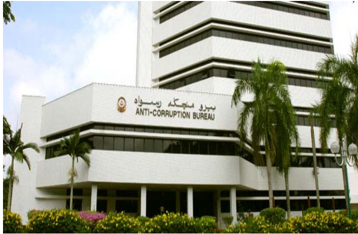
ภาพที่ 1 “สำนักงานต่อต้านการทุจริต” (Anti-Corruption Bureau: ACB)