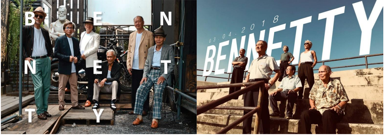
ภาพที่ 3 ภาพสมาชิกวง Bennetty