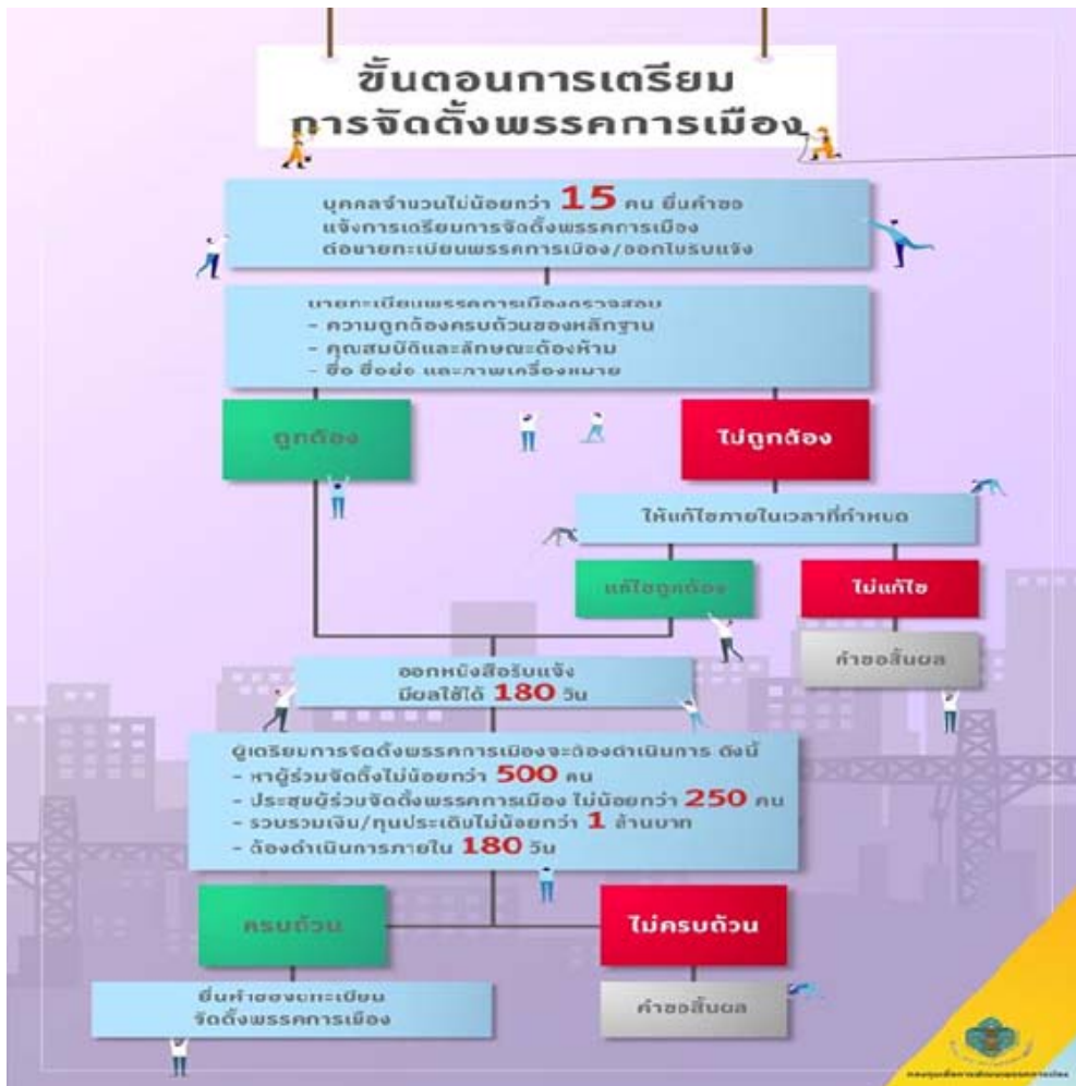
ภาพที่ 1 ขั้นตอนการเตรียมการจัดตั้งพรรคการเมือง