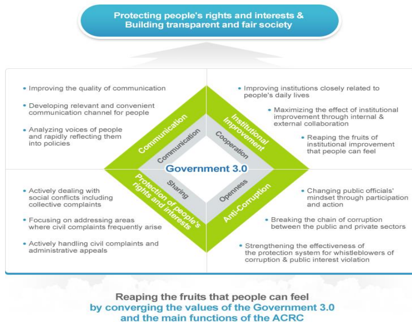
ภาพที่ 2 แผนภาพพันธกิจและวิสัยทัศน์ของสำนักงานคณะกรรมการต่อต้านการทุจริตและสิทธิพลเมืองแห่งเกาหลีใต้

ทั้งนี้ ACRC มีการกำหนดพันธกิจและวิสัยทัศน์ ปรากฏตามรูปภาพ ดังนี้