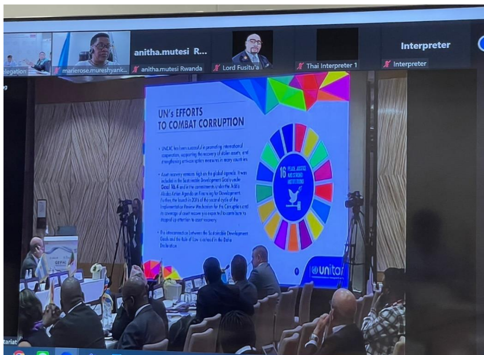
บรรยากาศการประชุมเสวนาช่วงที่ ๒