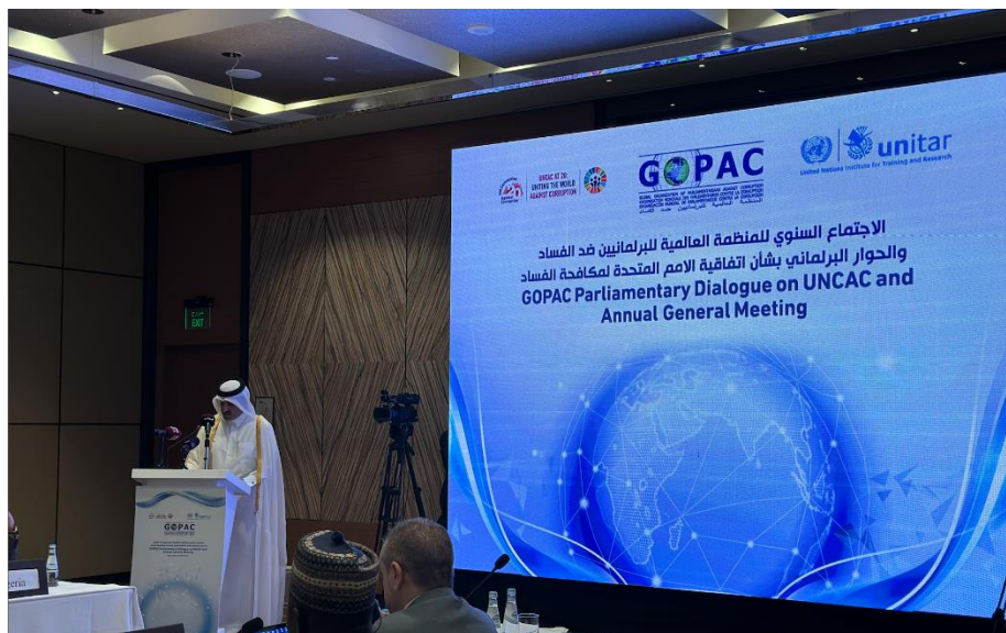
นาย Hassan bin Abdulla Al-Ghanim ประธานสภาที่ปรึกษารัฐกาตาร์

นาย Hassan bin Abdulla Al-Ghanim ได้กล่าวต้อนรับผู้เข้าร่วมประชุม และกล่าวถึงความสำคัญของบทบาทและความพยายามของรัฐสภาในการผ่านกฎหมายในการต่อต้านการทุจริต พร้อมทั้งเห็นควรนำวิธีการต่อต้านการทุจริตในอนุสัญญา UNCAC ไปปฏิบัติใช้ นอกจากนี้ ประชาธิปไตยและอำนาจนิติบัญญัติถือเป็นส่วนสำคัญในการแก้ปัญหาการทุจริตที่ไม่ควรให้มีการแทรกแซงอำนาจนิติบัญญัติของประเทศที่อาจส่งผลต่อการทุจริต โดยการเสวนาครั้งนี้ถือเป็นหนึ่งในการร่วมกันแก้ไขปัญหาการทุจริตโดยร่วมกันอภิปรายและแลกเปลี่ยนความคิดเห็น พร้อมยกตัวอย่างเครื่องมือในการต่อต้านการทุจริตและความก้าวหน้าในการผลักดันตามอนุสัญญา UNCAC ของแต่ละประเทศ