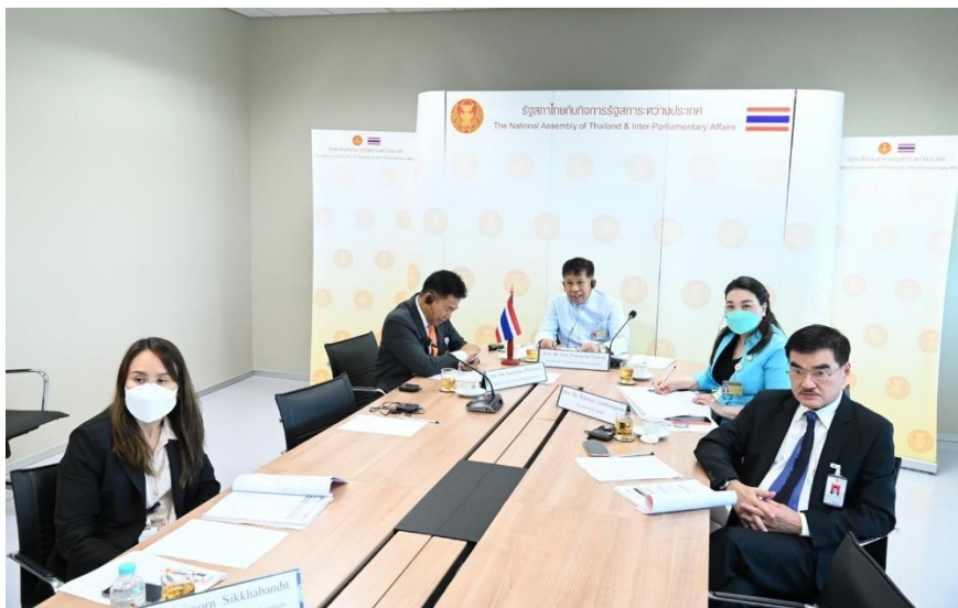
คณะผู้แทนรัฐสภาไทยในระหว่างการประชุมเสวนาของรัฐสภา เกี่ยวกับอนุสัญญาสหประชาชาติว่าด้วยการต่อต้านการทุจริต ปี ๒๕๖๖