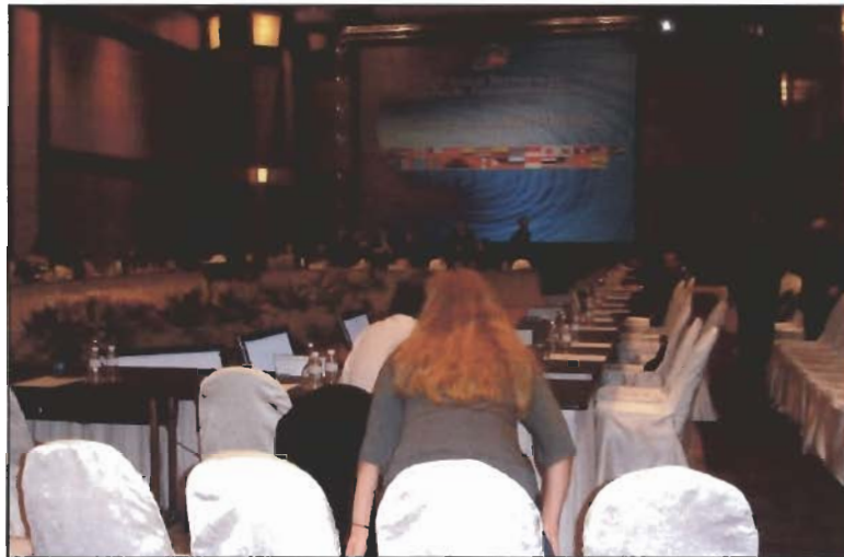
ภาพบรรยากาศห้องประชุมคณะกรรมการยกร่าง

การประชุมคณะกรรมการยกร่างจัดขึ้นระหว่างวันที่ ๑๕-๒๐ มกราคม ๒๕๕๑ เพื่อทำหน้าที่พิจารณาร่างข้อมติ (Draft Resolutions) ซึ่งเสนอโดยประเทศสมาชิก รวมทั้งพิจารณาและยกร่างแถลงการณ์ร่วม (Joint Communiqué) ซึ่งเป็นเอกสารสุดท้ายของการประชุมที่ได้สรุปรวมสาระสำคัญจากการประชุม โดยมีข้อมติในประเด็นต่างๆ ที่ผ่านการเห็นชอบจากที่ประชุมฯ จำนวน ๑๔ ข้อมติ (จากจำนวน ๑๗) ร่างข้อมติที่ประเทศต่างๆ เสนอ) เพื่อเสนอให้ที่ประชุมเต็มคณะรับรอง จำนวน ๑๔ ข้อมติ ได้แก่