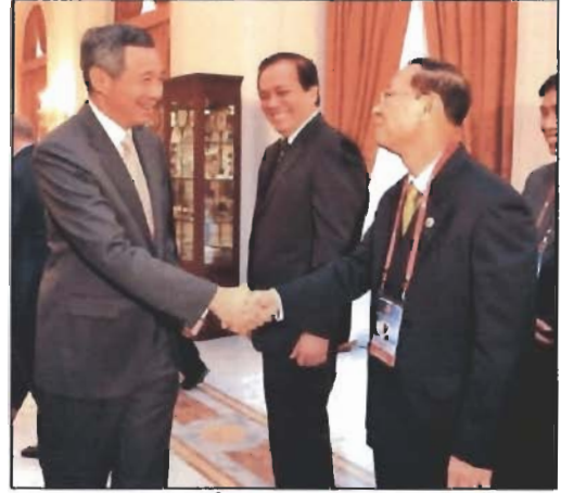
ประธานวุฒิสภาเข้าเยี่ยมคารวะนาย Lee Hsien Loong นายกรัฐมนตรีสิงคโปร์