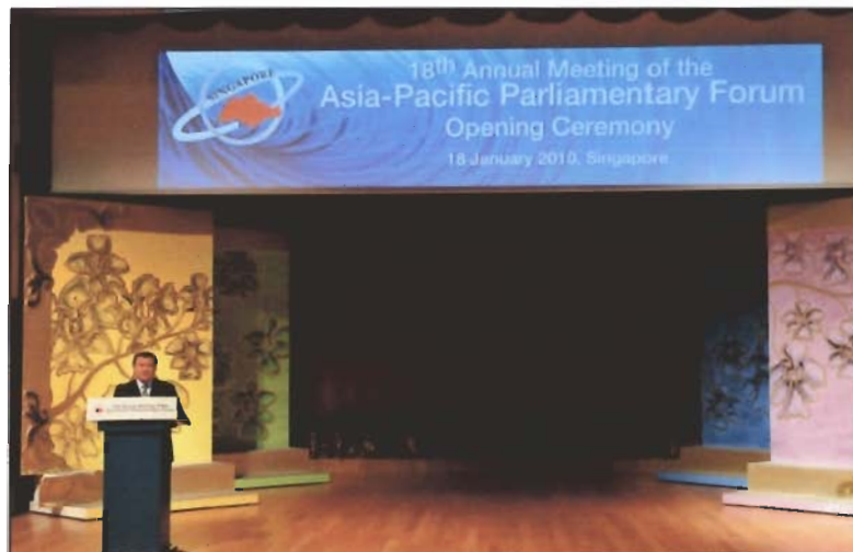
นาย .Abdullah Tarmugi ประธานรัฐสภาสิงคโปร์และประธาน .APPF ครั้งที่ ๑๘ กล่าวเปิดการประชุม