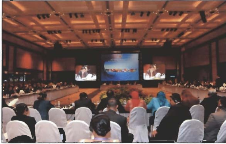
ภาพบรรยากาศห้องประชุมเต็มคณะ

ที่ประชุมฯ ได้พิจารณาเรื่องต่างๆ ตามวาระของการประชุมใน ๔ วาระ และรับรองร่างข้อมติ จำนวน ๑๔ ข้อมติ ประกอบด้วย