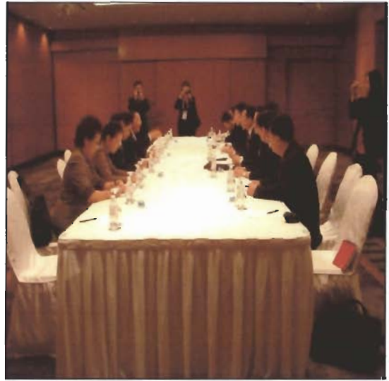
คณะผู้แทนไทยหารือทวิภาคีกับคณะผู้แทนจีน