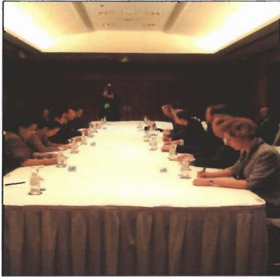
คณะผู้แทนไทยหารือทวิภาคีกับคณะผู้แทนรัสเซีย