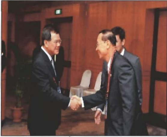
ประธานวุฒิสภาเข้าเยี่ยมคารวะนาย .Abdullah Tarmugi และประธานรัฐสภาสิงคโปร์และประธาน .APPF