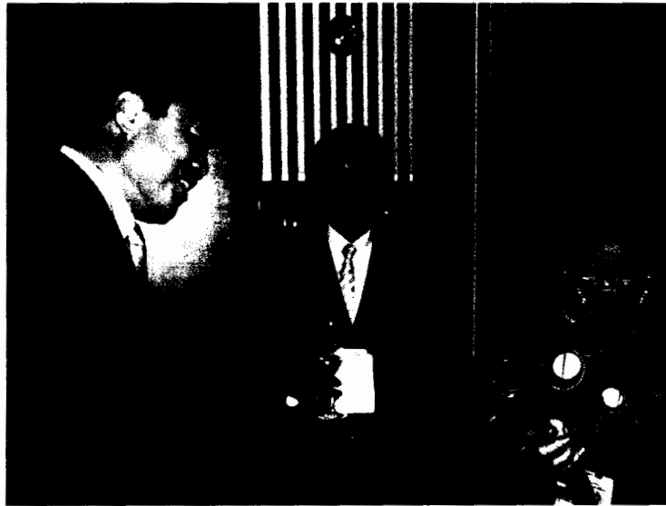
พลโท พงศ์เอก อภิรักษ์โยธิน สมาชิกวุฒิสภาและผู้แทนรัฐสภาไทย พูดคุยกับผู้แทนรัฐสภาสาธารณรัฐเกาหลี