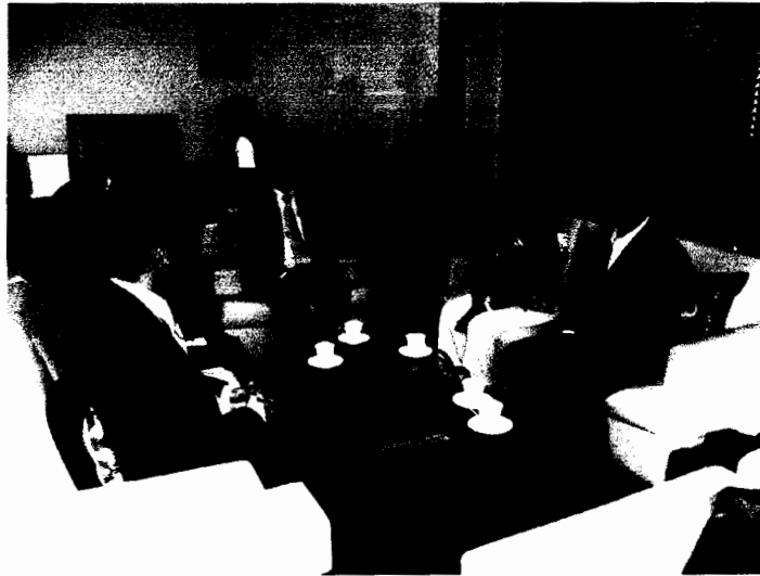
คณะผู้แทนรัฐสภาไทยเข้าพบนายชียยงค์ สัจจิตานนท์ เอกอัครราชทูต ณ กรุงโซล ที่สถานเอกอัครราชทูต (วันจันทร์ที่ ๔ กรกฎาคม ๒๕๕๔)

๒. บทบาทของคณะผู้แทนรัฐสภาไทยในการเข้าพบเอกอัครราชทูต ณ กรุงโซล : ในการเดินทางเข้าร่วมการประชุมดังกล่าว คณะผู้แทนรัฐสภาไทย ได้มีโอกาสเข้าพบนายชียยงค์ สัจจิตานนท์ เอกอัครราชทูต ณ กรุงโซล ที่สถานเอกอัครราชทูต โดยได้มีการพูดคุยเกี่ยวกับประเด็นของคณงานไทยที่เดินทางไปทำงานที่สาธารณรัฐเกาหลี ปัญหาต่างๆ ที่คนไทยประสบและข้อห่วงใยต่างๆ ที่เกี่ยวข้อง นอกจากนี้ ในวันอังคารที่ ๕ กรกฎาคม ๒๕๕๔ เอกอัครราชทูต ณ กรุงโซล ยังเป็นเจ้าภาพเลี้ยงอาหารกลางวันแก่คณะผู้แทนรัฐสภาไทย ณ ทำเนียบเอกอัครราชทูต ซึ่งคณะผู้แทนรัฐสภาไทยได้มีโอกาสพบกับทูตพาณิชย์และทูตแรงงาน ณ กรุงโซล โดยได้มีการแลกเปลี่ยนสนทนากันในประเด็นต่างๆ ระหว่างรับประทานอาหาร โดยก่อนเดินทางกลับจากงานเลี้ยงอาหารกลางวัน คณะผู้แทนรัฐสภาไทยโดยหัวหน้าคณะฯ ได้มอบของที่ระลึกเพื่อเป็นการขอบคุณในน้ำใจไมตรีและการต้อนรับ ตลอดจนการอำนวยความสะดวกระหว่างการพำนักของผู้แทนรัฐสภาไทย ณ กรุงโซล