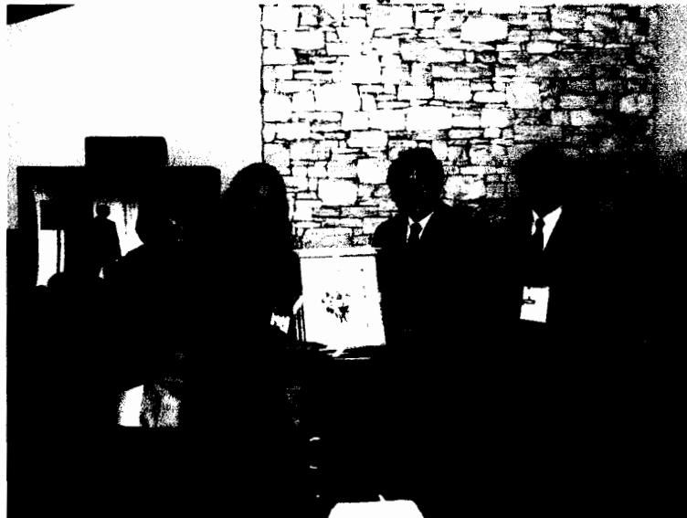
คณะผู้แทนรัฐสภาไทยมอบของที่ระลึกแก่นายชียยงค์ สัจจิตานนท์ เอกอัครราชทูต ณ กรุงโซล ภายหลังจากงานเลี้ยงอาหารกลางวัน ณ ทำเนียบเอกอัครราชทูต (วันอังคารที่ ๕ กรกฎาคม ๒๕๕๔)