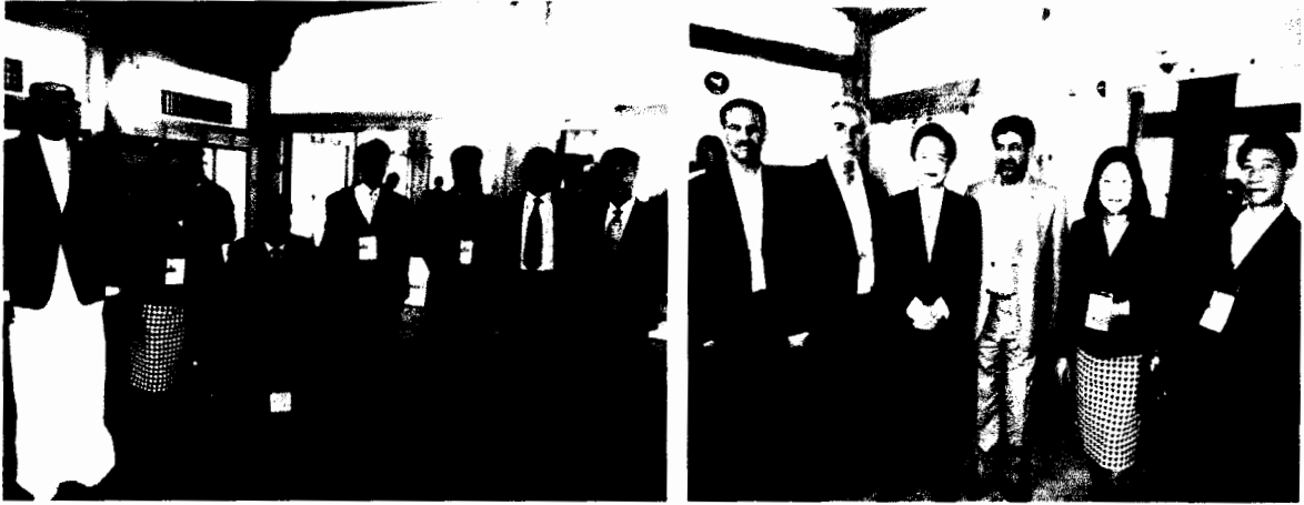
(ภาพซ้าย) คณะผู้แทนรัฐสภาไทย ถ่ายภาพร่วมกับผู้แทนจากรัฐบาห์เรนและสาธารณรัฐเกาหลี (ภาพขวา) คณะผู้แทนรัฐสภาไทย ถ่ายภาพร่วมกับผู้แทนจากสาธารณรัฐอิสลามอิหร่านและสาธารณรัฐเกาหลี