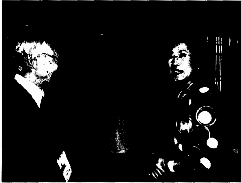
รองศาสตราจารย์ทัศนาศา บัญทอง สมาชิกวุฒิสภาและหัวหน้าคณะผู้แทนรัฐสภาไทย สนทนากับนาย Tetsuya Hirose เลขาธิการสหภาพสมาชิกรัฐสภาเอเชียและแปซิฟิก (APPU)