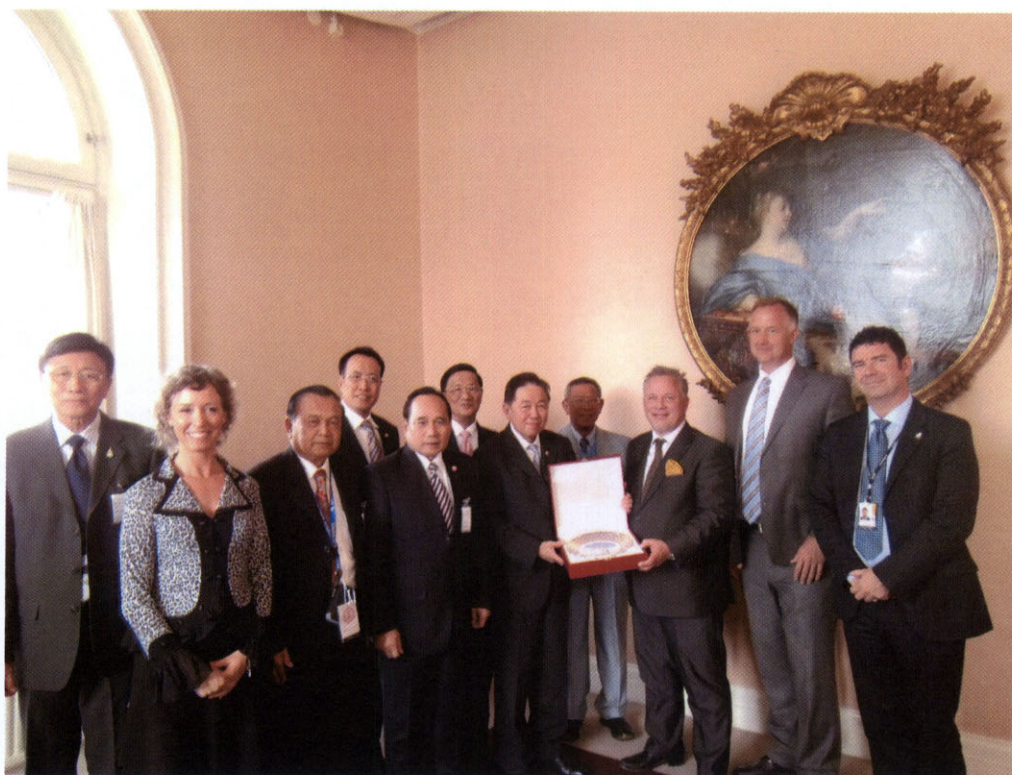
๔.๒ นายธนรัตน์ ธนพุทธิ เอกอัครราชทูต ณ กรุงสตอกโฮล์ม เป็นเจ้าภาพเลี้ยงรับรอง อาหารค่ำเพื่อเป็นเกียรติแก่คณะผู้แทนกลุ่มมิตรภาพฯ ไทย-สวีเดน ณ ทำเนียบเอกอัครราชทูต วันศุกร์ที่ ๘ มิถุนายน ๒๕๕๕ เวลา ๑๘.๐๐ นาฬิกา