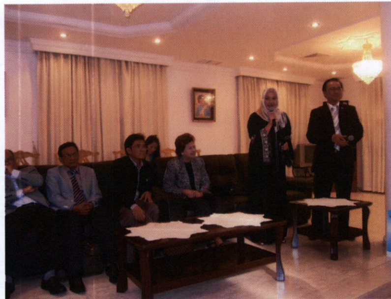
นางนาลยา เบ็ญจศิริวรรณ สมาชิกสภาผู้แทนราษฎรและประธานกลุ่มมิตรภาพสมาชิกรัฐสภาไทย-คูเวต และคณะ กล่าวทักทายนักเรียนและนักศึกษาไทยในคูเวต ณ สถานเอกอัครราชทูต ณ กรุงคูเวตซิตี