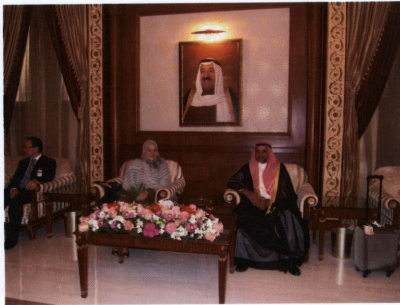
Hon. Mr. Taher Ali Al-Failakawi, Member of Kuwait National Assembly พร้อมด้วยนายสุรศักดิ์ เจือสุคนธ์ทิพย์ เอกอัครราชทูต ณ กรุงคูเวตซิตี และคณะ ให้การต้อนรับคณะผู้แทนกลุ่มมิตรภาพ สมาชิกรัฐสภาไทย-คูเวต ณ ห้องรับรอง สนามบินนานาชาติ รัฐคูเวต

คณะผู้แทนฯ ออกเดินทางจากประเทศไทย ในวันจันทร์ที่ ๒๒ เมษายน ๒๕๕๖ เวลา ๐๓.๐๐ นาฬิกา และเดินทางกลับถึงประเทศไทย ในวันศุกร์ที่ ๒๖ เมษายน ๒๕๕๖ เวลา ๑๐.๕๐ นาฬิกา