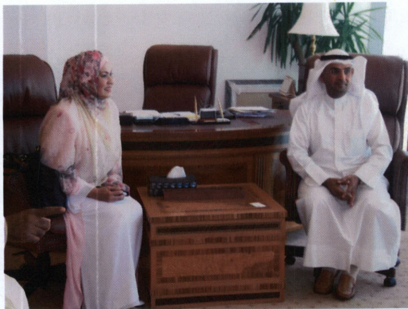
คณะผู้แทนฯ พบปะสนทนากับ H.E. Dr. Nayef Falah Al-Hajraf, Minister of Education and Minister of Higher Education ณ กระทรวงศึกษาธิการ รัฐคูเวต

๒.๑ การพบปะสนทนากับ H.E. Dr. Nayef Falah Al-Hajraf, Minister of Education and Minister of Higher Education ณ อาคารกระทรวงศึกษาธิการ รัฐคูเวต ในวันอังคารที่ ๒๓ เมษายน ๒๕๕๖ เวลา ๑๑.๐๐ นาฬิกา