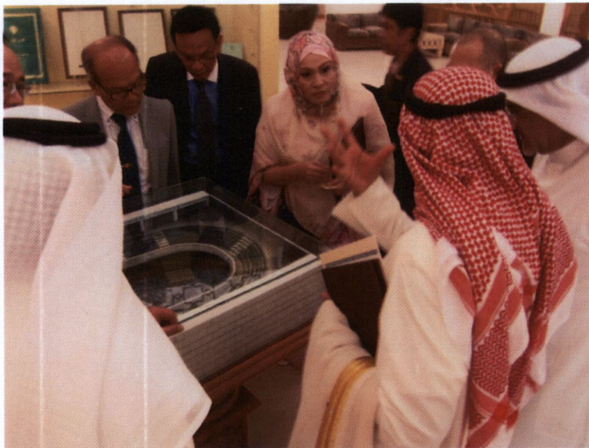
คณะผู้แทนกลุ่มมิตรภาพสมาชิกรัฐสภาไทย-คูเวต ชมแบบจำลองห้องประชุมรัฐสภาคูเวต