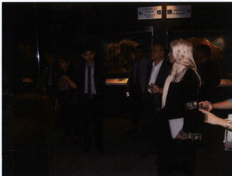
คณะผู้แทนกลุ่มมิตรภาพสมาชิกรัฐสภาไทย-คูเวต เยี่ยมชมศูนย์วิทยาศาสตร์คูเวต

เป็นสถานที่ท่องเที่ยวซึ่งเป็นแหล่งความรู้และบันเทิงอย่างครบวงจร ซึ่งมีทั้งส่วนที่เป็นพิพิธภัณฑ์ ตู้ปลาขนาดใหญ่ที่สุดในตะวันออกกลาง และมีพื้นที่แสดงสัตว์กว่า ๑๐๐ ชนิด พร้อมด้วยโรงภาพยนตร์ ๓ มิติ โดยทั้งหมดอยู่ในพื้นที่อาคารขนาดใหญ่กว่า ๑๘,๐๐๐ ตารางเมตร