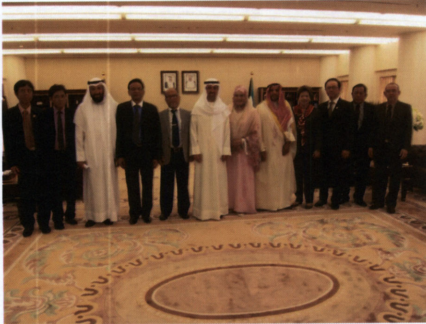
นางนารถยา เบ็ญจศิริวรรณ สมาชิกสภาผู้แทนราษฎรและประธานกลุ่มมิตรภาพสมาชิกรัฐสภาไทย-คูเวต และคณะถ่ายภาพร่วมกับ H.E. Mr. Ali Fahad Al-Rashed ประธานสภาแห่งชาติรัฐคูเวตและสมาชิกกลุ่มมิตรภาพสมาชิกรัฐสภาคูเวต-ไทย ณ อาคารรัฐสภารัฐคูเวต