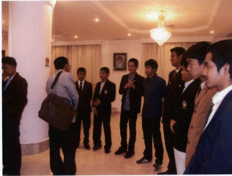
คณะผู้แทนกลุ่มมิตรภาพสมาชิกรัฐสภาไทย-คูเวต พบปะกับนักเรียนและนักศึกษาไทยในคูเวต ณ สถานเอกอัครราชทูต ณ กรุงคูเวตซิตี