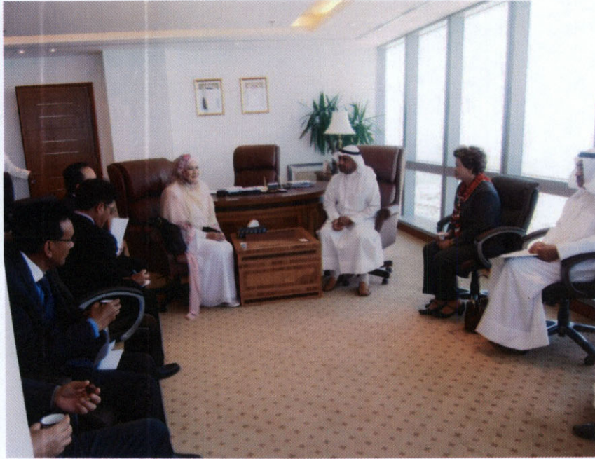
คณะผู้แทนฯ พบปะสนทนากับ H.E. Dr. Nayef Falah Al-Hajraf, Minister of Education and Minister of Higher Education ณ กระทรวงศึกษาธิการ รั้วคูเวต