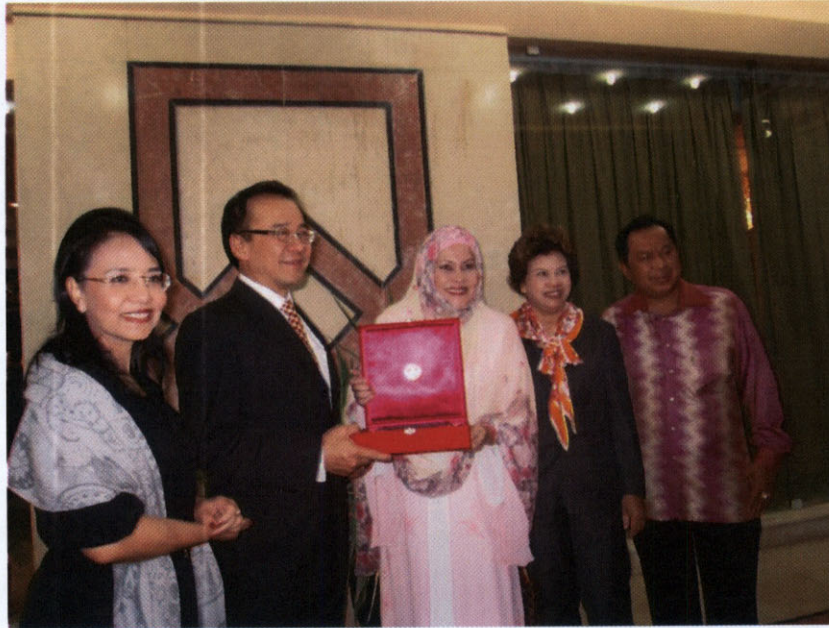
นางนารถยา เบ็ญจศิริวรรณ สมาชิกสภาผู้แทนราษฎรและประธานกลุ่มมิตรภาพสมาชิกรัฐสภาไทย-คูเวต มอบของที่ระลึกแก่นายสุรศักดิ์ เจือสุนธ์ทิพย์ เอกอัครราชทูต ณ กรุงคูเวตซิตี ณ ร้านอาหาร Oriental cuisine