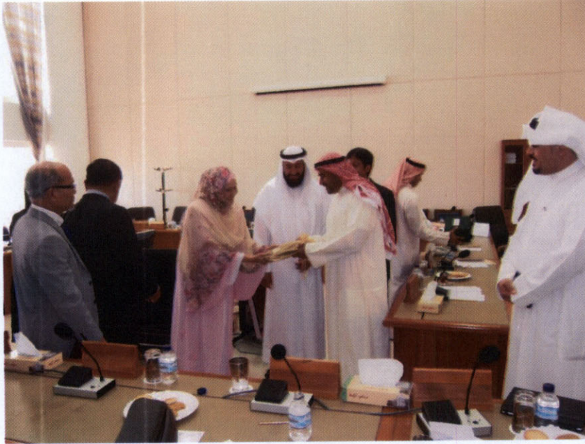
นางนายนยา เบ็ญจศิริวรรณ สมาชิกสภาผู้แทนราษฎรและประธานกลุ่มมิตรภาพสมาชิกรัฐสภาไทย-คูเวต มอบของที่ระลึกแก่สมาชิกกลุ่มมิตรภาพสมาชิกรัฐสภาคูเวต-ไทย ณ อาคารรัฐสภาารัฐคูเวต

๒.๔ พบปะสนทนากับประธานสมาคมวัฒนธรรมและสังคมสตรี Chairman and members of Women's Culture and Social Society ณ ห้องรับรองสมาคมวัฒนธรรมและสังคมสตรี ในวันอังคารที่ ๒๓ เมษายน ๒๕๕๖ เวลา ๑๘.๐๐ นาฬิกา