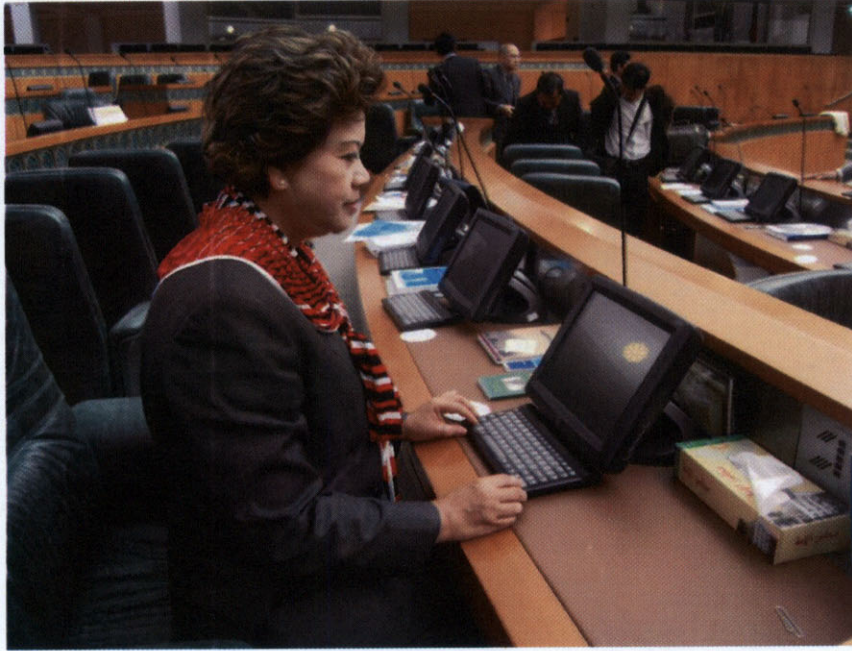
คณะผู้แทนกลุ่มมิตรภาพสมาชิกรัฐสภาไทย-คูเวต ชมระบบลงคะแนนเสียงของห้องประชุมรัฐสภาคูเวต