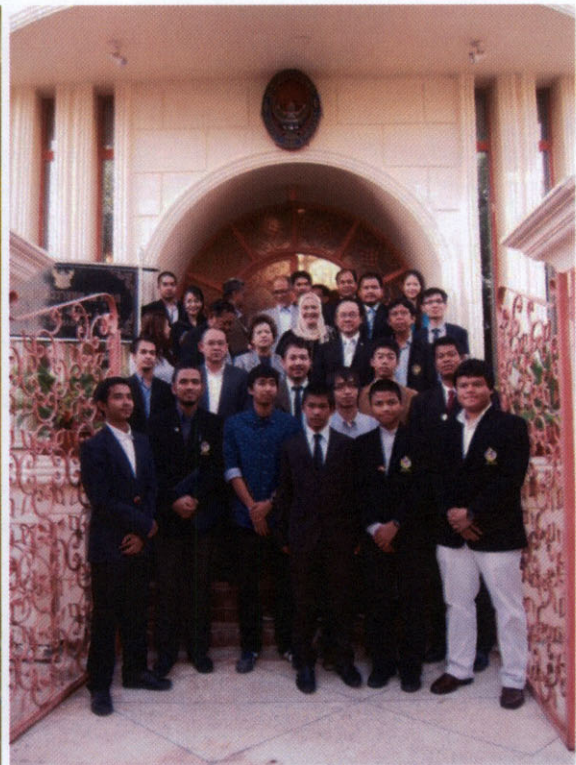
นางนาลยา เบ็ญจศิริวรรณ สมาชิกสภาผู้แทนราษฎรและประธานกลุ่มมิตรภาพสมาชิกรัฐสภาไทย-คูเวต และคณะ ถ่ายภาพร่วมกับ นายสุรศักดิ์ เจือสุคนธ์ทิพย์ เอกอัครราชทูต ณ กรุงคูเวตซิตี และคณะ และนักเรียนและนักศึกษาไทยในคูเวต ณ สถานเอกอัครราชทูต ณ กรุงคูเวตซิตี