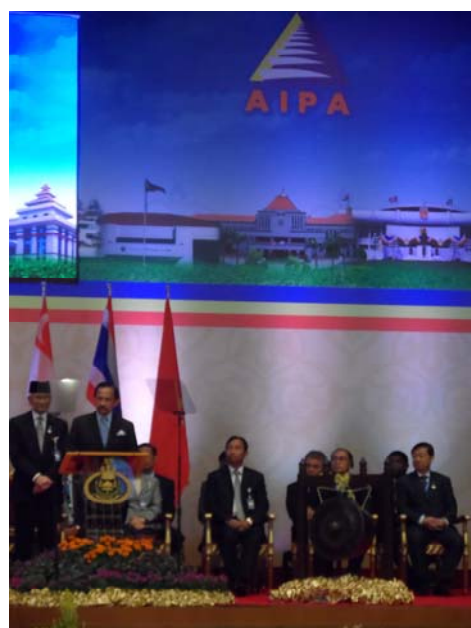
สุลต่านแห่งบรูไนเสด็จฯ เปิดการประชุมใหญ่สมาชิกสภาอาเซียน ครั้งที่ ๓๔