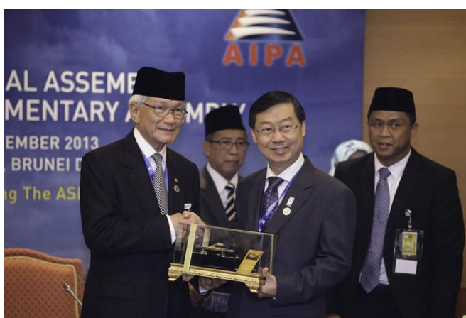
รองประธานวุฒิสภา คนที่หนึ่ง รับมอบของที่ระลึกจากประธานสถานิติบัญญัติบรูไนดารุสซาลาม