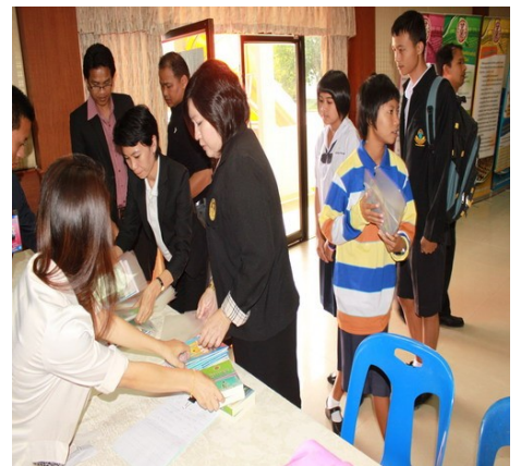
เจ้าหน้าที่จากสำนักประชาสัมพันธ์ร่วม ลงทะเบียนและแจกเอกสาร ร่วมกับ เจ้าหน้าที่สำนักงานรัฐสภาขอนแก่น