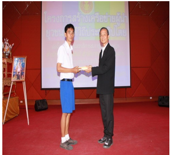
ประธานคณะกรรมการพัฒนาเครือข่ายฯ ในฐานะประธานเปิดโครงการสัมมนา มอบของที่ระลึก แก่ รองผอ.โรงเรียนขามแก่นนคร เจ้าของสถานที่ และยุวชนฯ ผู้เสนอโครงการ