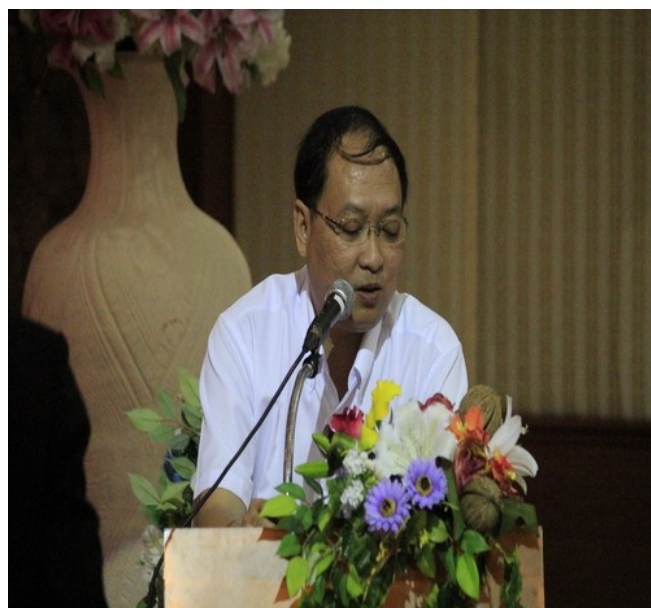
นายจักรพันธ์ จันทรเจริญ หัวหน้าสำนักงาน รัฐสภาขอนแก่น บรรยายเรื่อง “บทบาท อำนาจ หน้าที่ของรัฐสภา และสำนักงานรัฐสภาขอนแก่น