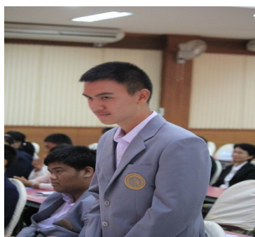
เยาวชนมีส่วนร่วมและแลกเปลี่ยนความคิดเห็น ในกิจกรรมเสวนา