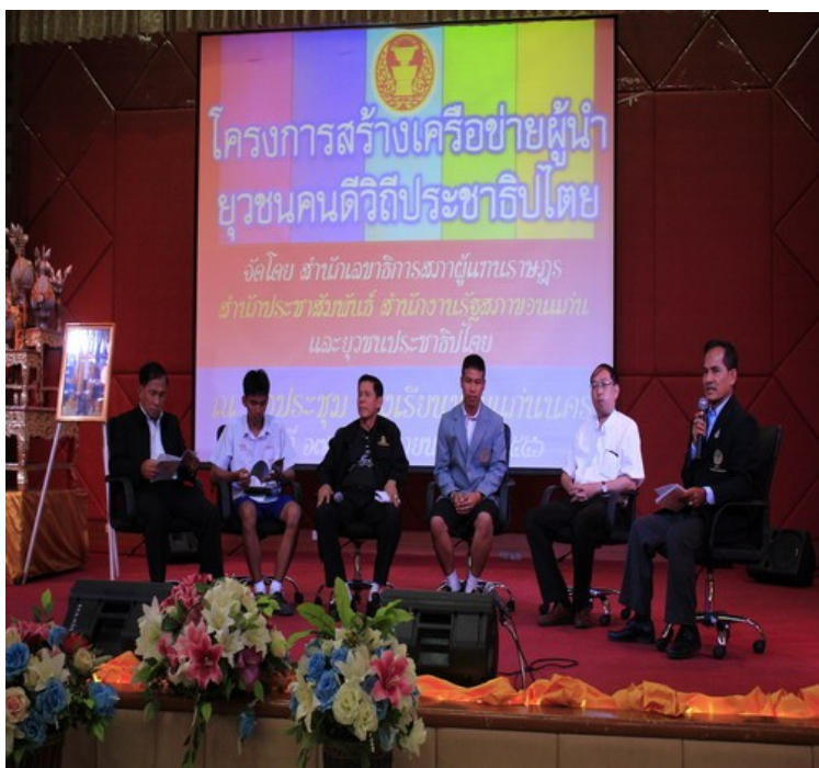
กิจกรรมเสวนาเรื่อง “การสร้างเครือข่ายประชาธิปไตย...ทำให้ดี...ทำอย่างไร”