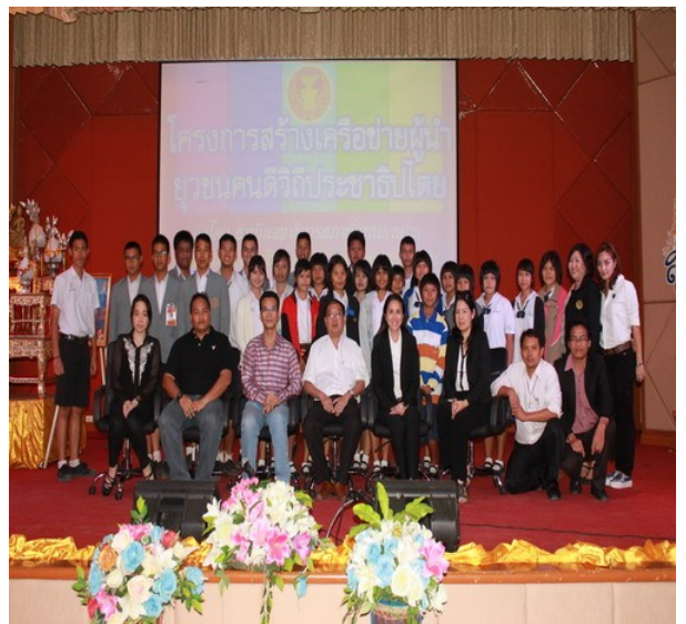
ส่วนหนึ่งของกลุ่มเป้าหมายร่วมถ่ายรูปเป็นที่ระลึก