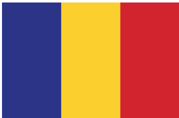
ธงชาติของโรมาเนีย

พื้นที่ ๒๓๘,๓๙๑ ตารางกิโลเมตร ที่ตั้ง ทิศตะวันออกเฉียงใต้ของยุโรป อยู่เหนือคาบสมุทรบอลข่าน ด้านเหนือและตะวันออก ติดกับมอลโดวาและยูเครน ด้านตะวันตกเฉียงเหนือ ติดกับฮังการี ด้านใต้ ติดกับบัลแกเรีย ด้านตะวันตกเฉียงใต้ ติดกับเซอร์เบีย ด้านตะวันออกเฉียงใต้ ติดกับทะเลดำ