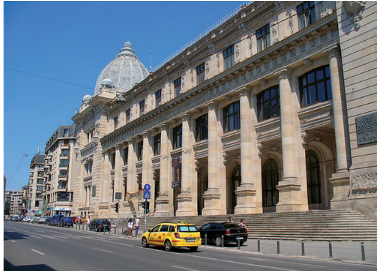
กรุงบูคาเรสต์ (Bucharest)