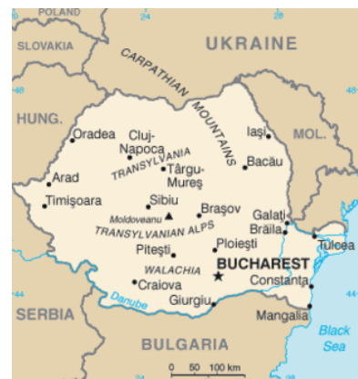
แผนที่ของโรมาเนีย