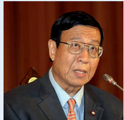
ศาสตราจารย์พิเศษพรเพชร วิชิตชลชัย

ศาสตราจารย์พิเศษพรเพชร ยังกล่าวเพิ่มเติมอีกว่า คำว่าลอบบีหมายความว่าการชักจูง แต่ที่เกิดขึ้นขณะนี้คือ ให้พิจารณาประวัติบุคคล โดยส่งทางไปรษณีย์ หรือฝากเพื่อน ๆ มาเป็นกระดาศที่มีรายละเอียดของประวัติแนะนำตัวให้พิจารณา คาดว่าต้องการให้กรรมการทราบประวัติและมีเพียงไม่กี่คนที่ทำแบบนี้ เป็นธรรมเนียมปฏิบัติของคนไทยอยู่แล้ว แต่ยืนยันว่าจะไม่มีผลต่อการสรรหาบุคคลเป็นสมาชิกสภาปฏิรูปแห่งชาติ