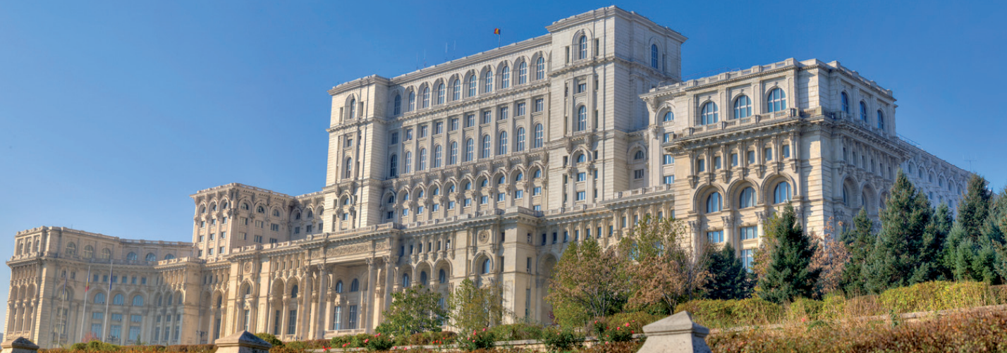
รัฐสภาโรมาเนีย

การเลือกตั้งทั่วไปเป็นระบบแบ่งเขต (union minal voting) แทนระบบเดิมที่เป็นการเลือกพรรคในแบบบัญชีรายชื่อสัดส่วน พรรคการเมืองที่สำคัญ ได้แก่ พรรค Democratic-Liberal Party (PD-L) พรรค Social Democratic Party (PSD) พรรค Hungarian Union of Democrats in Romania (HUDR) พรรค Conservative Party (PC) พรรค National Liberal Party (PNL) และพรรค Magyar Democratic Union of Romania