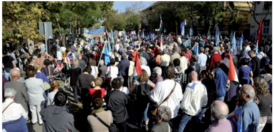
ประชาชนโรมาเนีย