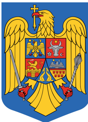
ตราประจำชาติของโรมาเนีย