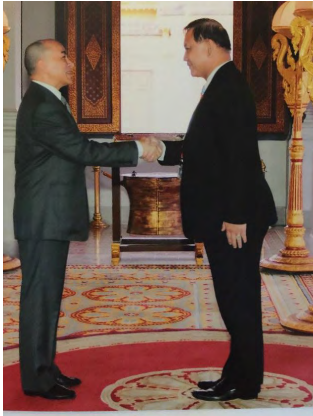
พลเรือเอก อมรเทพ ณ บางช้าง สมาชิกสภานิติบัญญัติแห่งชาติ และหัวหน้าคณะผู้แทนฯ เข้าเฝ้าฯ พระบาทสมเด็จพระบรมนาถนโรดมสีหมุนี กษัตริย์แห่งราชอาณาจักรกัมพูชา