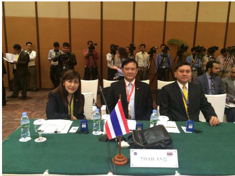
คณะผู้แทนสภานิติบัญญัติแห่งชาติเข้าร่วมการประชุมคณะมนตรีบริหาร ครั้งที่ ๒