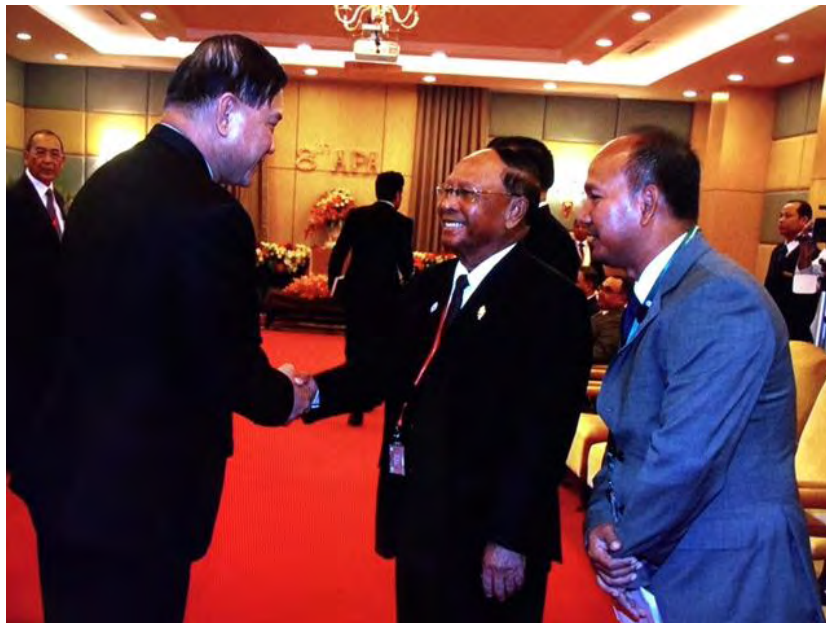
พลเรือเอก อมรเทพ ณ บางช้าง สมาชิกสภานิติบัญญัติแห่งชาติ และหัวหน้าคณะผู้แทนฯ เข้าเยี่ยมคารวะ สมเด็จพระอัครมหาพญาจักรีเฮง สัมริน ประธานสภาแห่งชาติกัมพูชาและประธาน APA คนปัจจุบัน ก่อนพิธีเปิดการประชุมสมัชชาใหญ่สมัชชารัฐสภาเอเชีย (APA) ครั้งที่ ๘