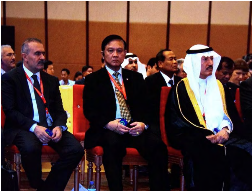
พลเรือเอก อมรเทพ ณ บางช้าง หัวหน้าคณะผู้แทนสถานิติบัญญัติแห่งชาติ เข้าร่วมพิธีเปิดการประชุม APA ครั้งที่ ๘

ในการประชุมคณะกรรมการบริหารครั้งที่ ๑ ซึ่งมีการเสนอประเด็นเกี่ยวกับการลดองค์ประชุมในการประชุม สมัชชาใหญ่และการประชุมคณะกรรมการบริหารลงนั้น ที่ประชุมได้มีมติอย่างเป็นทางการเป็นเอกฉันท์ว่าไม่เห็นด้วยกับการลด จำนวนองค์ประชุมลง โดยผู้เข้าร่วมประชุมเน้นย้ำถึงความสำคัญในการเข้าร่วมการประชุมอย่างน้อยก็หนึ่งและ สมาชิก APA อีก ๑ คนตามที่เคยระบุไว้ โดยสรุปว่าจะมีการพิจารณาตามที่ร้องขอต่อไปในอนาคต