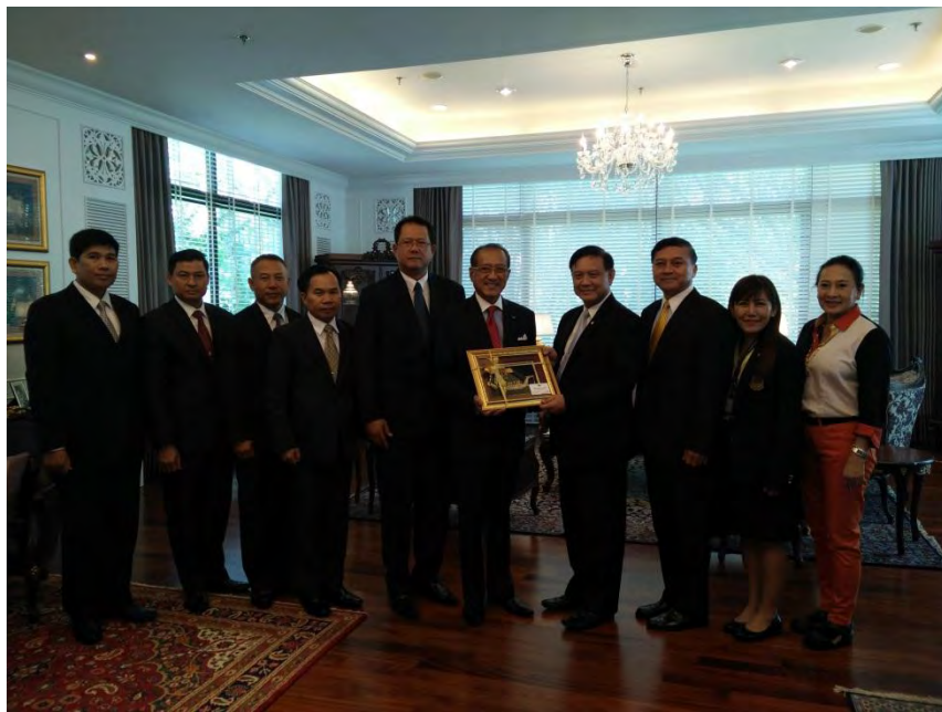
คณะผู้แทนสถานติบัญญัติแห่งชาติ มอบของที่ระลึกให้กับ นายณัฐรัฐฉวี โพธิสารโร เอกอัครราชทูต ณ กรุงเทพมหานคร ในโอกาสที่เอกอัครราชทูตเลี้ยงอาหารกลางวันแก่คณะ