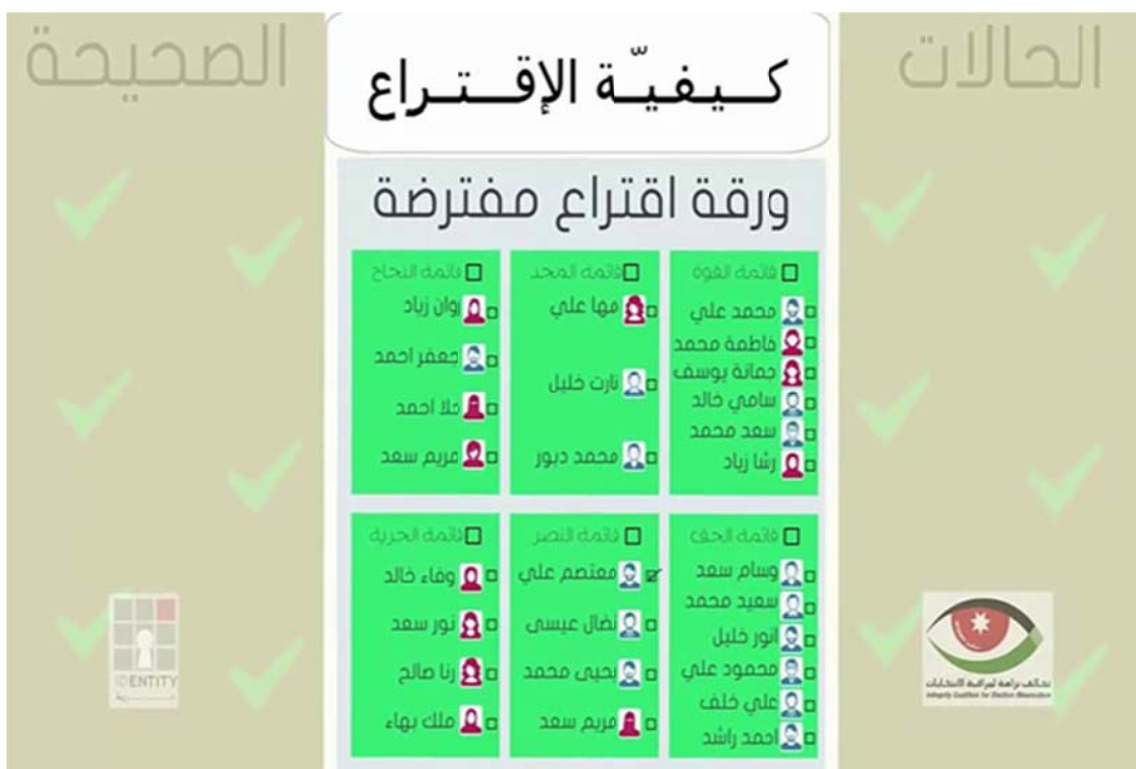
ตัวอย่างบัตรเลือกตั้งแบบใหม่

ผู้มีสิทธิเลือกตั้งลงทะเบียนที่หน่วยเลือกตั้งและรับบัตรเลือกตั้ง และให้ทำเครื่องหมายเลือกชื่อกลุ่มการเมืองที่สมัครรับเลือกตั้งได้เพียงกลุ่มบัญชีเดียวเท่านั้น หลังจากนั้นให้เลือกทำเครื่องหมายเลือกผู้สมัครในกลุ่มบัญชีรายชื่อที่ตนเลือกไว้ก่อนหน้า โดยมีสิทธิออกเสียงและทำเครื่องหมายเลือกผู้สมัครที่มีรายชื่อปรากฏอยู่ในบัญชีที่เลือกไว้เท่านั้น จะเลือกผู้สมัครที่ปรากฏในบัญชีทั้งหมดหรือเลือกเฉพาะบางคนย่อมกระทำได้ แต่ไม่อนุญาตให้เลือกผู้สมัครในบัญชีอื่น ๆ เพราะจะทำให้กลายเป็นบัตรเสียทันที ดังนั้นผู้มีสิทธิออกเสียงเลือกตั้งต้องเลือกกลุ่มบัญชีรายชื่อก่อนเป็นลำดับแรก จากนั้นจึงการพิจารณาเลือกผู้สมัครรับเลือกตั้งเฉพาะในกลุ่มบัญชีที่ตนเลือกไว้