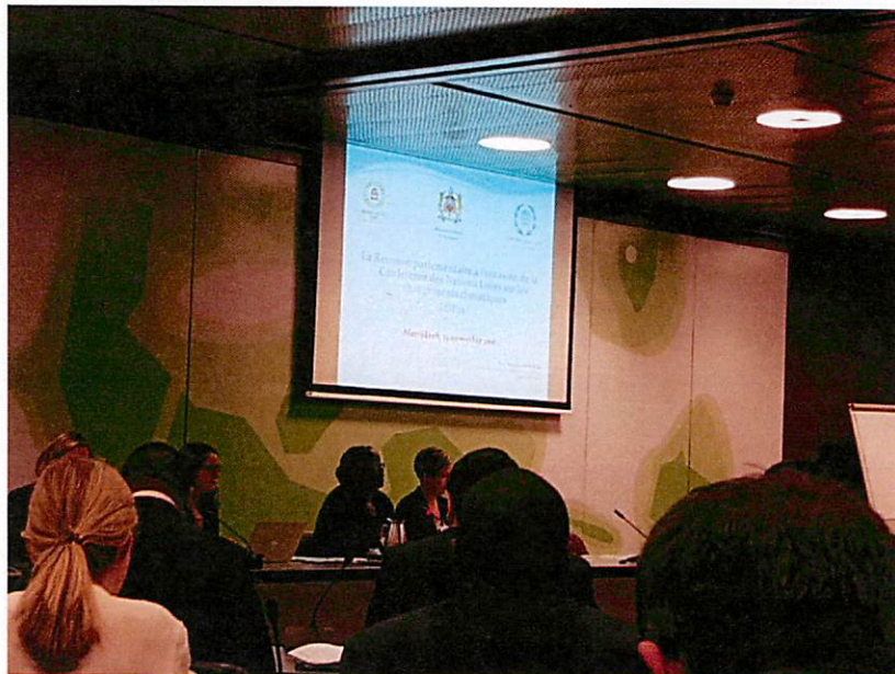
นาง Doris K. Mwingka ประธานสมาคมเลขาธิการรัฐสภา (ASGP) ระหว่างการกล่าวเปิดการประชุมสมาคมเลขาธิการรัฐสภา ประจำปี ๒๕๕๙ อย่างเป็นทางการ

การประชุมสมาคมเลขาธิการรัฐสภา (ASGP) ประจำปี ๒๕๕๙ ในช่วงเช้าเป็นพิธีเปิดการประชุมอย่างเป็นทางการ ณ ห้องประชุมหมายเลข ๓ และ ๔ ชั้น ๓ ศูนย์การประชุมนานาชาตินครเจนีวา โดยนาง Doris K. Mwingka เลขาธิการรัฐสภาแอฟริกาและประธานสมาคมเลขาธิการรัฐสภา เป็นผู้กล่าวต้อนรับและขอบคุณรัฐสภาประเทศสมาชิกที่เดินทางเข้าร่วมการประชุมสมาคมเลขาธิการรัฐสภาในครั้งนี้ รวมถึง กล่าวแนะนำสมาชิกใหม่ของสมาคมฯ ตามลำดับการสมัครล่าสุด พร้อมนี้คาดหวังว่า การประชุมสมาคมเลขาธิการรัฐสภาในครั้งนี้ จะนำมาซึ่งประโยชน์ต่อผู้เข้าร่วมการประชุม ที่อยู่ฐานะผู้บริหารสำนักงานและปฏิบัติงานจริง