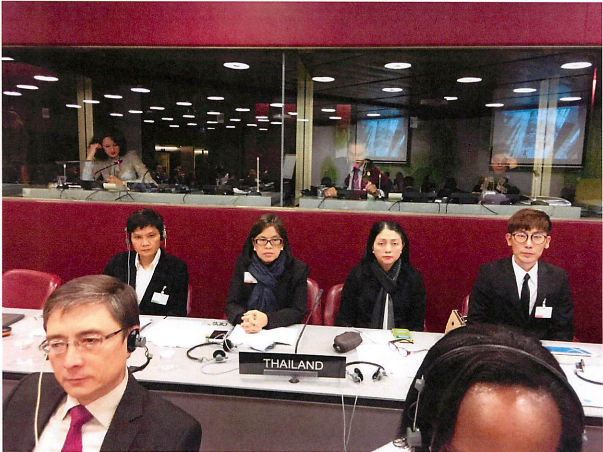
คณะผู้แทนไทยระหว่างการเข้าร่วมการประชุม ASGP ประจำปี ๒๕๕๙