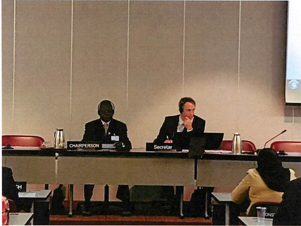
การประชุมร่วมระหว่าง IPU และ ASGP