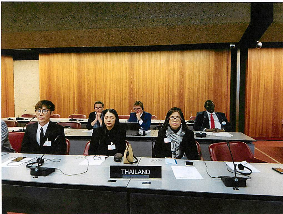
คณะผู้แทนไทยเข้าร่วมการประชุมร่วมระหว่าง IPU และ ASGP

บทวิเคราะห์และข้อเสนอแนะเกี่ยวกับการประชุมสมาคมเลขาธิการรัฐสภา ประจำปี ๒๕๕๙