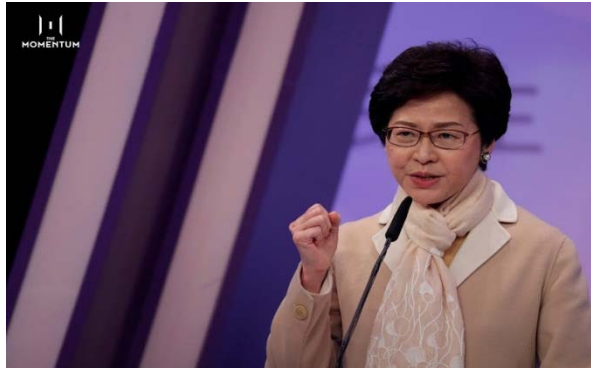
นาง Carrie Lam ผู้บริหารสูงสุดฮ่องกง (เข้ารับตำแหน่งวันที่ 1 กรกฎาคม 2560)