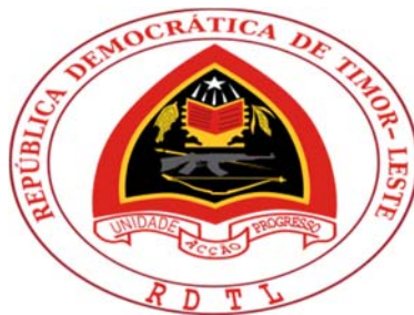
ธงชาติและตราแผ่นดินของประเทศติมอร์-เลสเต (Timor-Leste)

ภาพที่ 2