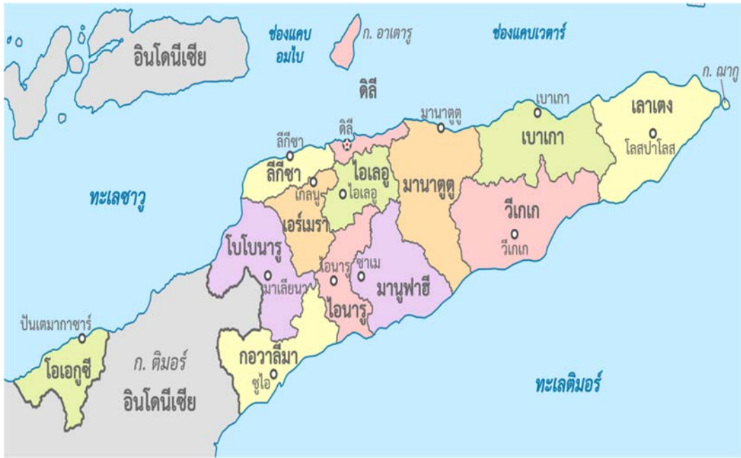
แผนที่ของประเทศติมอร์-เลสเต (Timor-Leste)

ภาพที่ 3