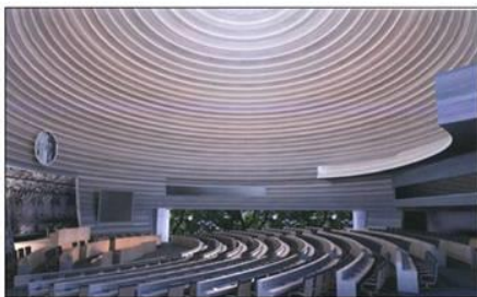
ภาพถ่ายความก้าวหน้าในส่วนห้องประชุม สว. รอบที่รายงาน

บริษัท ชีโน-ไทย เอ็นจิเนียริง แอนด์ คอนสตรัคชั่น จำกัด (มหาชน)