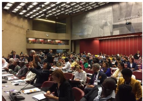
บรรยากาศการประชุมสหภาพรัฐสภาสตรี ครั้งที่ ๒๘