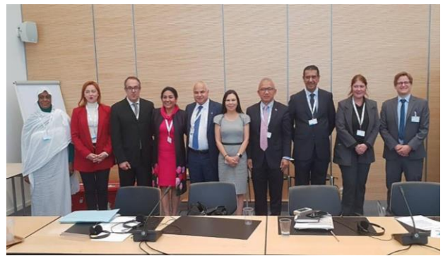
บรรยากาศระหว่างการประชุมกรรมการในคณะกรรมการสามัญสหภาพรัฐสภา ว่าด้วยสันติภาพและความมั่นคงระหว่างประเทศ