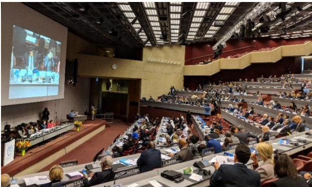
บรรยากาศในห้องประชุม คณะมนตรีบริหารสหภาพรัฐสภา