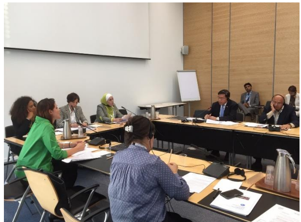
บรรยากาศการประชุมกรรมการในคณะกรรมการ สามัญสหภาพรัฐสภาว่าด้วยการพัฒนาที่ยั่งยืน การค้าและการค้า