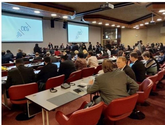
บรรยากาศระหว่างการประชุมกลุ่มอาเซียน+๓ และ กลุ่มภูมิรัฐศาสตร์เอเชีย-แปซิฟิก