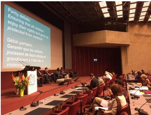
บรรยากาศการอภิปรายที่ทุกฝ่ายมีส่วนร่วม

มาตรการและเครื่องมือทางกฎหมายต่าง ๆ ที่กล่าวมาแสดงให้เห็นว่าประเทศไทยได้ให้ความสนใจอย่างต่อเนื่องเรื่อยมาต่อความปลอดภัยและความมั่นคงของเด็กที่ขยายไปสู่สิ่งแวดล้อมที่อยู่รอบตัวเด็กเพื่อให้เกิดความมั่นใจว่าเขาจะเติบโตและมีพัฒนาการโดยไม่ได้รับอันตรายทั้งทางร่างกายและจิตใจ และขอขอบคุณสหภาพรัฐสภาที่ได้จัดการอภิปรายที่ทุกฝ่ายมีส่วนร่วมในประเด็นนี้เพราะเด็กในวันนี้คือผู้ใหญ่ในวันหน้า จึงเป็นหน้าที่ของเราทุกคนที่ต้องปกป้องพวกเขา”