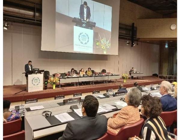
ศาสตราจารย์พิเศษพรเพชร วิชิตชลชัย ประธานสภานิติบัญญัติแห่งชาติ ขณะกล่าวถ้อยแถลง ในนามคณะผู้แทนสภานิติบัญญัติแห่งชาติ