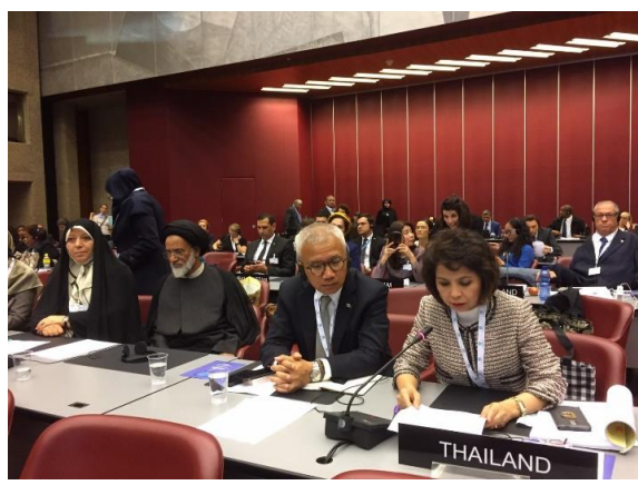
บรรยากาศการประชุมสหภาพรัฐสภาสตรี ครั้งที่ ๒๘