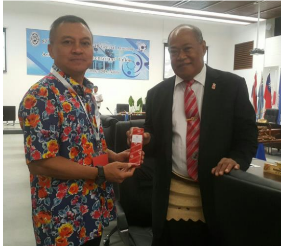
พลเอก นิพัทธ์ ทองเล็ก หัวหน้าคณะผู้แทนสภานิติบัญญัติแห่งชาติ มอบของที่ระลึกแก่นาย Samiu Vaipulu สมาชิกสภานิติบัญญัติ ราชอาณาจักรตองกา ในพิธีปิดการประชุม เมื่อวันที่ ๒๕ กันยายน ๒๕๖๑ ณ ห้องประชุม Eigigu Civic Centre