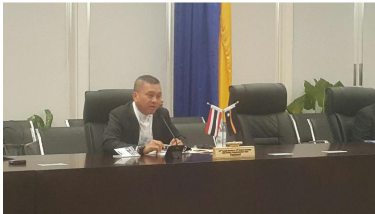
พลเอก นิพัทธ์ ทองเล็ก หัวหน้าคณะผู้แทนสถานิติบัญญัติแห่งชาติ ขณะกล่าวอภิปรายในการประชุมคณะมนตรีสหภาพสมาชิกรัฐสภาเอเชียและแปซิฟิก ครั้งที่ ๘๒ ณ ห้องประชุม Eigu Civic Centre

๑. การประชุมคณะมนตรีสหภาพสมาชิกรัฐสภาเอเชียและแปซิฟิก ครั้งที่ ๘๒ เมื่อวันที่ ๒๓ กันยายน ๒๕๖๑ เวลา ๑๗.๐๐ นาฬิกา พลเอก นิพัทธ์ ทองเล็ก หัวหน้าคณะผู้แทนสถานิติบัญญัติแห่งชาติ ได้กล่าวอภิปรายสนับสนุนร่างข้อมติของประเทศสมาชิกในหลายประเด็น โดยคำนึงถึงผลประโยชน์ของประเทศไทยเป็นหลัก และเพื่อแลกเปลี่ยนเสียงสนับสนุนให้แก่ร่างข้อมติว่าด้วยการเรียกร้องให้ประเทศสมาชิกสหภาพสมาชิกรัฐสภาเอเชียและแปซิฟิกส่งเสริมการท่องเที่ยวชุมชนเพื่อเศรษฐกิจที่ยั่งยืน ซึ่งไทยเป็นผู้เสนอ