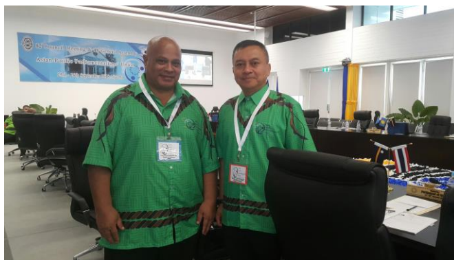
พลเอก นิพัทธ์ ทองเล็ก หัวหน้าคณะผู้แทนสถานิติบัญญัติแห่งชาติ ถ่ายภาพร่วมกับนาย Cyril Buraman ประธานรัฐสภา สาธารณรัฐนาอูรู ณ ห้องประชุม Eigsaw Civic Centre