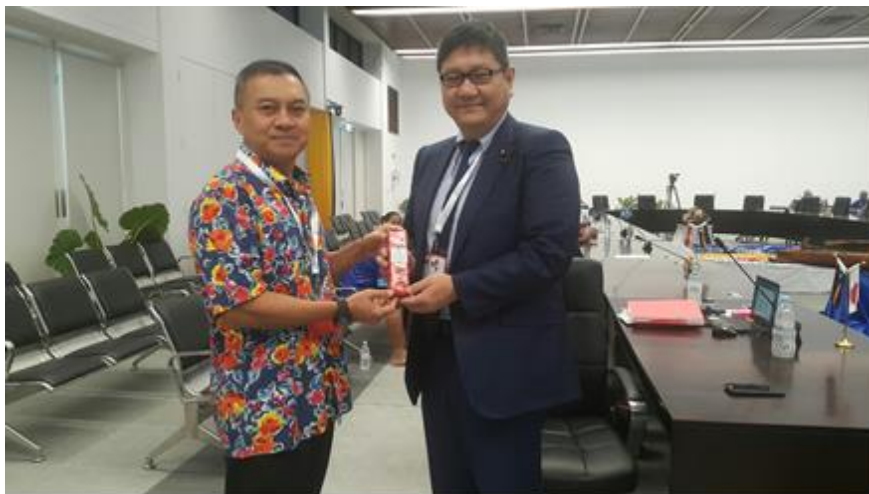
พลเอก นิพัทธ์ ทองเล็ก หัวหน้าคณะผู้แทนสภานิติบัญญัติแห่งชาติ มอบของที่ระลึกแก่นาย Yoichi Anami สมาชิกรัฐสภา ประเทศญี่ปุ่น ในพิธีปิดการประชุม เมื่อวันที่ ๒๕ กันยายน ๒๕๖๑ ณ ห้องประชุม Eigigu Civic Centre