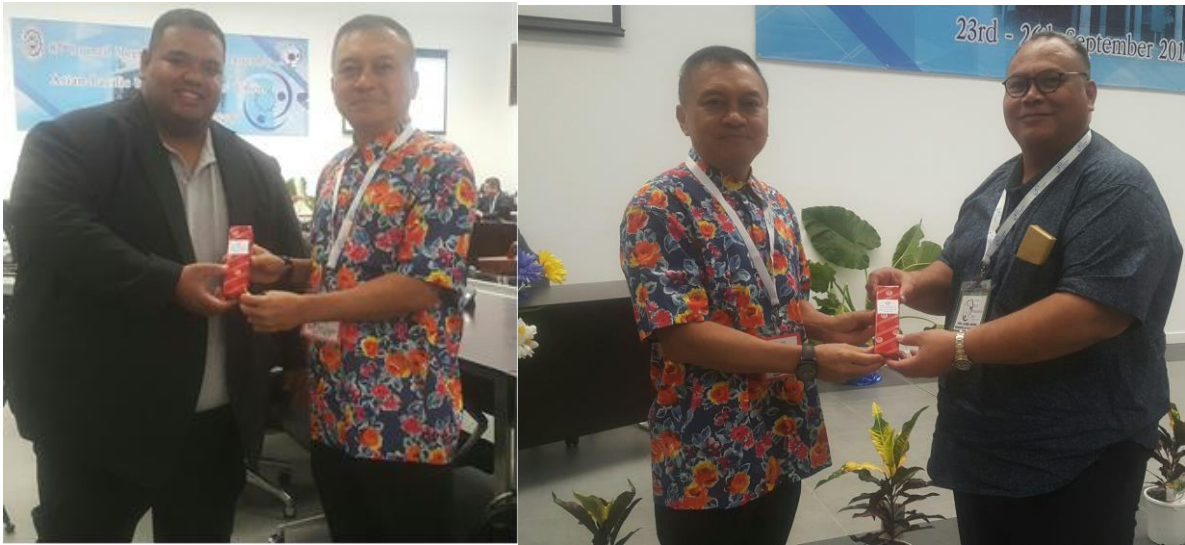
พลเอก นิพัทธ์ ทองเล็ก หัวหน้าคณะผู้แทนสภานิติบัญญัติแห่งชาติ มอบของที่ระลึกแก่นาย Asterio Appi รองประธานรัฐสภา สาธารณรัฐนาอูรู (ชาย) และนาย Lionel Aingimea สมาชิกรัฐสภา สาธารณรัฐนาอูรู (ชาย) ในพิธีปิดการประชุม เมื่อวันที่ ๒๕ กันยายน ๒๕๖๑ ณ ห้องประชุม Eigigu Civic Centre