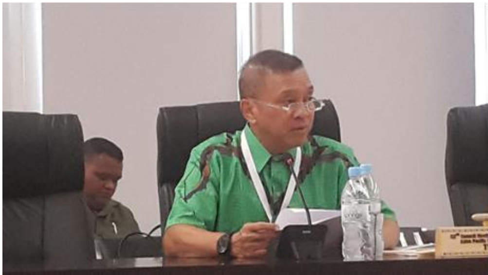
พลเอก นิพัทธ์ ทองเล็ก หัวหน้าคณะผู้แทนสภานิติบัญญัติแห่งชาติ ขณะกล่าวรายงานประเทศในการประชุมสมัชชาใหญ่สหภาพสมาชิกรัฐสภาเอเชียและแปซิฟิก ครั้งที่ ๔๘ ณ ห้องประชุม Eigigu Civic Centre

๒. การประชุมสมัชชาใหญ่สหภาพสมาชิกรัฐสภาเอเชียและแปซิฟิก ครั้งที่ ๔๘ เมื่อวันที่ ๒๔ กันยายน ๒๕๖๑ เวลา ๑๓.๓๐ นาฬิกา พลเอก นิพัทธ์ ทองเล็ก หัวหน้าคณะผู้แทนสภานิติบัญญัติแห่งชาติ ได้กล่าวรายงานต่อที่ประชุมว่า เศรษฐกิจของประเทศไทยยังคงเติบโตอย่างต่อเนื่องด้วยพระมหากรุณาธิคุณของพระบาทสมเด็จพระปรมินทรมหาภูมิพลอดุลยเดช รัชกาลที่ ๙ ที่ได้พระราชทานปรัชญาเศรษฐกิจพอเพียง ซึ่งเป็นที่ประจักษ์และได้รับการยอมรับทั่วโลก นอกจากนี้ ประเทศไทยยังส่งเสริมด้านการศึกษาโดยเน้นการเรียนรู้ตลอดชีวิต รวมถึงการเพิ่มทักษะแรงงานในภาคอุตสาหกรรมเพื่อเตรียมพร้อมในการเป็นส่วนหนึ่งของประชาคมอาเซียน สำหรับประเด็นที่เกี่ยวข้องกับหัวข้อการประชุมด้านการเปลี่ยนแปลงสภาพภูมิอากาศและพลังงานหมุนเวียน ประเทศไทยได้มีแผนงานระยะยาวโดยมีเป้าหมายเพื่อการพัฒนาที่ยั่งยืน ในช่วงท้ายของการกล่าวรายงาน พลเอก นิพัทธ์ ทองเล็ก หัวหน้าคณะผู้แทนสภานิติบัญญัติแห่งชาติ ได้เน้นย้ำการส่งเสริมความร่วมมือระหว่างกันภายใต้กรอบสหภาพสมาชิกรัฐสภาเอเชียและแปซิฟิก เพื่อบรรลุเป้าหมายร่วมกัน และในฐานะสมาชิกรัฐสภาสภานิติบัญญัติแห่งชาติ มีหน้าที่ผลักดันกฎหมายและงบประมาณเพื่อสนับสนุนผลประโยชน์ระหว่างกันในทุกมิติ