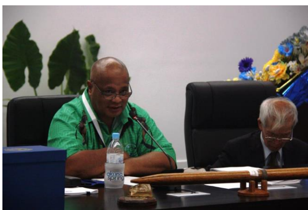
นาย Cyril Buraman ประธานรัฐสภา สาธารณรัฐนาอูรู ขณะกล่าวเปิดการประชุมสมัชชาใหญ่สหภาพสมาชิกรัฐสภาเอเชียและแปซิฟิก ครั้งที่ ๔๘ เมื่อวันที่ ๒๔ กันยายน ๒๕๖๑ ณ ห้องประชุม Eigigu Civic Centre

นาย Yoichi Anami สมาชิกวุฒิสภา ประเทศญี่ปุ่น เป็นผู้กล่าวเปิดการประชุมในนามของนาย Shunichi Yamaguchi รองประธานหน่วยประจำชาติญี่ปุ่นและประธานการประชุมสมัชชาใหญ่สหภาพสมาชิกรัฐสภาเอเชียและแปซิฟิก ครั้งที่ ๔๗ และทำหน้าที่ประธานชั่วคราว เพื่อดำเนินการเลือกตั้งประธานการประชุมสมัชชาใหญ่สหภาพสมาชิกรัฐสภาเอเชียและแปซิฟิก ครั้งที่ ๔๘ ซึ่งที่ประชุมได้มีมติให้นาย Cyril Buraman ประธานรัฐสภา สาธารณรัฐนาอูรู เป็นประธานการประชุมสมัชชาใหญ่สหภาพสมาชิกรัฐสภาเอเชียและแปซิฟิก ครั้งที่ ๔๘ ในโอกาสนี้ นาย Cyril Buraman ประธานรัฐสภา สาธารณรัฐนาอูรู ได้กล่าวเปิดการประชุม โดยเน้นย้ำถึงหัวข้อการประชุมครั้งนี้ว่าด้วยการเสริมสร้างความร่วมมือของผู้มีส่วนได้เสียและการรับมือกับการเปลี่ยนแปลงสภาพภูมิอากาศในภูมิภาคเอเชียแปซิฟิก : การป้องกัน การบรรเทาภัยพิบัติ พลังงานหมุนเวียน สันติภาพ และความรุ่งเรือง ซึ่งเป็นการเปิดโอกาสให้ประเทศสมาชิกได้ร่วมกันหารือในประเด็นต่าง ๆ และผลกระทบจากการเปลี่ยนแปลงสภาพภูมิอากาศ รวมถึงพลังงานหมุนเวียนในอนาคตภายในภูมิภาคเอเชียแปซิฟิก ทั้งนี้ การที่หุ้นส่วนความร่วมมือในเอเชียของสหภาพฯ ประสบภัยจากพายุไต้ฝุ่น ขณะเดียวกัน ประเทศในแปซิฟิก ประสบปัญหาพายุไซโคลนและยังคงเผชิญสภาพอากาศที่เลวร้ายตลอดปี แสดงให้เห็นว่า การเปลี่ยนแปลงสภาพภูมิอากาศเป็นภัยคุกคามต่อโลกและมนุษยชาติ จึงขอให้ประเทศสมาชิกระดมทรัพยากรโดยมีจุดมุ่งหมายร่วมกัน และสนับสนุนให้เกิดการแก้ไขปัญหาและดำเนินการต่าง ๆ อย่างสร้างสรรค์ ทั้งนี้ สันติภาพและความเจริญรุ่งเรืองในภูมิภาคจะเกิดขึ้นได้ หากประเทศสมาชิกให้ความร่วมมือและทุ่มเทความพยายามเพื่อแสวงหาวิธีการแก้ไขปัญหาและแนวทางรับมือกับการเปลี่ยนแปลงสภาพภูมิอากาศ