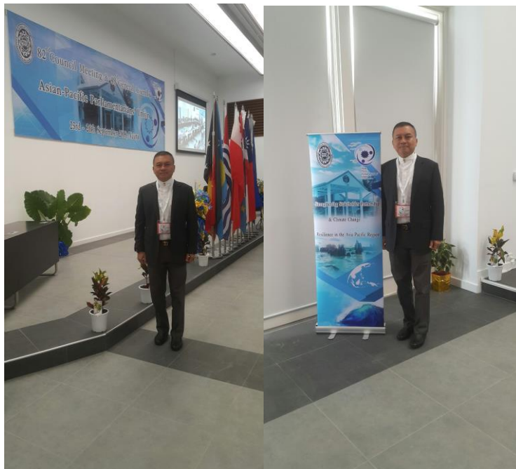
พลเอก นิพัทธ์ ทองเล็ก หัวหน้าคณะผู้แทนสภานิติบัญญัติแห่งชาติ เข้าร่วมการประชุมคณะมนตรีสหภาพสมาชิกรัฐสภาเอเชียและแปซิฟิก ครั้งที่ ๘๒ เมื่อวันที่ ๒๓ กันยายน ๒๕๖๑ ณ ห้องประชุม Eigigu Civic Centre

- เลขานุการคณะผู้แทนสภานิติบัญญัติแห่งชาติ