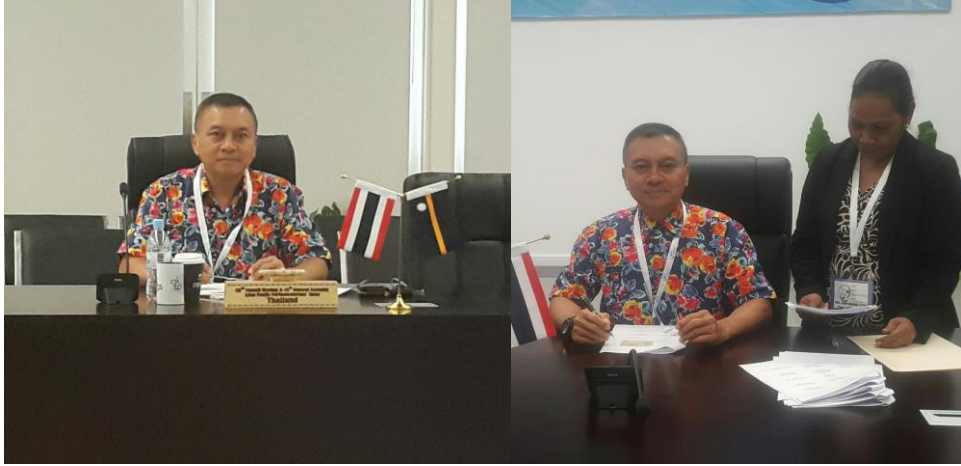
พลเอก นิพัทธ์ ทองเล็ก หัวหน้าคณะผู้แทนสถานิติบัญญัติแห่งชาติ เข้าร่วมในพิธีปิดการประชุม ณ ห้องประชุม Eigu Civic Centre

พิธีปิดการประชุม จัดขึ้นในวันอังคารที่ ๒๕ กันยายน ๒๕๖๑ เวลา ๐๙.๓๐ นาฬิกา ณ ห้องประชุม Eigu Civic Centre เป็นการรับรองและลงนามในแถลงการณ์ร่วม (Joint Communique) ซึ่งเป็นเอกสารผลลัพธ์ของการประชุม โดยมีหัวหน้าคณะผู้แทนจาก ๙ ประเทศร่วมลงนามให้การรับรอง