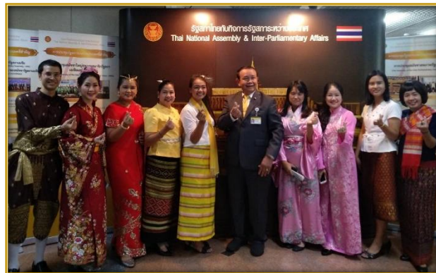
สมาชิกสภาผู้แทนราษฎรถ่ายภาพเป็นที่ระลึกกับชุมชนทรศการ