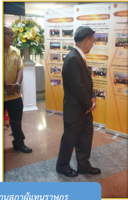
นายชวน หลีกภัย ประธานสภาผู้แทนราษฎร ขณะเข้าเยี่ยมชมชุมนุมมิตรศการ