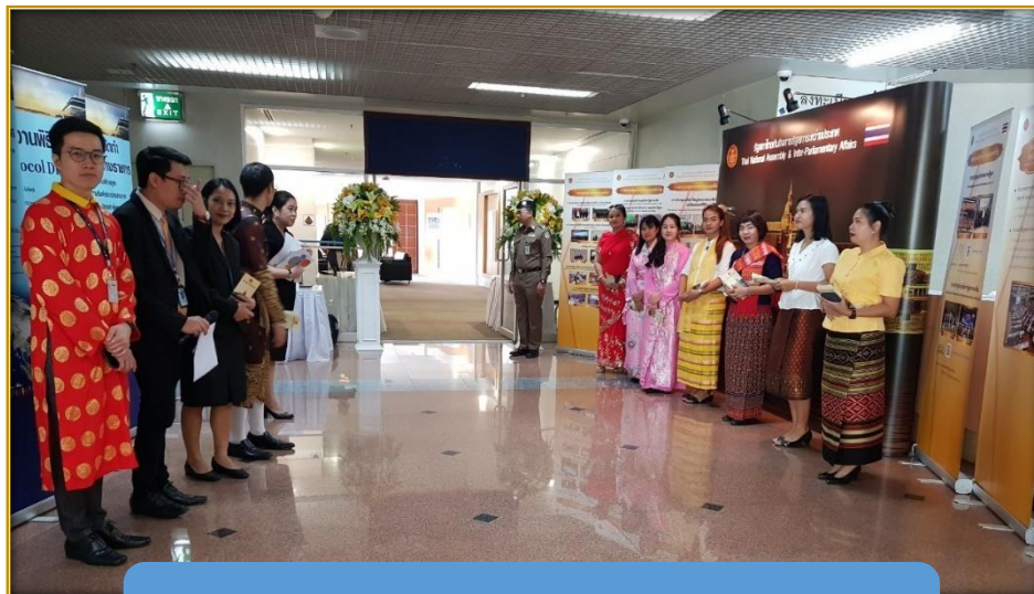
บริเวณโถงจัดแสดงขุมนิทรรศการ