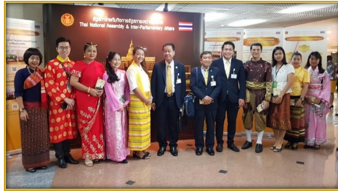
สมาชิกสภาผู้แทนราษฎรถ่ายภาพเป็นที่ระลึกกับขั้วมนตรีศการ