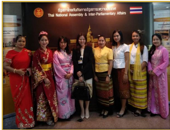
สมาชิกสภาผู้แทนราษฎรถ่ายภาพเป็นที่ระลึกกับชั้มนิทรรศการ