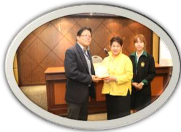
ศึกษาดูงาน สำนักงานคณะกรรมการป้องกันและปราบปรามการทุจริตแห่งชาติ (รุ่นที่ 2)