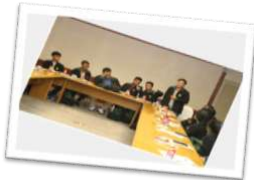
กิจกรรมสาระสังสรรค์