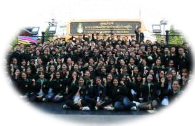
ศึกษาดูงาน ศาลปกครอง (รุ่นที่ 1 และ รุ่นที่ 2)