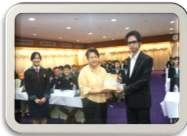
ศึกษาดูงาน องค์การสหประชาชาติ และรับฟังบรรยาย "Sustainable Development Goals : SDGs" (รุ่นที่ 2)