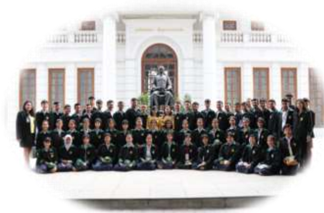
ศึกษาดูงาน สำนักงานคณะกรรมการการเลือกตั้ง (รุ่นที่ 1 และ รุ่นที่ 2)