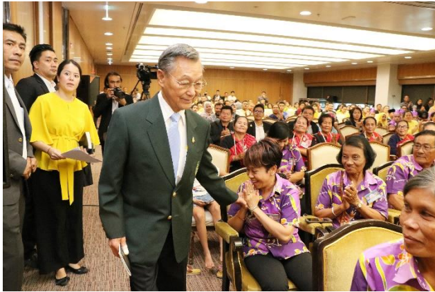
นายชวน หลีกภัย ประธานสภาผู้แทนราษฎร เป็นประธานในพิธีมอบรางวัล การประกวดนวัตกรรมประชารัฐไทย รอบชิงชนะเลิศ