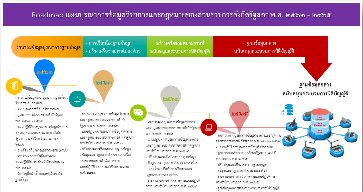
ภาพที่ ๒ Roadmap แผนบูรณาการฐานข้อมูลวิชาการและกฎหมายของส่วนราชการสังกัดรัฐสภา พ.ศ. ๒๕๖๒ – ๒๕๖๕

การจัดทำแผนบูรณาการฐานข้อมูลวิชาการและกฎหมายของส่วนราชการสังกัดรัฐสภา พ.ศ. ๒๕๖๒ – ๒๕๖๕ ได้กำหนดRoadmap ของการพัฒนา โดยให้มีช่วงระยะเวลาสอดคล้องกับแผนพัฒนา Digital Parliament ของรัฐสภา ระยะ ๕ ปี พ.ศ. ๒๕๖๑ – ๒๕๖๕ รายละเอียดดังนี้