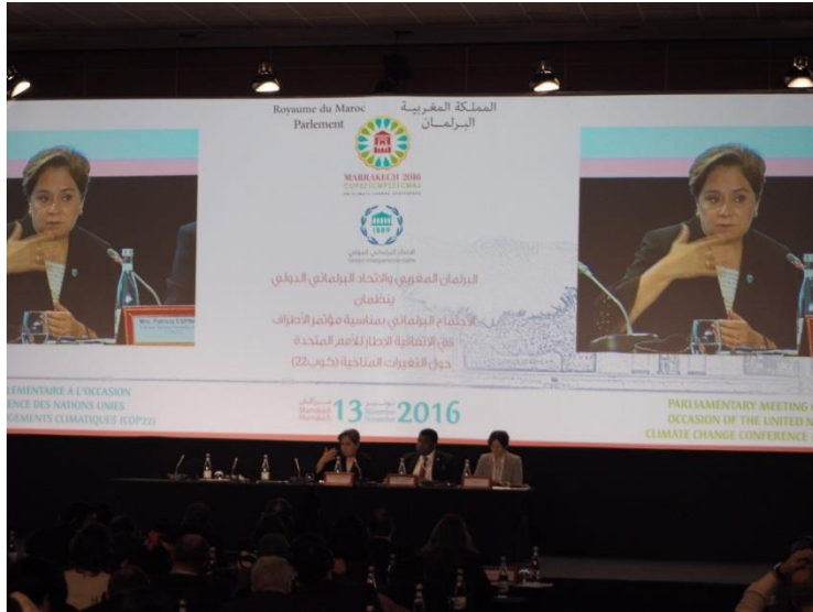
Ms. Patricia Espinosa เลขาธิการบริหาร UNFCCC

บรรยายสรุป หัวข้อ “Climate change negotiations post-Paris: New era, new opportunities”