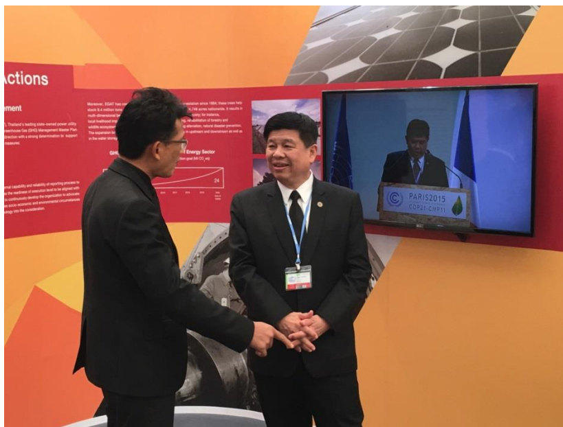
พลเอก สุรศักดิ์ กาญจนรัตน์ รัฐมนตรีว่าการกระทรวงทรัพยากรธรรมชาติและสิ่งแวดล้อม เยี่ยมชมนิทรรศการ ณ Thai Pavilion