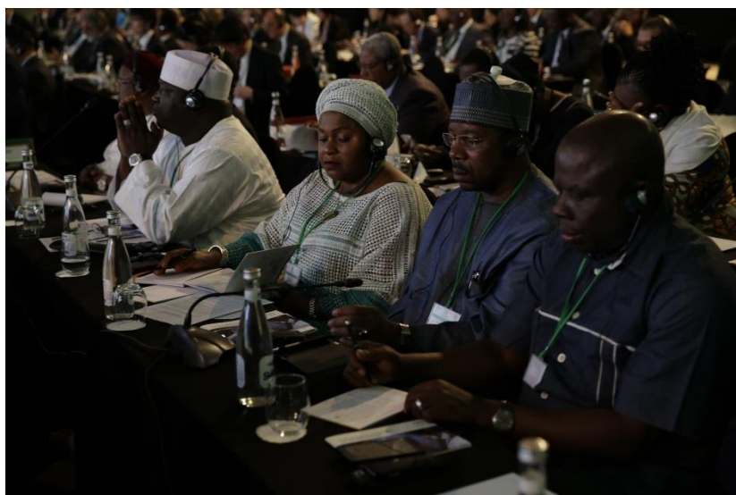
บรรยากาศการประชุม