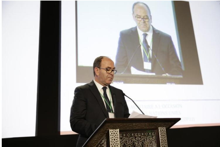
Mr. Hakim Benchamach ประธานวุฒิสภาโมร็อกโก กล่าวสุนทรพจน์ในพิธีเปิด

การประชุมเริ่มต้นด้วยการกล่าวสุนทรพจน์จากบุคคลสำคัญ ประกอบด้วย Mr. Hakim Benchamach ประธานวุฒิสภาโมร็อกโก และ Mr. Saber Chowdhury ประธานสหภาพรัฐสภา นอกจากนี้ ยังได้รับฟังการบรรยายสรุปในหัวข้อ “การเจรจาเรื่องการเปลี่ยนแปลงสภาพภูมิอากาศภายหลังการประชุม COP21 ณ กรุงปารีส : ยุคใหม่ โอกาสใหม่” (Climate change negotiations post-Paris: New era, new opportunities) โดย Ms. Patricia Espinosa เลขาธิการบริหารอนุสัญญาสหประชาชาติว่าด้วยการเปลี่ยนแปลงสภาพภูมิอากาศ (United Nations Framework Convention on Climate Change: UNFCCC)