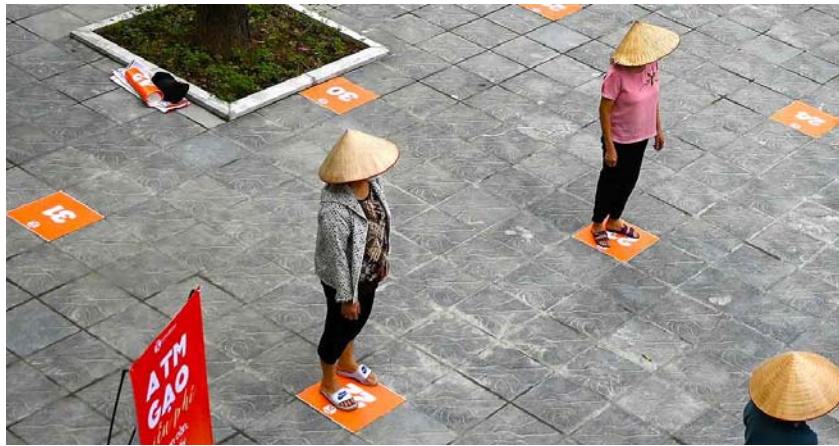
ประชาชนสวมหน้ากากอนามัยยืนเว้นระยะห่างระหว่างกัน ตามมาตรการรักษาระยะห่างทางสังคม (Social Distancing) ขณะเข้าแถวรับแจกข้าวสารในกรุงฮานอย