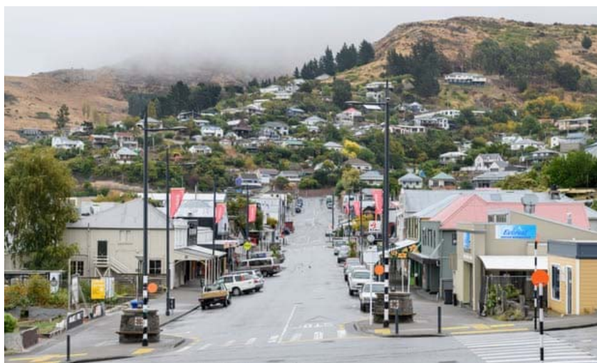
ถนนว่างเปล่าในประเทศนิวซีแลนด์เนื่องจากมาตรการล็อกดาวน์