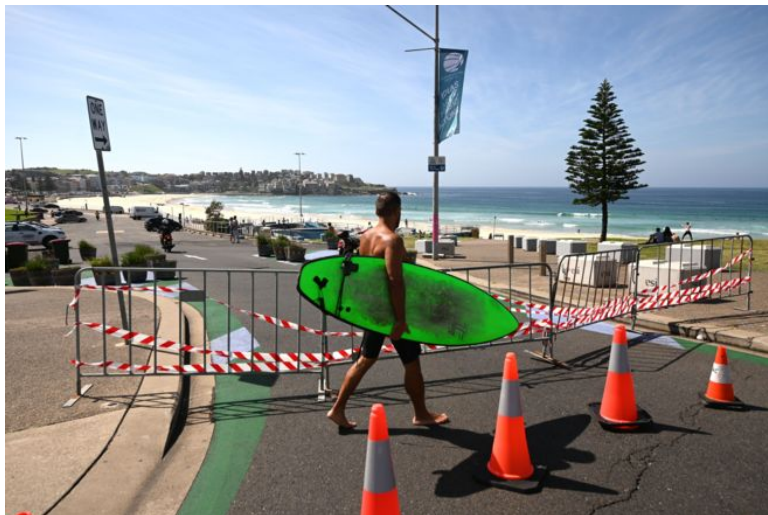
ชายหาดในประเทศออสเตรเลียถูกปิดในช่วงการแพร่ระบาดของโรคโควิด-๑๙