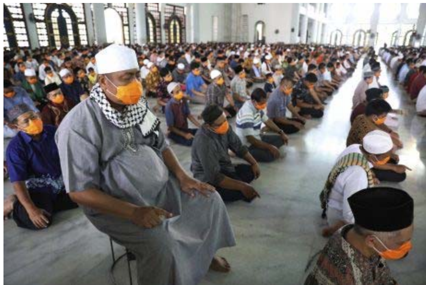
ชายชาวมุสลิมสวมหน้ากากอนามัยและเว้นระยะห่างประมาณ ๑ เมตรจากผู้อื่นในพิธีละหมาดวันศุกร์ เพื่อป้องกันการแพร่ระบาดของโรคโควิด-๑๙ ในมัสยิดประเทศอินโดนีเซีย