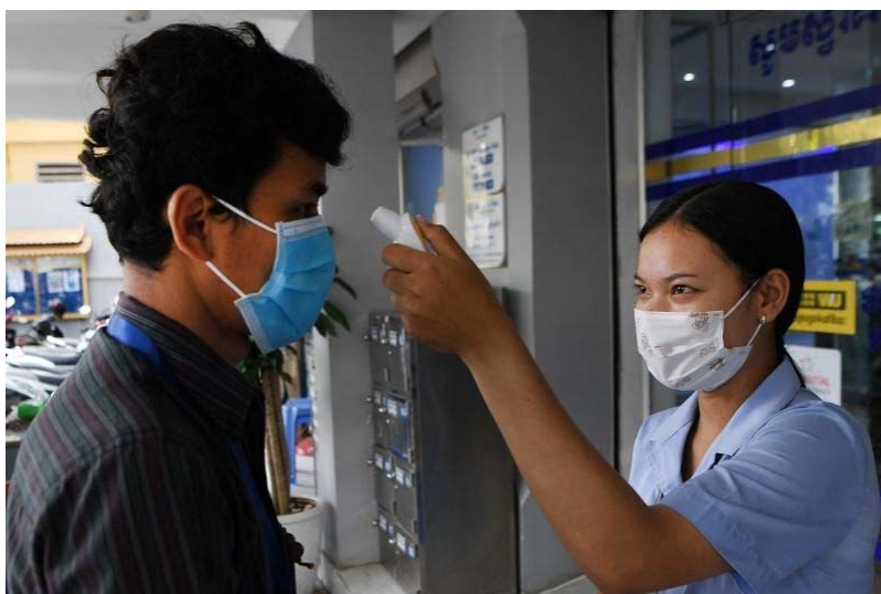
พนักงานสวมหน้ากากอนามัยเพื่อป้องกันการแพร่ระบาดของโรคโควิด-๑๙ วัดอุณหภูมิให้แก่ผู้มาใช้บริการก่อนเข้าไปในธนาคารในกรุงพนมเปญ