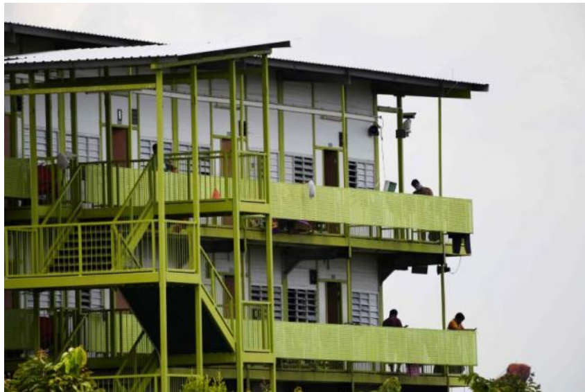
ผู้อาศัยพักอยู่ที่หอพักคนงานชาวต่างชาติภายใต้มาตรการป้องกันการแพร่ระบาดของโรคโควิด-๑๙ ในประเทศสิงคโปร์