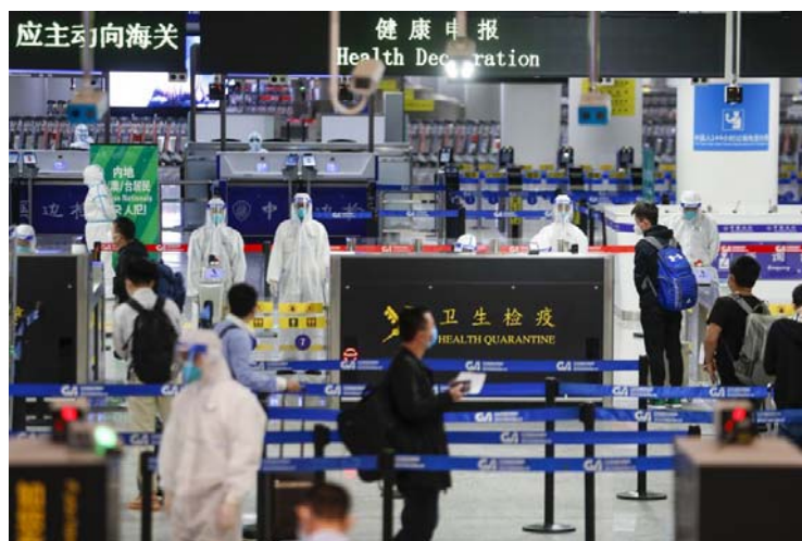
เจ้าหน้าที่ศุลกากรตรวจสอบข้อมูลสุขภาพของผู้เดินทางเข้าประเทศจีน