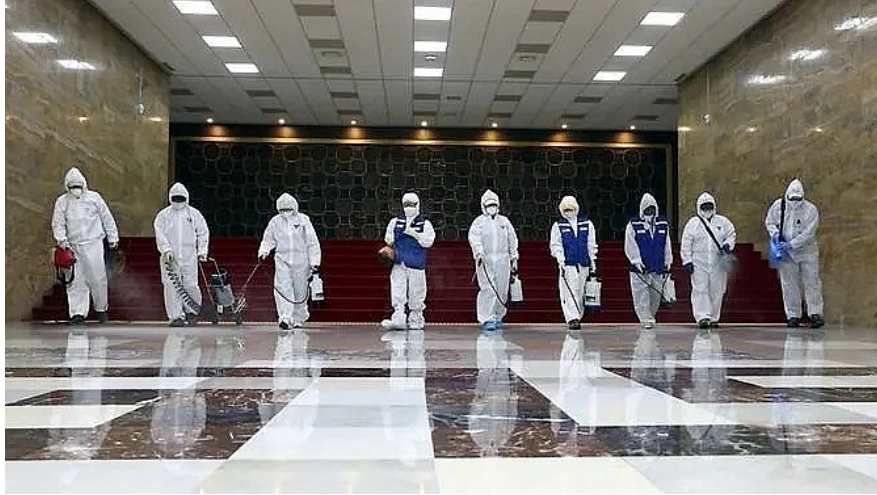
การฉีดพ่นน้ำยาฆ่าเชื้อซึ่งเป็นหนึ่งในมาตรการป้องกันโรคโควิด-๑๙ ในประเทศเกาหลีใต้