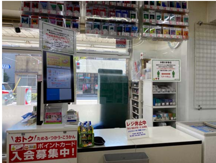
ป้ายขอความร่วมมือลูกค้ายืนห่างกัน ๑ เมตร ในร้านโลว์สัน ประเทศญี่ปุ่น