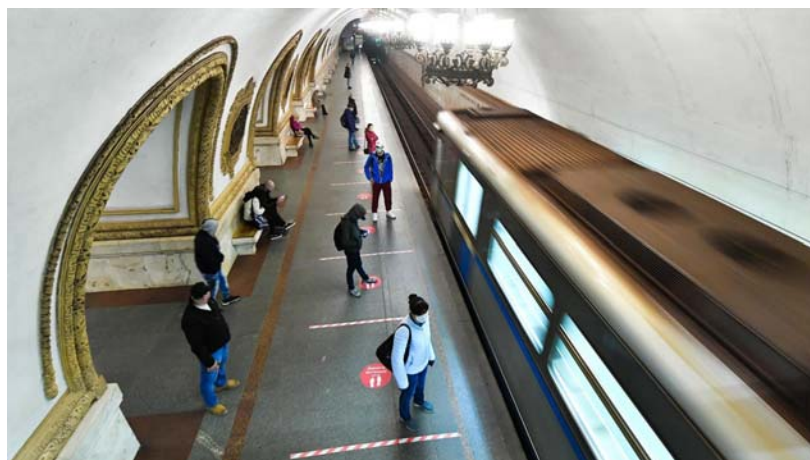
รัสเซียยกระดับมาตรการเพื่อลดการแพร่ระบาดของเชื้อโคโรนาไวรัส