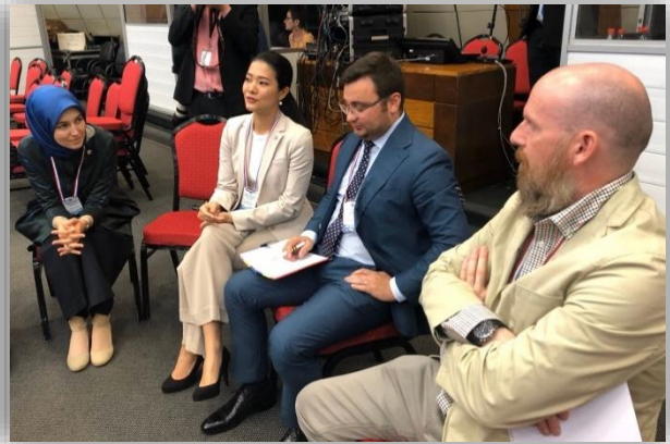
บรรยากาศระหว่างกิจกรรมการให้คำปรึกษา ช่วงแบ่งกลุ่มย่อย