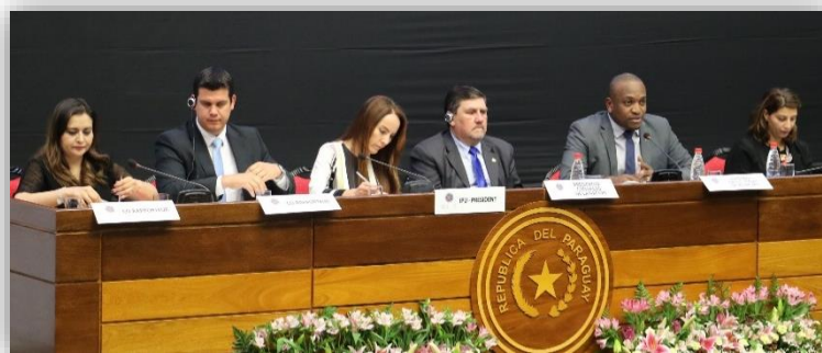
ผู้ร่วมอภิปรายในการรับรองร่างเอกสารผลลัพธ์ของการประชุมและพิธีปิดการประชุม