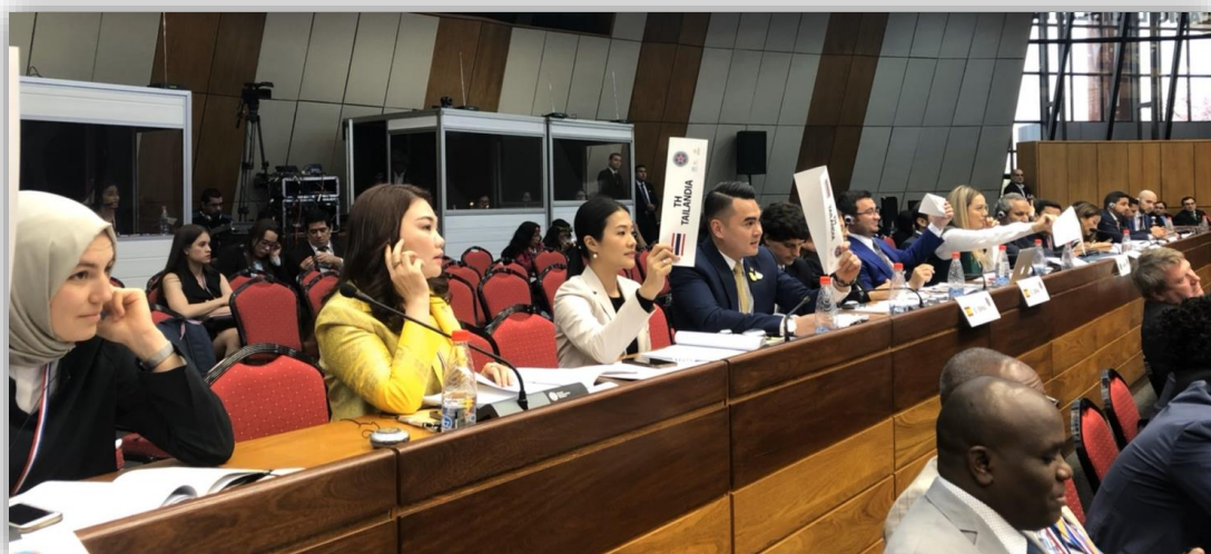
บรรยากาศระหว่างการเปิดโอกาสให้ผู้เข้าร่วมการประชุมได้แสดงความคิดเห็น ในการอภิปรายช่วงที่หนึ่ง