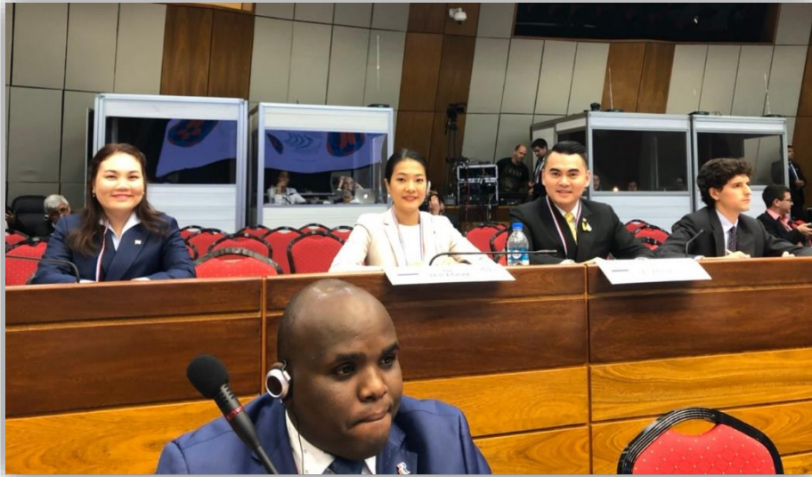
คณะผู้แทนรัฐสภาไทย ระหว่างรับฟังการฝึกอบรม ช่วงที่สอง

สำหรับช่วงที่สอง เป็นการบอกเล่าประสบการณ์โดยยุวมหาชารีรัฐสภาที่ต้องการแลกเปลี่ยน เกี่ยวกับการสื่อสารเรื่องราวส่วนตัว เป้าหมาย และจุดสนใจ ในฐานะสมาชิกรัฐสภา การส่งเสริมปฏิสัมพันธ์ทางสื่อสังคมออนไลน์ และการสื่อสารในรูปแบบแบบเดิม และการรับมือกับประเด็นอ่อนไหวด้วยความมั่นใจ