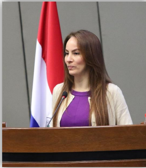
Ms. Gabriela Cuevas Barron ประธานสหภาพรัฐสภา ระหว่างกล่าวถ้อยแถลงในพิธีเปิดการประชุม

๒) Ms. Gabriela Cuevas Barron ประธานสหภาพรัฐสภา ได้กล่าวถ้อยแถลงโดยมีสาระสำคัญว่า ในฐานะที่ตนดำรงตำแหน่งประธานสหภาพรัฐสภาขณะที่เป็นยุวสมาชิกรัฐสภา จึงรู้สึกถึงความจำเป็นที่จะทำงานเพื่อเป็นกระบอกเสียงให้แก่เยาวชนทั่วโลกในกระบวนการทางการเมือง ดังนั้น ยุวสมาชิกรัฐสภาที่มีโอกาสเข้าร่วมการประชุมนี้จึงเป็นตัวแทนของการเสริมพลังเยาวชน และเชื่อว่ายุวสมาชิกรัฐสภาทั้งหลายต้องการความเป็นอยู่ที่ดีมากกว่าความมั่งคั่ง ความสำเร็จ หรืออำนาจ ความเป็นอยู่ที่ดีคือวัตถุประสงค์หลักเมื่อต้องการกล่าวถึงนโยบายสาธารณะและการออกกฎหมาย การแสวงหาความสุขจึงสะท้อนกลับมาเป็นกลไกแห่งความปรารถนาดีสำหรับคนที่เรารัก และการอภิปรายจากที่ประชุมอาจไขคำตอบบางประการที่เกี่ยวกับเรื่องนี้ได้ ขณะนี้โลกได้เคลื่อนสู่ความท้าทายที่ต้องการแนวคิดใหม่เพื่อเดินหน้าสู่ความยั่งยืนมากกว่าการขยายอัตราการเจริญเติบโตทางเศรษฐกิจเพียงอย่างเดียว ความเป็นอยู่ที่ดีและความยั่งยืนจึงต้องไปด้วยกัน ในปี ๒๕๕๘ ทั่วโลกเห็นชอบร่วมกันเกี่ยวกับ SDGs จำนวน ๑๗ เป้าหมาย ซึ่งเป็นพื้นฐานไปสู่ความเป็นอยู่ที่ดี แต่จากรายงานของสหประชาชาติที่ผ่านมาเมื่อไม่นานนี้สะท้อนว่าโลกยังห่างไกลจากความสำเร็จในการบรรลุ SDGs โดยเฉพาะในด้านความยากจน การเปลี่ยนแปลงสภาพภูมิอากาศ การว่างงาน และความรุนแรงทางเพศ จึงต้องเร่งรัดการปฏิบัติโดยด่วนเพื่ออนุชนรุ่นหลังต่อไป