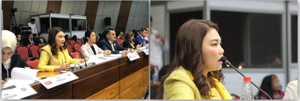
นางสาววิไลลักษณ์ อรินทมะพงษ์ สมาชิกวุฒิสภา ผู้แทนรัฐสภาไทย ขณะกล่าวถ้อยแถลงต่อที่ประชุม ในการอภิปรายช่วงที่สอง หัวข้อย่อยที่หนึ่ง