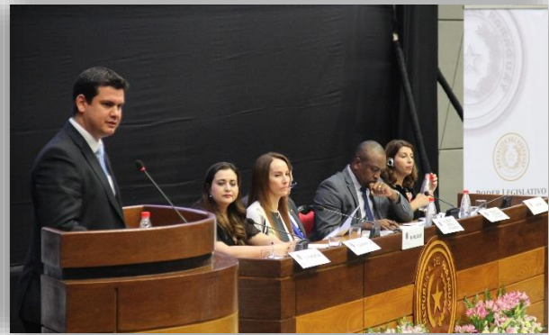
ผู้ร่วมเสนอรายงานจากเม็กซิโกและปารากวัยขึ้นกล่าวสรุปเนื้อหาในร่างเอกสารผลลัพธ์ของการประชุม