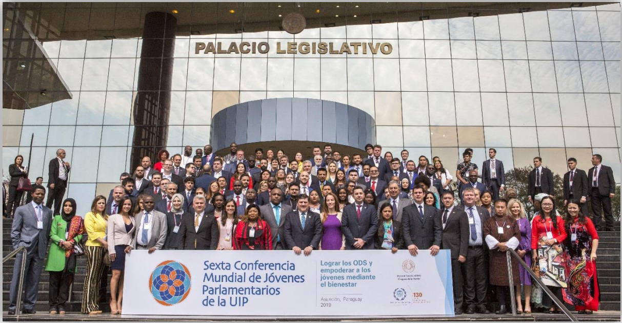
ยุวสมาชิกรัฐสภา และผู้เข้าร่วมการประชุม ถ่ายภาพเป็นที่ระลึก บริเวณด้านหน้าอาคารรัฐสภา ร่วมกับประธานรัฐสภาปารากวัย ประธานสหภาพรัฐสภา และประธานสภาผู้แทนราษฎรปารากวัย