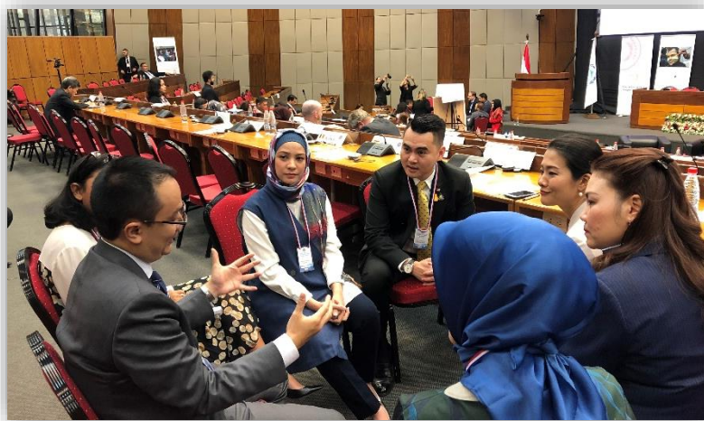
บรรยากาศระหว่างกิจกรรมการฝึกอบรม ช่วงที่หนึ่ง