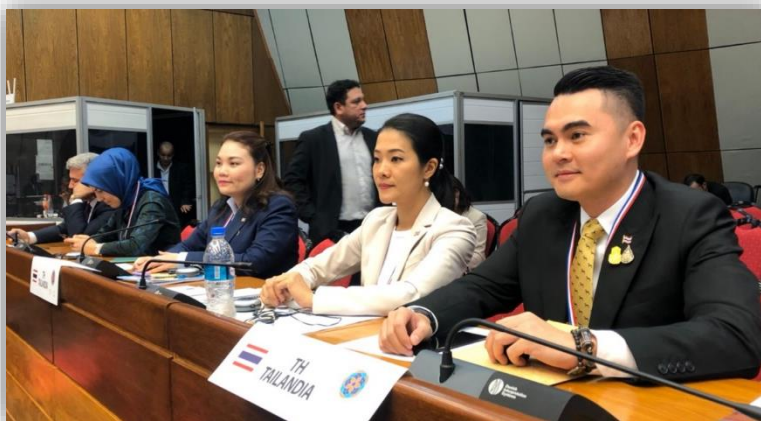
คณะผู้แทนรัฐสภาไทย ระหว่างรับฟังการให้คำปรึกษา โดยสมาชิกรัฐสภาผู้ให้คำปรึกษา

จากนั้น ที่ประชุมได้แบ่งกลุ่มย่อย จำนวนสมาชิกกลุ่มละประมาณ ๘ – ๑๐ คน เพื่อหารือแลกเปลี่ยนและอภิปรายร่วมกันถึงสิ่งที่สมาชิกกลุ่มเห็นว่ามีคามจำเป็นและเหมาะสมสำหรับการให้คำปรึกษาที่มีประสิทธิภาพ ตลอดจนแสวงหาคำตอบเกี่ยวกับ (๑) สิ่งให้ผู้ให้คำปรึกษาไม่ควรกระทำ กับ (๒) สิ่งที่ได้รับคำปรึกษาประสงค์จะได้รับจากผู้ให้คำปรึกษา