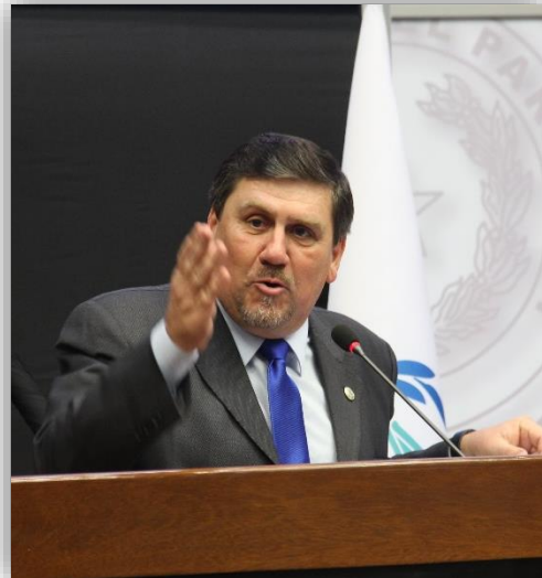
ประธานรัฐสภาปารากวัย ระหว่างกล่าวในพิธีปิดการประชุม