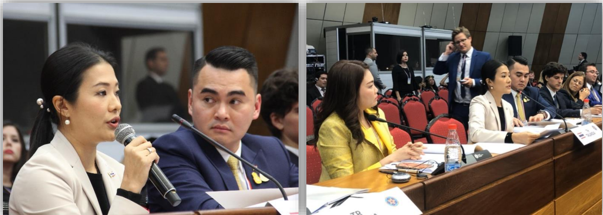
นางสาวธีรรัตน์ สำเร็จวานิชย์ สมาชิกสภาผู้แทนราษฎร หัวหน้าคณะผู้แทนรัฐสภาไทย ขณะกล่าวถ้อยแถลงต่อที่ประชุม ในการอภิปรายช่วงที่หนึ่ง

อนึ่ง หัวหน้าคณะผู้แทนรัฐสภาไทยได้แจ้งให้ที่ประชุมทราบเพิ่มเติมว่า รัฐสภาไทยชุดปัจจุบันมีส่วนและจำนวนวุฒิสมาชิกรัฐสภาที่เพิ่มมากขึ้นกว่าที่ผ่านมา จึงมีความภาคภูมิใจและเชื่อว่าวุฒิสมาชิกรัฐสภาของไทยพร้อมที่จะแลกเปลี่ยนเรียนรู้แนวปฏิบัติที่ดี เป็นกำลังสำคัญและสร้างความเปลี่ยนแปลงให้เกิดขึ้นแก่ประเทศไทยต่อไป