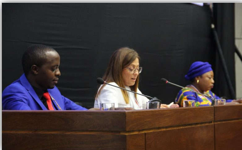
บรรยากาศระหว่างการนำเสนอผลลัพธ์ที่ได้จากกิจกรรมแบ่งกลุ่ม

เมื่อเวลา ๑๖.๔๕ - ๑๗.๑๕ นาฬิกา ที่ประชุมได้เข้าสู่ระเบียบวาระการนำเสนอผลลัพธ์ที่ได้จากกิจกรรมแบ่งกลุ่ม ในช่วงกิจกรรมการให้คำปรึกษาและกิจกรรมการฝึกอบรม ซึ่งผู้แทนจากกลุ่มผู้ใช้ภาษาต่าง ๆ ขึ้นกล่าวอภิปราย ทั้งนี้ ผู้แทนจากกลุ่มผู้ใช้ภาษาอังกฤษ ได้กล่าวสรุปเกี่ยวกับแนวปฏิบัติที่ดีของผู้ให้คำปรึกษา โดยเฉพาะพฤติกรรมที่เหมาะสมของผู้ให้คำปรึกษา อาทิ ไม่ควรเอาเปรียบผู้รับคำปรึกษา เป็นแบบอย่างที่เหมาะสม และเล็งเห็น ตลอดจนส่งเสริมทักษะให้กับผู้รับคำปรึกษา ทั้งนี้ กลุ่มผู้ใช้ภาษาอังกฤษ เห็นว่า แนวทางเพื่อไปสู่ฉันทามติ ประกอบด้วย การมีปฏิสัมพันธ์กับทุกภาคส่วนในรัฐสภา การรับฟังคำแนะนำจากทุกฝ่ายที่เกี่ยวข้อง การตรวจสอบการนำนโยบายไปปฏิบัติ และการเสริมพลังซึ่งกันและกัน