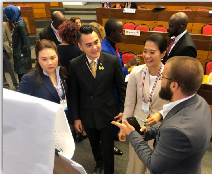
คณะผู้แทนรัฐสภาไทย ระหว่างการพิจารณาให้คะแนนคำตอบที่ประทับใจ