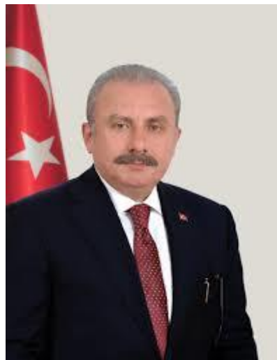
นายมุสตาฟา เซ็นทอป (Mr. Mustafa ŞENTOP) ประธานรัฐสภาตุรกี และประธานสมัชชารัฐสภาเอเชีย (Asian Parliamentary Assembly - APA)