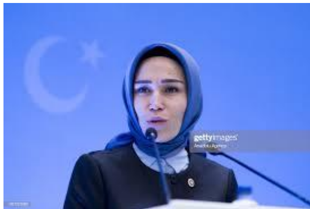
นางอสุมาน เออร์โดกัน (Mrs. Asuman ERDOGAN) สมาชิกรัฐสภาตุรกี หัวหน้าคณะผู้แทนรัฐสภาตุรกี และประธานการประชุม

สำหรับการเป็นเจ้าภาพในการประชุมในครั้งนี้ เป็นช่วงเวลาการพัฒนาทางการเมืองและ เศรษฐกิจซึ่งจะเป็นการนำพาทวีปเอเชียไปสู่แนวหน้าในเวทีโลก เพื่อเสริมสร้างความเข้มแข็งทางการเมือง เศรษฐกิจ และสังคมในเอเชียผ่านความร่วมมือและแก้ไขปัญหาร่วมกัน ผลกระทบของการแพร่ระบาดของ โรคติดเชื้อไวรัสโคโรนา 2019 (โควิด-19) ส่งผลถึงด้านการเมือง เศรษฐกิจและการค้า และด้านอื่น ๆ ในอนาคต จะสามารถสร้างและรักษาโลกที่แข็งแกร่ง แก้ไขปัญหาได้ผ่านความร่วมมือพหุภาคีและความร่วมมือที่แข็งแกร่ง นอกจากนี้ ตุรกีจัดเป็นประเทศที่ได้รับผลกระทบน้อยจากการแพร่ระบาดของโรคติดเชื้อไวรัสโคโรนา 2019 (โควิด-19) เพราะว่ามีระบบประกันสุขภาพที่ครอบคลุมให้กับประชาชน ซึ่งได้รับประโยชน์จากระบบประกัน สุขภาพทั่วกัน ทั้งนี้ ในการบรรลุผลสำเร็จในสถานการณ์การแพร่ระบาดของโรคคือ การสนับสนุนทาง เศรษฐกิจและสังคมให้ครอบคลุมกับประชาชน รวมทั้งจะสามารถสร้างอนาคตร่วมกันได้ด้วยความเป็นปึกแผ่น และความร่วมมือระหว่างประเทศ