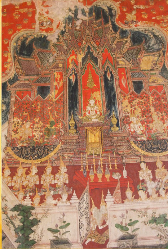
ภาพพระเนมิราช ฝีมือครูทออยู่ จิตรกรเอกสมัยรัชกาลที่ ๓