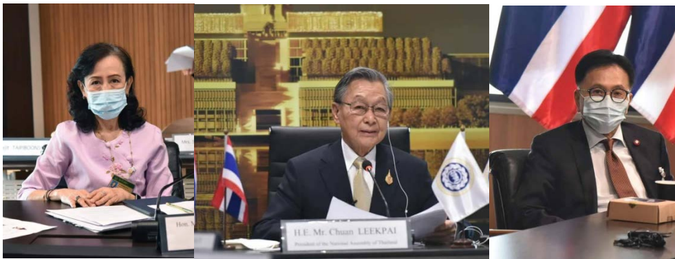
คณะผู้แทนรัฐสภาไทยเข้าร่วมการประชุมคณะมนตรีสหภาพสมาชิกรัฐสภาเอเชียและแปซิฟิก ครั้งที่ ๘๔ และการประชุมสมัชชาใหญ่สหภาพสมาชิกรัฐสภาเอเชียและแปซิฟิก ครั้งที่ ๕๐