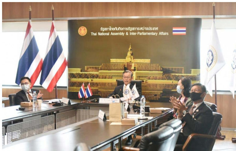
นายชวน หลีกภัย ประธานรัฐสภา หัวหน้าคณะผู้แทนรัฐสภาไทย นำเสนอรายงานประเทศ (Country Report)

ได้กล่าวถึงการพิจารณาเข้าร่วมความตกลงพันธมิตรทางการค้าระดับภูมิภาค (Regional Comprehensive Economic Partnership - RCEP) เพื่อขยายมูลค่าการค้าระหว่างประเทศและกระตุ้นเศรษฐกิจภายในประเทศ สมาชิกบางประเทศกล่าวถึงแผนการจัดหาวัคซีนป้องกันโควิด-๑๙ เพื่อแจกจ่ายให้บุคลากรทางการแพทย์ ผู้สูงอายุและกลุ่มผู้มีความเสี่ยงด้านสุขภาพ และประชาชนทั่วไปตามลำดับ นอกจากนี้หลายประเทศเน้นย้ำความสำคัญของบทบาทรัฐสภาในการอนุมัติงบประมาณแผ่นดินและควบคุมการใช้จ่ายงบประมาณของฝ่ายบริหาร และความสำคัญของความร่วมมือระหว่างประเทศในการรับมือความท้าทายที่มีลักษณะข้ามพรมแดนเพื่อสร้างสันติสุขและความเจริญรุ่งเรืองในภูมิภาคซึ่งเป็นหลักการพื้นฐานของสหภาพสมาชิกรัฐสภาเอเชียและแปซิฟิก