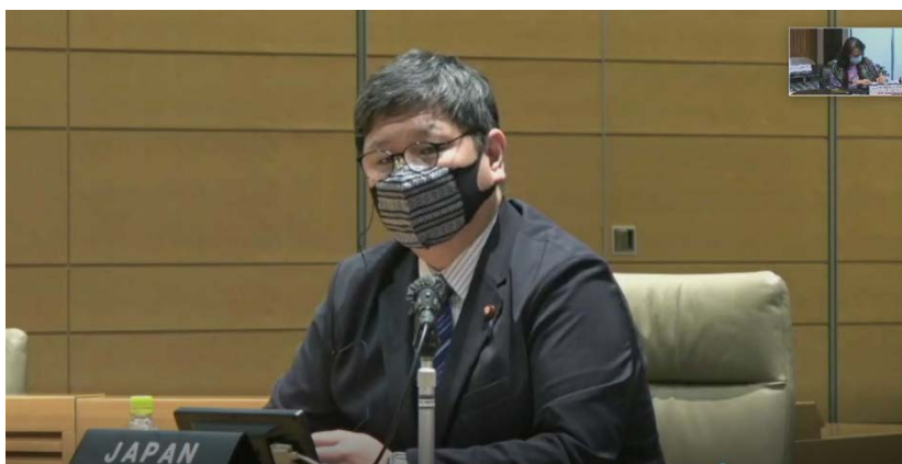
นายโยอิจิ อะนามิ สมาชิกสภาผู้แทนราษฎรญี่ปุ่น หนึ่งในรองประธานการประชุมสมัชชาใหญ่ฯ จากประเทศญี่ปุ่น แสดงความคิดเห็นภายหลังเสร็จสิ้นการนำเสนอรายงานประเทศ

นอกจากนี้ เมื่อเสร็จสิ้นการนำเสนอรายงานประเทศ ประธานการประชุมสมัชชาใหญ่ฯ ได้เปิดโอกาส ให้หน่วยประจำชาติแต่ละหน่วยอภิปรายและแลกเปลี่ยนความคิดเห็น ผู้แทนหน่วยประจำชาติไต้หวันกล่าวว่า ความสำเร็จของไต้หวันในการควบคุมการระบาดของโควิด-๑๙ ได้รับการยอมรับจากนานาชาติประเทศ ใดๆก็ตาม ไต้หวันถูกกีดกันออกจากการมีส่วนร่วมขององค์การอนามัยโลกซึ่งมีวัตถุประสงค์และพันธกิจ ในการส่งเสริมสุขภาพสำหรับทุกคน (Health for All) ดังนั้น เพื่อให้บรรลุเป้าหมายในการส่งเสริมสุขภาพ สำหรับทุกคนอย่างแท้จริง ไต้หวันและประชาคมระหว่างประเทศควรได้มีส่วนร่วมขององค์การอนามัยโลกด้วย หลังจากนั้น นายโยอิจิ อะนามิ สมาชิกสภาผู้แทนราษฎรญี่ปุ่น หนึ่งในรองประธานการประชุมสมัชชาใหญ่ฯ จากประเทศญี่ปุ่น ได้แสดงความคิดเห็นสนับสนุนข้อเสนอของไต้หวันและขอให้สมาชิกของสหภาพสมาชิก รัฐสภาเอเชียและแปซิฟิกทุกประเทศร่วมสนับสนุนการมีบทบาทในเวทีระหว่างประเทศของไต้หวันด้วย