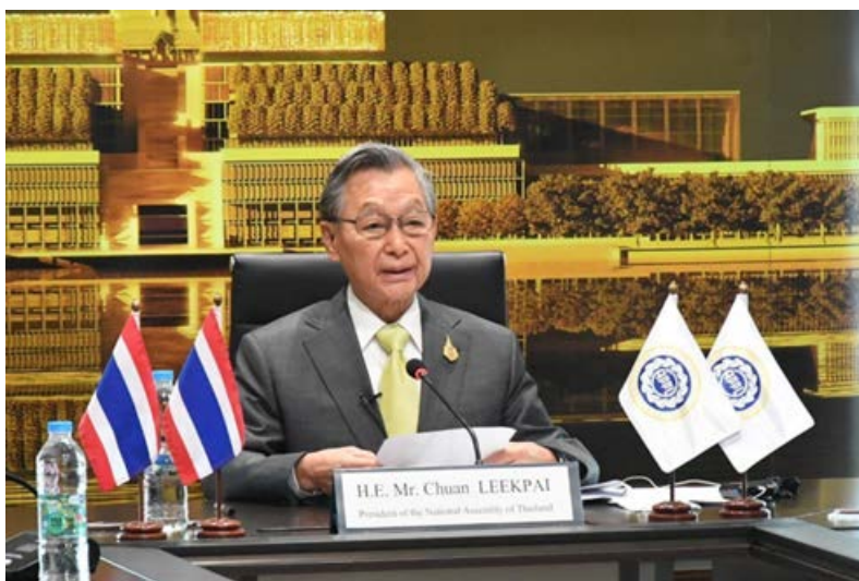
นายชวน หลีกภัย ประธานรัฐสภา หัวหน้าคณะผู้แทนรัฐสภาไทย เข้าร่วมการรับรองแถลงการณ์ร่วม (Joint Communiqué)

จากนั้น นายชวน หลีกภัย ประธานรัฐสภา ในฐานะหัวหน้าคณะผู้แทนรัฐสภาไทย ได้กล่าวขอบคุณรัฐสภาญี่ปุ่น ในฐานะประเทศเจ้าภาพจัดการประชุมและผู้แทนรัฐสภาสมาชิกสหภาพฯ ที่มีส่วนสำคัญทำให้การประชุมครั้งนี้ประสบความสำเร็จไปได้ด้วยดี พร้อมทั้งกล่าวขอบคุณรัฐสภาคิริบาส ที่ให้เกียรติรับเป็นเจ้าภาพจัดการประชุมคณะมนตรีสหภาพสมาชิกรัฐสภาเอเชียและแปซิฟิก ครั้งที่ ๘๕ และการประชุมสมัชชาใหญ่สหภาพรัฐสภาเอเชียและแปซิฟิก ครั้งที่ ๕๑