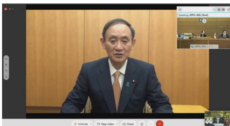
วิดีโอทัศนสารจากนายโยชิฮิเดะ สึเกะ (H.E. Mr. Yoshihide Suga) นายกรัฐมนตรีญี่ปุ่น ในพิธีเปิดการประชุมสมัชชาใหญ่สหภาพสมาชิกรัฐสภาเอเชียและแปซิฟิก ครั้งที่ ๕๐

หลังจากนั้นมีการฉายวิดีโอทัศนสารจากนายโยชิฮิเดะ สึเกะ (H.E. Mr. Yoshihide Suga) นายกรัฐมนตรีญี่ปุ่น ซึ่งกล่าวถึงความเป็นมาของสหภาพสมาชิกรัฐสภาเอเชียและแปซิฟิกที่ก่อตั้งขึ้นท่ามกลางความตึงเครียดระหว่างโลกตะวันออกและโลกตะวันตกในภูมิภาคเอเชีย ก่อนที่ประเทศในภูมิภาคแปซิฟิกจะเข้าร่วมด้วย ในเวลาต่อมา ปัจจุบัน มนุษยชาติกำลังเผชิญหน้ากับวิกฤตใหม่ที่ไม่เคยเจอมาก่อน การแพร่ระบาดของโควิด-๑๙ ไม่ได้กระทบในเชิงสาธารณสุขหรือเศรษฐกิจเท่านั้นแต่ยังกระทบการดำรงชีวิตประจำวันทุกมิติ ซึ่งญี่ปุ่นพร้อมร่วมมือกับนานาประเทศในการแก้ไขวิกฤตดังกล่าว นอกจากนี้ ปี ๒๕๖๔ ยังเป็นวาระการครบรอบ ๑๐ ปี เหตุแผ่นดินไหวรุนแรงในพื้นที่ตะวันออกเฉียงเหนือของญี่ปุ่น ญี่ปุ่นจึงขอใช้โอกาสนี้แสดงความขอบคุณมิตรประเทศที่ได้ให้ความช่วยเหลือแก่ญี่ปุ่น ประสบการณ์จากวิกฤตครั้งนั้นและการเลื่อนกำหนดการจัดแข่งขันกีฬาโอลิมปิกใหม่ ทำให้ญี่ปุ่นสื่อสารกับนานาชาติได้ว่าญี่ปุ่นสามารถแสดงบทบาทอย่างแข็งขันและร่วมมือกับนานาชาติในการรับมือกับวิกฤตเพื่ออนาคตที่ดีกว่าเดิมได้