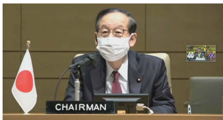
นายซุนอิจิ ยามากูจิ สมาชิกรัฐสภาญี่ปุ่น ประธานการประชุมสมัชชาใหญ่ฯ ครั้งที่ ๕๐ กล่าวปิดการประชุม

ในช่วงสุดท้าย นายซุนอิจิ ยามากูจิ สมาชิกรัฐสภาญี่ปุ่น ในฐานะประธานการประชุมสมัชชาใหญ่ฯ ทำหน้าที่กล่าวปิดการประชุมและกล่าวขอบคุณผู้แทนรัฐสภาสมาชิกสหภาพสมาชิกรัฐสภาเอเชียและแปซิฟิก