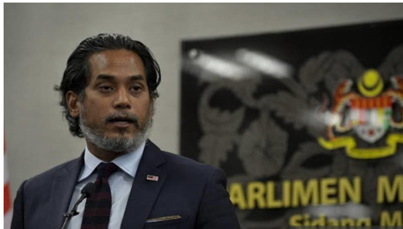
รัฐมนตรีว่าการกระทรวงวิทยาศาสตร์ เทคโนโลยีและนวัตกรรม นายไครี ญามาลุดดีน (Khairy Jamaluddin)

ก่อนหน้านี้เมื่อวันพฤหัสบดีที่ผ่านมา นายไครี ญามาลุดดีน (Khairy Jamaluddin) รัฐมนตรีว่าการกระทรวงวิทยาศาสตร์ เทคโนโลยีและนวัตกรรมกล่าวว่า ผู้ที่ไม่ได้อาศัยอยู่กับพ่อแม่ ปู่ย่าตายายที่ป่วยหรืออายุมากจะได้รับอนุญาตให้กลับบ้านเพื่อนำกลุ่มคนดังกล่าวมารับการฉีดวัคซีน COVID-19