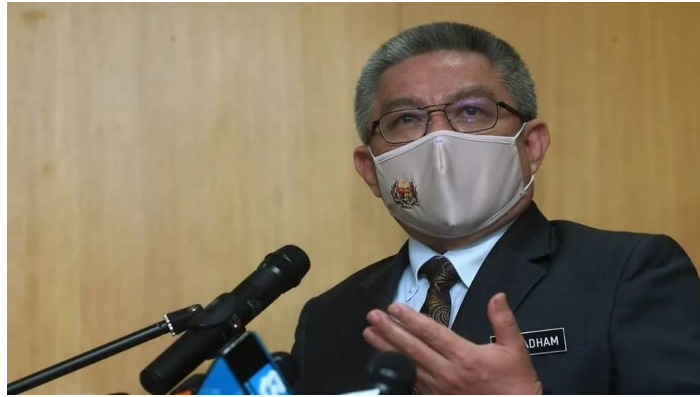
Malaysian Health Minister Adham Baba

15 Apr 2021 04:42 PM (Updated: 15 Apr 2021 04:50PM)