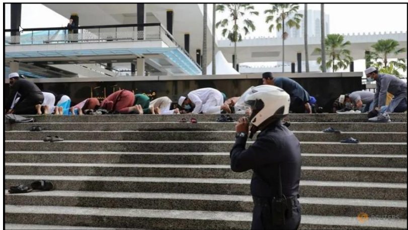
A police officer gives warning to Muslims praying outside the closed National Mosque, during Hari Raya, the Muslim festival marking the end the holy fasting month of Ramadan, amid the coronavirus disease (COVID-19) outbreak in Kuala Lumpur, Malaysia May 24, 2020.

He noted that many parties have appealed to the government to permit interstate travel for this major festival.