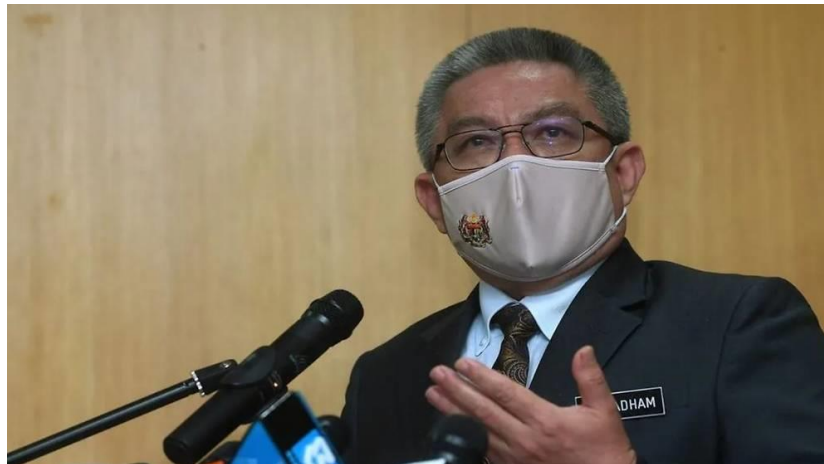
Adham Baba รัฐมนตรีว่าการกระทรวงสาธารณสุขมาเลเซีย

กัวลาลัมเปอร์: กระทรวงสาธารณสุขมาเลเซียเสนอให้เลื่อนการเดินทางระหว่างรัฐออกไปสำหรับเทศกาลตรุษอีดีลฟิฏริ (Hari Raya Aidilfitri)ที่กำลังจะมาถึงเนื่องจากจำนวนผู้ติดเชื้อโควิด-๑๙ (COVID-19) รายวันใหม่ยังคงเพิ่มขึ้นอย่างต่อเนื่อง