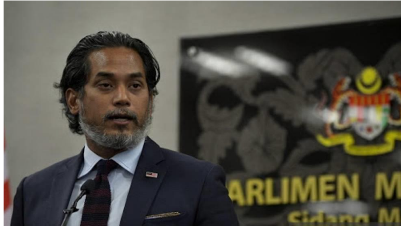
Minister for Science, Technology and Innovation Khairy Jamaluddin.

Earlier on Thursday, Minister for Science, Technology and Innovation Khairy Jamaluddin said those living apart from their sick or aged parents or grandparents would be allowed to return home to accompany the latter for their COVID-19 vaccinations.