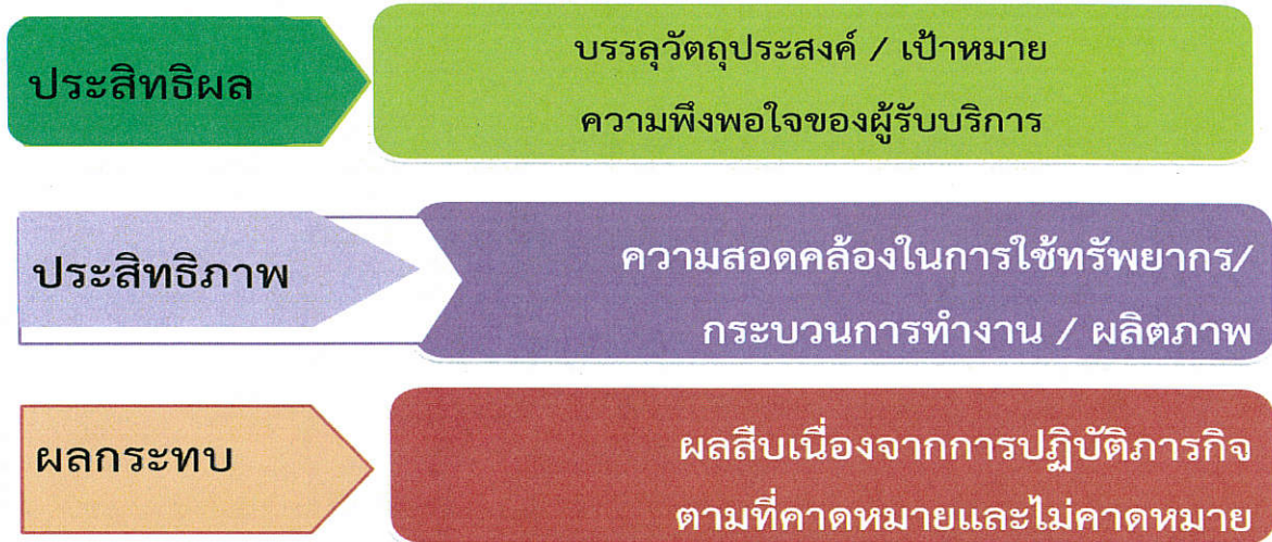
แผนภาพที่ ๓ กรอบการประเมินความคุ้มค่า

เพื่อให้การประเมินความคุ้มค่าเป็นเครื่องมือที่ผู้บริหารส่วนราชการสังกัดรัฐสภาใช้ประกอบการพิจารณาทางเลือกในการปฏิบัติการกิจที่ก่อประโยชน์ตามพันธกิจของส่วนราชการและต่อประชาชนอย่างสูงสุด การประเมินผลการดำเนินงาน จึงควรให้ความสำคัญกับประเด็นการทำงานใน ๓ มิติ ได้แก่ มิติประสิทธิผล ควบคู่ไปกับมิติประสิทธิภาพ และมิติผลกระทบ ซึ่งมีความหมายและตัวอย่างตัวชี้วัด ดังนี้