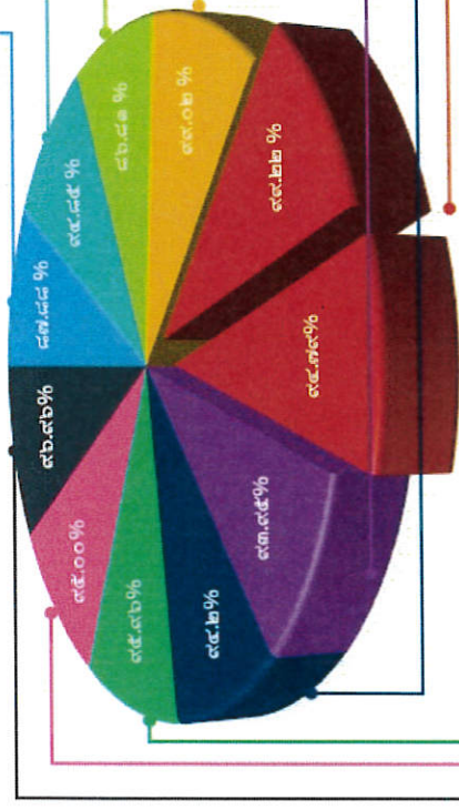
คะแนนประเมินตนเองของกองทัพอากาศให้คะแนนตัวชี้วัด