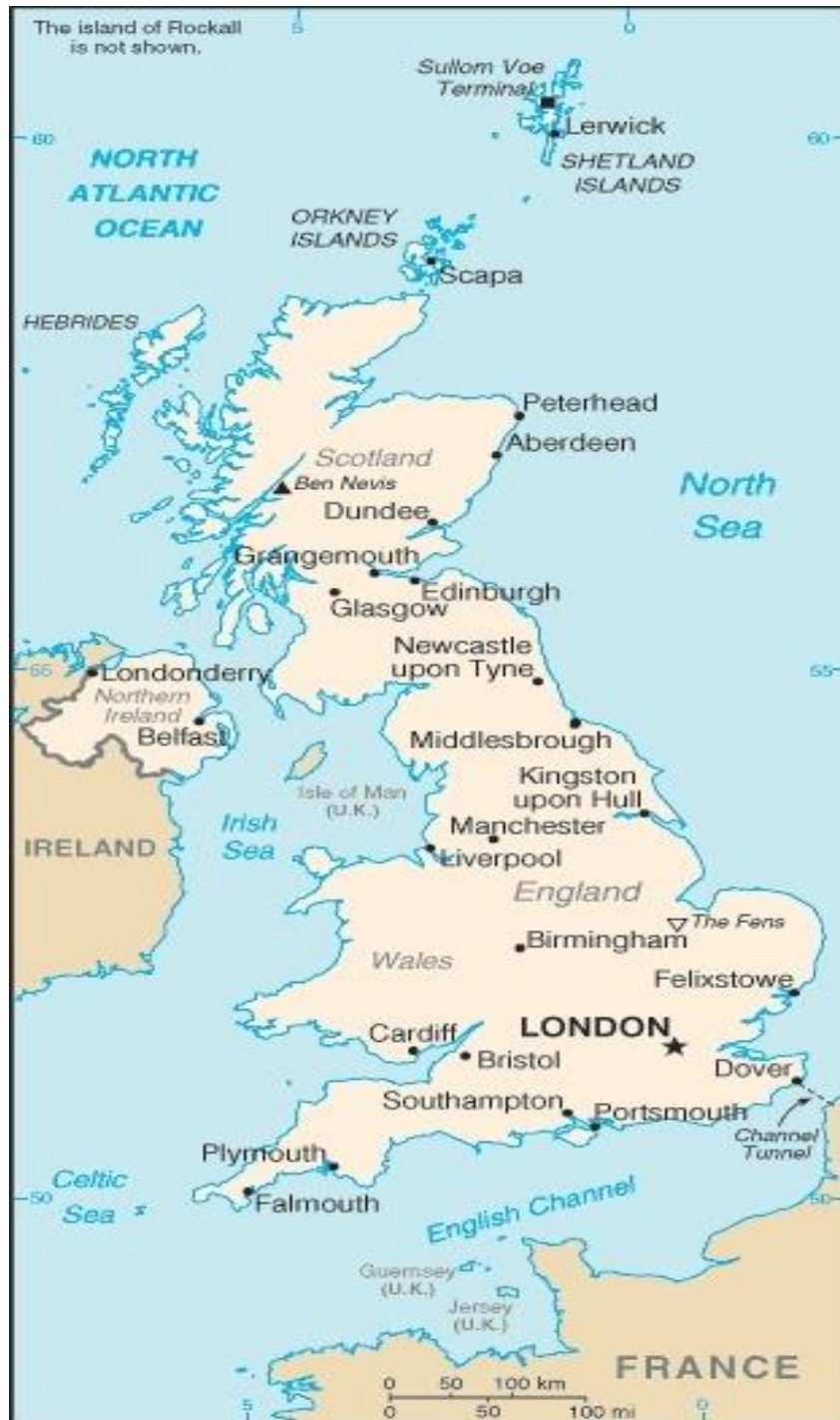
ภาพที่ 1 แผนที่ของสหราชอาณาจักรบริเตนใหญ่และไอร์แลนด์เหนือ