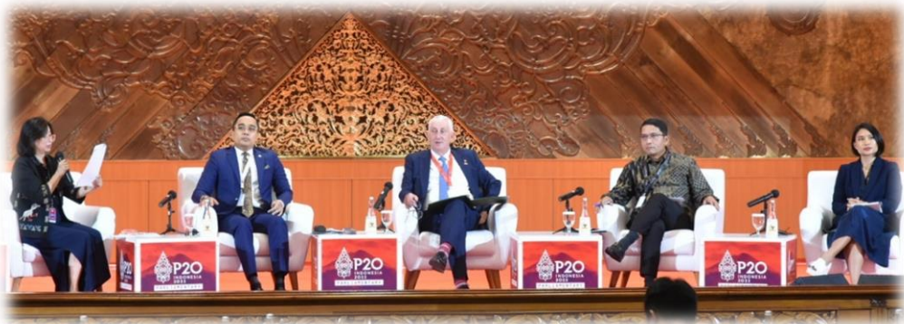
บรรยากาศระหว่างการอภิปรายภาครัฐสภา หัวข้อที่สอง

ดำเนินรายการโดย Ms. Evi Mariani ผู้สื่อข่าว ผู้ร่วมก่อตั้งและผู้อำนวยการบริหาร Project Multatul