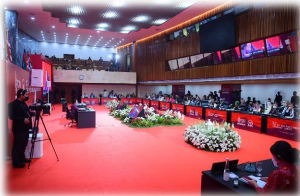
บรรยากาศในการอภิปราย ช่วงที่สี่ ในการประชุม P20 ครั้งที่ ๘