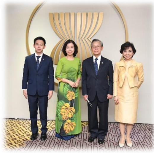
บรรยากาศการพบปะหารือกับเลขาธิการ AIPA