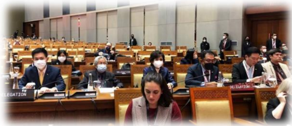
คณะผู้แทนรัฐสภาไทย ระหว่างรับฟังการอภิปรายภาครัฐสภา