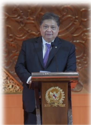
Dr. Airlangga Hartarto