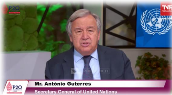
Mr. António Guterres เลขาธิการสหประชาชาติ

พิธีเปิดการประชุม เริ่มต้นขึ้นจากการเปิดวิดีโอทัศน์บันทึกถ้อยแถลงของ Mr. António Guterres เลขาธิการสหประชาชาติ กล่าวถึงความท้าทายที่เกิดขึ้นในโลก อาทิ ภาวะเงินเฟ้อ ความไม่เท่าเทียม ความยากจน ความขัดแย้ง วิกฤตด้านค่าใช้จ่าย จึงจำเป็นต้องพยายามแสวงหาวิธีการเพื่อฟื้นฟูการพัฒนาในด้านพลังงาน ซึ่งต้องทดแทนพลังงานเชื้อเพลิงฟอสซิล การติดตามความก้าวหน้าของการดำเนินการเพื่อบรรลุเป้าหมายการพัฒนาที่ยั่งยืน (Sustainable Development Goals : SDGs) ผ่านความร่วมมือในระบบพหุภาคี และการสร้างความเข้มแข็งเพื่อลดความแตกต่างระหว่างประเทศพัฒนาแล้วและประเทศกำลังพัฒนา เช่น การปฏิรูปเชิงโครงสร้างของระบบการเงินระหว่างประเทศ เป็นต้น