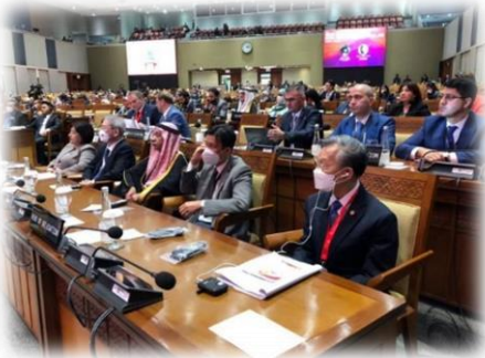
นายชวน หลีกภัย ประธานรัฐสภา หัวหน้าคณะผู้แทนรัฐสภาไทย ระหว่างรับฟังการอภิปรายภาครัฐสภา

จากนั้น Dr. Fadli Zon ประธานคณะกรรมการความร่วมมือระหว่างประเทศ สมาชิกวุฒิสภาอินโดนีเซีย ให้เกียรติกล่าวถ้อยแถลงมุ่งเน้นไปที่การจัดการกับความท้าทายต่าง ๆ อาทิ การเปลี่ยนแปลงสภาพภูมิอากาศ สถานการณ์ความไม่สงบ การอพยพพลัดถิ่น ซึ่งต้องอาศัยการหารือร่วมกันอย่างครอบคลุมโดยยึดหลักพหุภาคีนิยม และรัฐสภาย่อมให้ความสำคัญในเรื่องดังกล่าวเพื่อเป็นส่วนหนึ่งที่จะช่วยผลักดันการปฏิบัติจริงให้เกิดขึ้นด้วย ต่อมา Dr. Airlangga Hartarto รัฐมนตรีผู้ประสานงานกระทรวงด้านเศรษฐกิจอินโดนีเซีย ร่วมให้ทรรศนะเน้นย้ำถึงภัยคุกคามจาก COVID-19 ซึ่งมีผลต่อระยะเวลาของการฟื้นฟูของโลกในประเด็นปัญหาต่าง ๆ ที่คนนับล้านอยู่ในภาวะอดอยากและขาดแคลน โลกทั้งใบจึงมองมาที่เวทีการประชุม P20 ครั้งนี้ ในฐานะกลุ่มประเทศที่มีบทบาททางเศรษฐกิจ และอินโดนีเซียหวังที่จะเน้นการเจริญเติบโตทางเศรษฐกิจให้อยู่ในระดับที่จะกระตุ้นให้เกิดการฟื้นฟูทางเศรษฐกิจได้จริง รวมถึงรักษาโลกทั้งใบ ท้ายสุด H.E. Dr. Puan Maharani ประธานสภาผู้แทนราษฎรอินโดนีเซีย ให้เกียรติกล่าวเปิดการอภิปรายภาครัฐสภา โดยเน้นย้ำการทำงานร่วมกันของทุกภาคส่วน และพหุภาคีนิยมเป็นกลไกที่สำคัญอย่างมาก ซึ่งล่าสุด สภาผู้แทนราษฎรอินโดนีเซียได้มีโอกาสร่วมกับสหภาพรัฐสภา จัดการประชุมสมัชชาสหภาพรัฐสภา ครั้งที่ ๑๔๔ และการประชุมอื่น ๆ ที่เกี่ยวข้อง เมื่อเดือนมีนาคมที่ผ่านมา และได้ให้การรับรองข้อมติ จำนวน ๒ ฉบับ อันสะท้อนว่าประชาคมรัฐสภาระหว่างประเทศยังคงเห็นพ้องต้องกันและเน้นย้ำความจำเป็นของระบบพหุภาคีนิยมในการขับเคลื่อนประเด็นด้านความมั่นคงระหว่างประเทศและการพัฒนาที่ยั่งยืน