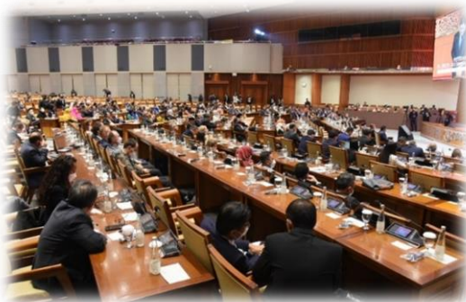
บรรยากาศภายในห้องประชุม ระหว่างการอภิปรายภาครัฐสภา

ผู้ร่วมอภิปรายได้เน้นย้ำถึงความสำคัญของหลักการพหุภาคีนิยม โดยเฉพาะบทบาทของกลุ่ม G20 ซึ่งประกอบด้วยประเทศที่มีสัดส่วนของผลิตภัณฑ์มวลรวมในประเทศ (Gross Domestic Product : GDP) กวาร์้อยละ ๘๕ ของ GDP ทั้งโลก ซึ่งรวมถึงจำนวนประชากรที่มีมากกว่า ๒ ใน ๓ ของประชากรโลก การตัดสินใจของกลุ่ม G20 จะสร้างผลกระทบในด้านต่าง ๆ ทั่วทุกมุมโลก อินโดนีเซียในฐานะประธานกลุ่ม G20 ครั้งนี้ ได้ผลักดันความคืบหน้าของสถาปัตยกรรมด้านสาธารณสุข การเปลี่ยนผ่านทางดิจิทัล การเปลี่ยนผ่านทางพลังงานและการพัฒนา