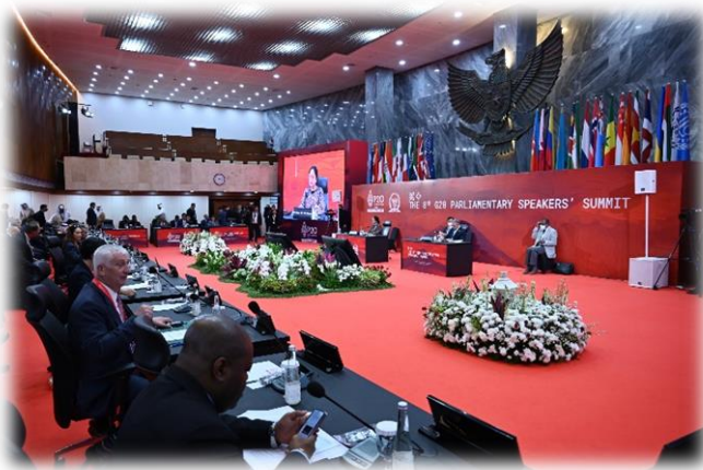
บรรยากาศในการอภิปราย ช่วงที่หนึ่งในการประชุม P20 ครั้งที่ ๘