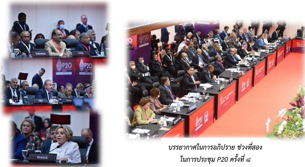
บรรยากาศในการอภิปราย ช่วงที่สอง ในการประชุม P20 ครั้งที่ ๘

การอภิปราย ช่วงที่สอง จัดขึ้น ณ ห้อง KK II อาคาร Nusantara ชั้น ๑ ภายใต้หัวข้อ “ประเด็นเกิดใหม่ : ความมั่นคงทางอาหารและพลังงาน และความท้าทายทางเศรษฐกิจ (Emerging issues : Food and energy security, and economic challenges)” ซึ่งมีผู้ร่วมอภิปราย อาทิ H.E. Ms. Valentina Matvienko ประธานสภาสหพันธ์แห่งสหพันธรัฐรัสเซีย H.E. Mr. Om Birla ประธานโลกสภาอินเดีย H.E. Mr. Mustafa Şentop ประธานรัฐสภาตุรเคีย กล่าวถึงปัญหาเศรษฐกิจที่เกิดขึ้นในปัจจุบัน ซึ่งแก้ไขได้ยากขึ้นกว่าเดิมจากราคาพลังงานที่พุ่งสูงขึ้น หรือการขาดแคลนอาหาร ตลอดจนวิกฤตความมั่นคงระหว่างประเทศที่กระทบไปยังการบริหารจัดการด้านอุปทาน จึงเห็นว่ามีคามจำเป็นในการกำหนดแนวปฏิบัติเพื่อบรรเทาผลกระทบร้ายแรง และกลุ่ม G20 ยังคงเป็นกำลังสำคัญในการรักษาบทบาทและวัตถุประสงค์ของกลุ่ม เพื่อสร้างการเจริญเติบโตที่เข้มแข็ง ยั่งยืน สมดุล และครอบคลุม