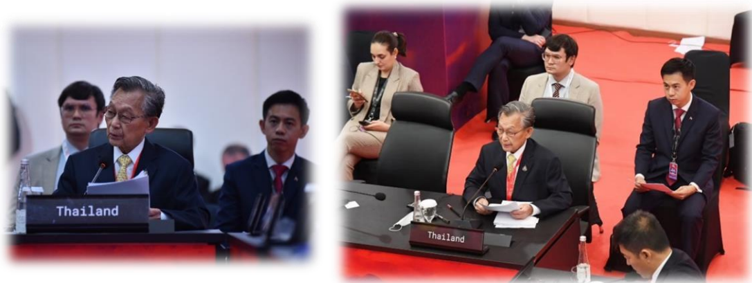
นายชวน หลีกภัย ประธานรัฐสภา ขณะกล่าวถ้อยแถลงและร่วมอภิปรายแลกเปลี่ยนต่อที่ประชุมในการอภิปราย ช่วงที่สาม ในการประชุม P20 ครั้งที่ ๘

ในการนี้ นายชวน หลีกภัย ประธานรัฐสภา ได้กล่าวถ้อยแถลงและร่วมอภิปรายแลกเปลี่ยน ต่อที่ประชุมโดยมีใจความสำคัญว่า ประชาธิปไตยในประเทศต่าง ๆ อาจมีความแตกต่างในเชิงโครงสร้างและกระบวนการ แต่หัวใจสำคัญ คือ อำนาจของประชาชน โดยประชาชน เพื่อประชาชน ดังนั้น รัฐสภาที่มีประสิทธิภาพจะทำให้ทุกคนในสังคมเท่าเทียมกัน และสร้างความเปลี่ยนแปลงเพื่อแก้ไขและเยียวยา ปัญหาของสังคมผ่านการมีส่วนร่วม อย่างไรก็ตาม ปัญหาสำคัญที่เป็นอุปสรรคขัดขวางการสร้างประชาธิปไตยที่เข้มแข็ง คือ การรัฐประหาร การคอร์รัปชัน ธุรกิจการเมือง และการเข้าถึงโอกาสต่าง ๆ ที่ไม่เสมอภาค นอกจากนี้ การมีกฎหมายที่ดีนั้นยังไม่เพียงพอ แต่จำเป็นต้องอาศัยคนดีเข้ามาบัญญัติและบังคับใช้กฎหมาย ในทางปฏิบัติด้วย ในขณะเดียวกัน การเลือกตั้งเพียงลำพังไม่ใช่หลักประกันความก้าวหน้าในการพัฒนา ประชาธิปไตย หากแต่จำเป็นต้องมีกระบวนการเลือกตั้งที่เสรีและสุจริต โดยที่ประชาชนและผู้ที่อยู่ในอำนาจจะต้องใช้สิทธิเสรีภาพเหล่านั้นบนพื้นฐานของกฎเกณฑ์ ข้อบังคับ และหลักนิติธรรม โดยหวังเป็นอย่างยิ่งว่ารัฐสภาจะมีบทบาทสำคัญในโลกภายหลัง COVID-19 ที่จะช่วยผ่อนคลายนโยบายที่จำกัด สิทธิส่วนบุคคล เพื่อบรรลุการฟื้นฟูอย่างยั่งยืนโดยที่ประชาชนจะมีความเข้มแข็งด้วยตนเอง