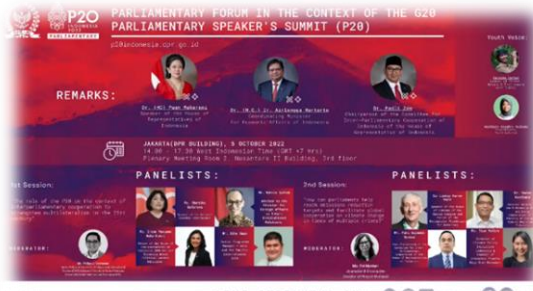
ภาพพื้นหลังประชาสัมพันธ์ระหว่าง รอบรับชมถ่ายทอดสดการอภิปรายภาครัฐสภา