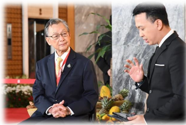
บรรยากาศการบันทึกเทปสัมภาษณ์ในรายการของสถานีโทรทัศน์รัฐสภาอินโดนีเซีย

เมื่อวันพฤหัสบดีที่ ๖ ตุลาคม ๒๕๖๕ เวลา ๑๖.๐๐ นาฬิกา นายชวน หลีกภัย ประธานรัฐสภา ให้เกียรติบันทึกเทปสัมภาษณ์ในรายการของสถานีโทรทัศน์รัฐสภาอินโดนีเซีย (TV Parlemen) ในประเด็นที่เกี่ยวข้องกับการประชุม P20 ครั้งที่ ๘ และความเห็นเกี่ยวกับระบอบประชาธิปไตยไทยเปรียบเทียบกับระบอบประชาธิปไตยอินโดนีเซีย