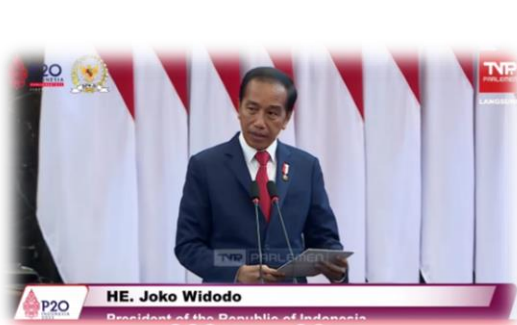
H.E. Mr. Joko Widodo ประธานาธิบดีอินโดนีเซีย

ปิดท้ายด้วยการกล่าวถ้อยแถลงในพิธีเปิดของ H.E. Mr. Joko Widodo ประธานาธิบดีอินโดนีเซีย จุดประกายให้ภาครัฐสภาของกลุ่ม G20 หยุดการทำงานแบบแยกส่วนและหันมาส่งเสริมความร่วมมือเพื่อรับมือกับความท้าทายและวิกฤตต่าง ๆ อย่างมีประสิทธิภาพ โดยเชื่อว่าพหุภาคีเป็นกลไกที่ทรงอิทธิพลและประเทศต่าง ๆ ต้องจริงจังในการหารือร่วมกันเพื่อแสวงหาแนวทางแก้ไขปัญหาเร่งด่วนต่าง ๆ ของโลกในปัจจุบัน โดยเฉพาะปัญหาจากความขัดแย้งและความไม่ลงรอยกันซึ่งมีผลให้ทุกฝ่ายพ่ายแพ้ ทั้งยังเห็นว่ารัฐสภาทั้งหลายเป็นส่วนหนึ่งในการแก้ไขปัญหานี้ โดยเฉพาะบทบาทในการเป็นสะพานเชื่อม การปฏิบัติการเพื่อสันติภาพ การหารือและเจรจา การส่งเสริมภราดรภาพ และการหลีกเลี่ยงความไม่ลงรอยกัน ซึ่งการประชุมครั้งนี้ถือเป็นหมุดหมายของการสร้างความเป็นน้ำหนึ่งใจเดียวกันกับประชาชนและภราดรภาพระหว่างประเทศ การร่วมมือแก้ไขปัญหายั่งยืน และ การสร้างโลกที่มั่งคั่งด้วยความยุติธรรม