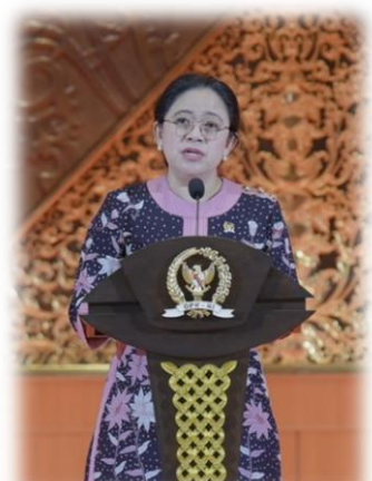
H.E. Ms. Puan Maharani