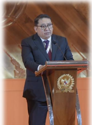
Dr. Fadli Zon