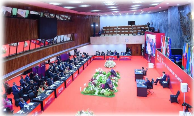
บรรยากาศในการอภิปราย ช่วงที่สาม ในการประชุม P20 ครั้งที่ ๘