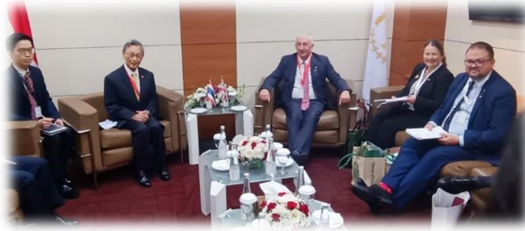
บรรยากาศการพบปะหารือทวิภาคีกับประธานสภาสามัญสหราชอาณาจักร