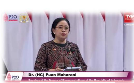
H.E. Dr. Puan Maharani ประธานสภาผู้แทนราษฎรอินโดนีเซีย

ใบนี้ไว้ด้วยการตัดสินใจของพวกเรา ซึ่งทุกฝ่ายหวังที่จะฟังผลการสนับสนุนจากภาครัฐสภา โดยภาครัฐสภาจะได้สนับสนุนวาระของกลุ่ม G20 ในการฟื้นฟูระดับโลกที่ครอบคลุม ยืดหยุ่น และมุ่งสู่ความเป็นสีเขียว อาศัยหลักการพหุภาคีของภาคินิติบัญญัติ เช่น พันธมิตรระหว่างรัฐสภา การอภิปรายและการทูตรัฐสภา และการแสวงหาฉันทามติ ซึ่งอินโดนีเซียพร้อมสำหรับความหวังครั้งใหม่ โดยเฉพาะการกำหนดแนวทางขับเคลื่อนเพื่อการพัฒนาที่ยั่งยืน การสร้างสาธารณูปโภคขั้นพื้นฐาน โครงการเพื่อสังคม การกระตุ้นเศรษฐกิจ และระเบียบด้านภาษีคาร์บอน และการส่งเสริมพลังงานทางเลือก