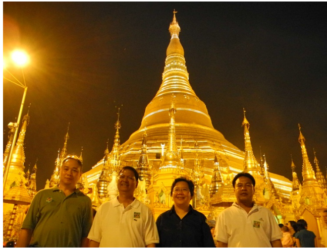
คณะฯ สักการะพระเจดีย์ชเวดากอง กรุงย่างกุ้ง

นอกจากนั้น คณะฯ ยังมีโอกาสได้เยี่ยมชมสถานที่สำคัญๆ ทางประวัติศาสตร์และวัฒนธรรม ของกรุงย่างกุ้งและนครเนปิดอว์ อาทิ พระเจดีย์ชเวดากอง เจดีย์โบตาทาวน์ วัดพระพุทธไสยาสน์เจ้าทัตจี วัดบารมี ณ กรุงย่างกุ้ง และพระเจดีย์ชเวดากองจำลอง ณ นครเนปิดอว์ เป็นต้น