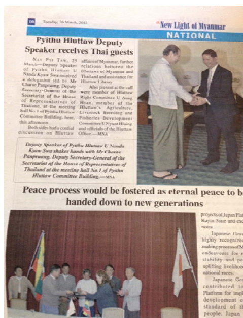
หนังสือพิมพ์ The Light of Myanmar นำเสนอข่าวคณะฯ เข้าเยี่ยมคารวะรองประธานสภาผู้แทนราษฎรเมียนมาร์