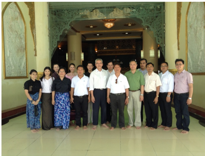
คณะฯ เยี่ยมชมพระเจดีย์ชเวดกองจำลอง ณ นครเนปิดอว์