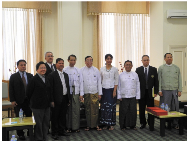
คณะฯ ถ่ายภาพร่วมกับรองประธานสภาผู้แทนราษฎรเมียนมาร์ และผู้ร่วมให้การรับรอง