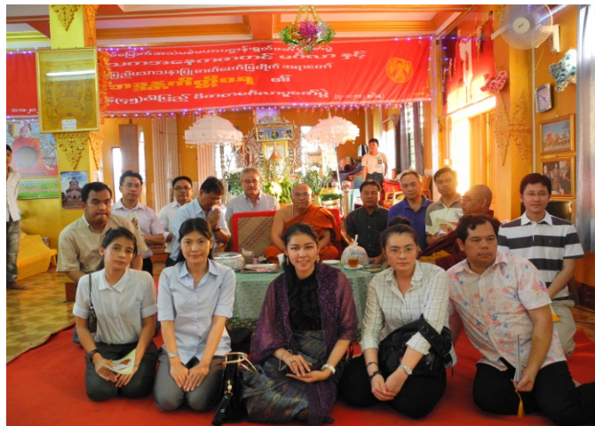
คณะฯ สักการะพระเกศาธาตุ ณ วัดบารมี กรุงย่างกุ้ง