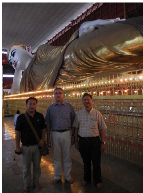
คณะฯ เยี่ยมชมวัดพระพุทธไสยาสน์เจ้าทัตจี กรุงย่างกุ้ง