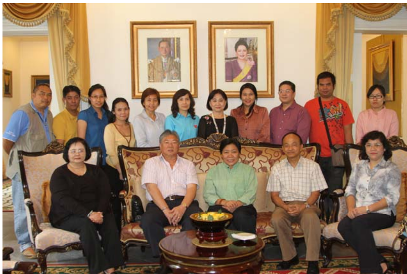
คณะฯ พบปะหารือกับกงสุลใหญ่ ณ นครโฮจิมินห์ และทีมประเทศไทยประจำนครโฮจิมินห์ ณ ที่ทำการสถานกงสุลใหญ่ นครโฮจิมินห์

วันอาทิตย์ที่ ๒๑ เมษายน ๒๕๕๖ คณะฯ เข้าพบปะหารือและร่วมรับประทานอาหารกลางวันกับนางสาวพรรณพิมล สุวรรณพงศ์ กงสุลใหญ่ ณ นครโฮจิมินห์ และทีมประเทศไทยประจำนครโฮจิมินห์ ณ ที่ทำการสถานกงสุลใหญ่ นครโฮจิมินห์ ซึ่งกงสุลใหญ่ฯ ได้ให้ข้อมูลเกี่ยวกับนครโฮจิมินห์ว่าเป็นนครที่มีความโดดเด่นทางด้านเศรษฐกิจของประเทศ รายได้ส่วนใหญ่มาจากการท่องเที่ยว นักลงทุนไทยนิยมเข้ามาลงทุนเป็นจำนวนมาก นอกจากนี้ยังได้กล่าวถึงการเตรียมความพร้อมเข้าสู่ประชาคมอาเซียนของเวียดนาม ว่าภาครัฐเน้นนโยบายหลักคือการใช้วัฒนธรรมร่วมกันในการเสริมสร้างความสัมพันธ์อันดี