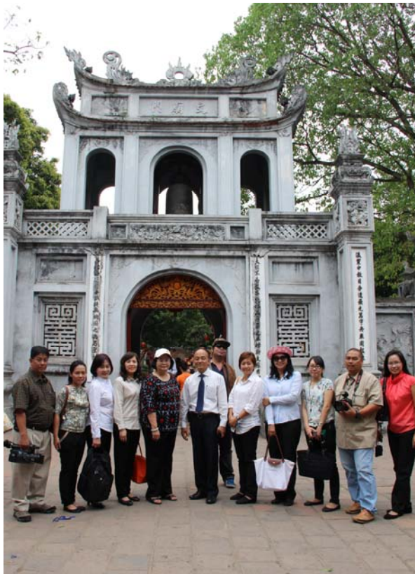
วิหารวรรณกรรมหรือวัดจอหงวน ซึ่งนับเป็นมหาวิทยาลัยแห่งแรกของเวียดนาม