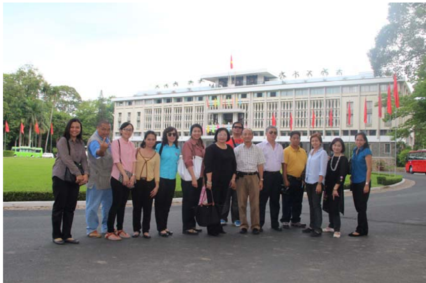
คณะฯ ถ่ายภาพร่วมกัน ณ อดีตทำเนียบประธานาธิบดี ซึ่งปัจจุบันเป็นพิพิธภัณฑ์เพื่อรำลึกถึงการรวมชาติของเวียดนาม