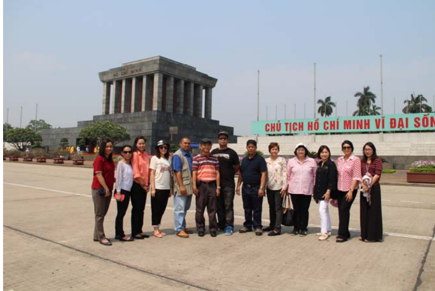
คณะฯ ถ่ายภาพร่วมกัน ณ สุสานโฮจิมินห์