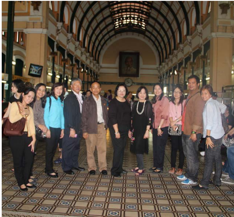
คณะฯ ถ่ายภาพร่วมกัน ณ สำนักงานไปรษณีย์ ซึ่งเป็นไปรษณีย์แห่งแรกและใหญ่ที่สุดของเวียดนาม