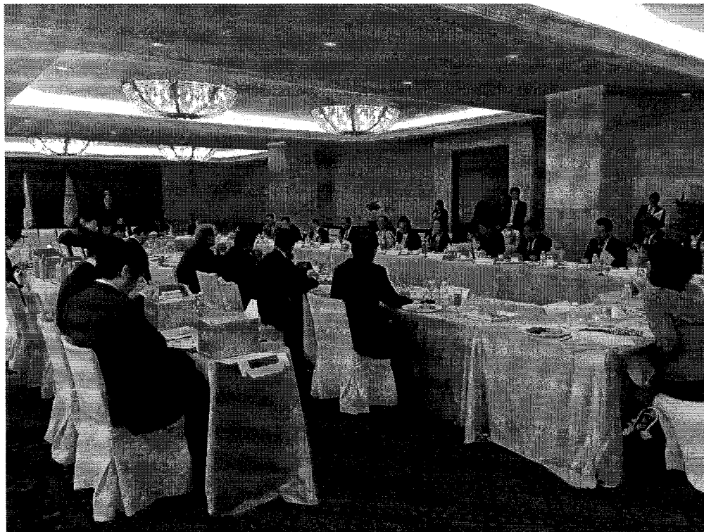
บรรยากาศการประชุม ในช่วงเช้า (Breakfast Meeting) เวลา ๐๗.๓๐ - ๐๘.๔๕ นาฬิกา ณ ห้องเฮอร์บีรา โรงแรมมูเลีย