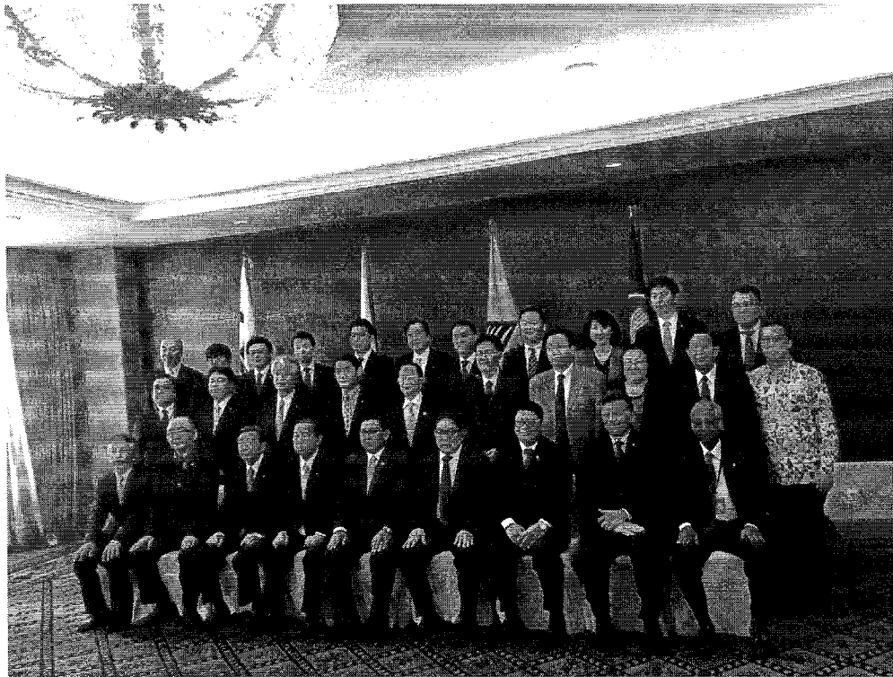
คณะผู้แทนสมาชิกรัฐสภาอาเซียนถ่ายภาพร่วมกับสมาชิกวุฒิสภาญี่ปุ่น