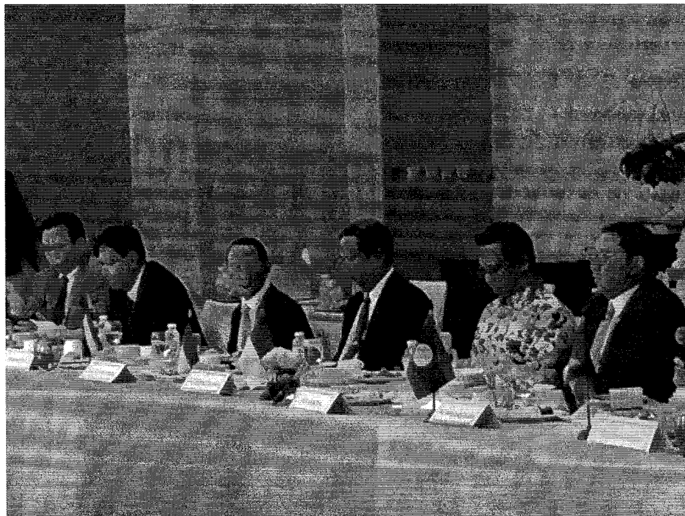
บรรยากาศการประชุมในช่วงเช้า (Breakfast Meeting) เวลา ๐๗.๓๐ - ๐๘.๔๕ นาฬิกา ณ ห้องเฮอร์บีรา โรงแรมมูเลีย