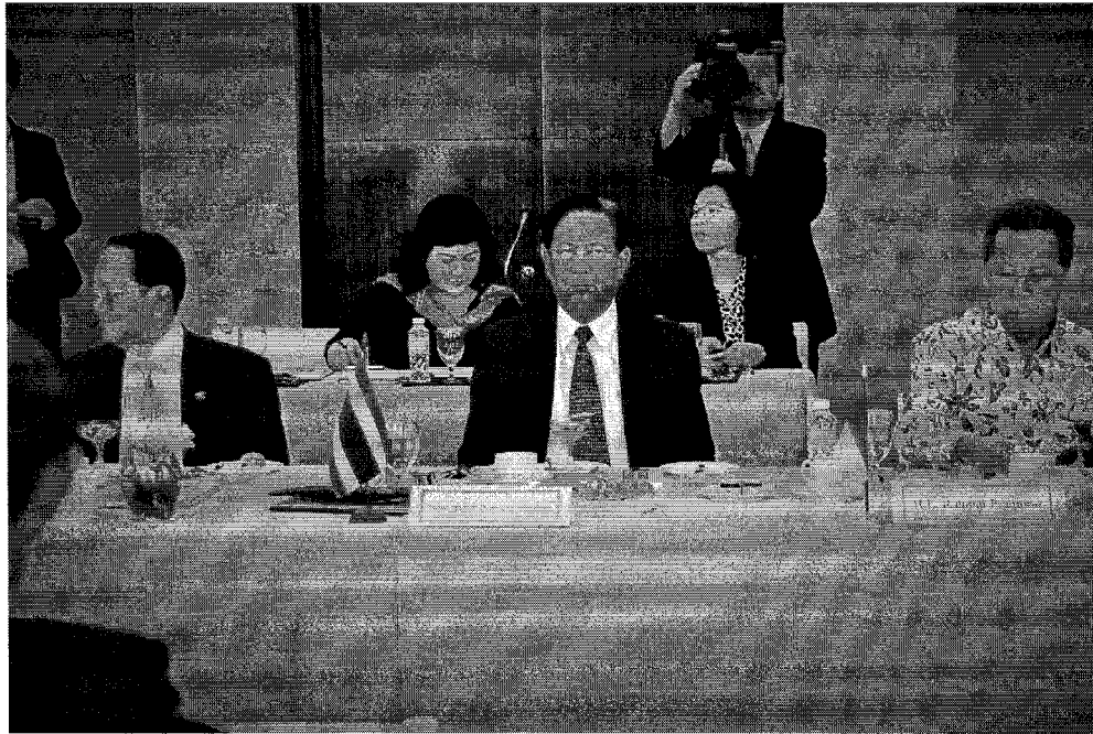
พลเรือเอก พลวัฒน์ สีโรตม สมาชิกสภานิติบัญญัติแห่งชาติในฐานะคณะผู้แทนสมาชิกรัฐสภาอาเซียน ในการเข้าร่วมการประชุมทวิภาคีระหว่างคณะผู้แทนสมาชิกรัฐสภาอาเซียนและสมาชิกรัฐสภาญี่ปุ่น