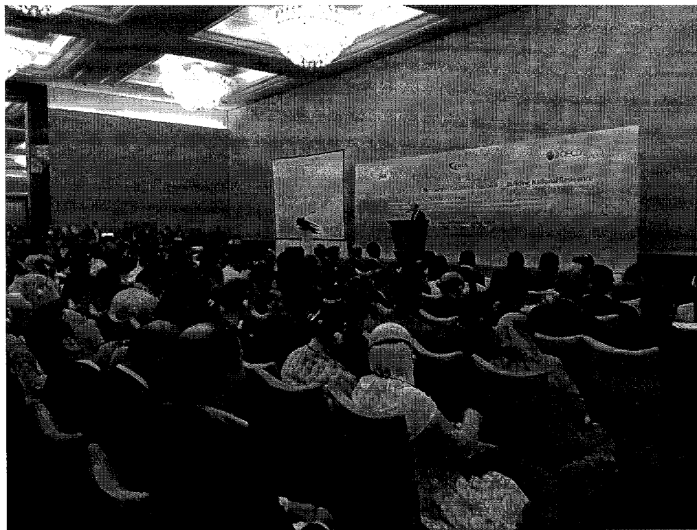
การสัมมนา “Building National Resilience – Beyond Japan” ว่าด้วยเรื่อง การป้องกันและการบริหารจัดการภัยพิบัติในภูมิภาคอาเซียนและความร่วมมือกับประเทศญี่ปุ่น