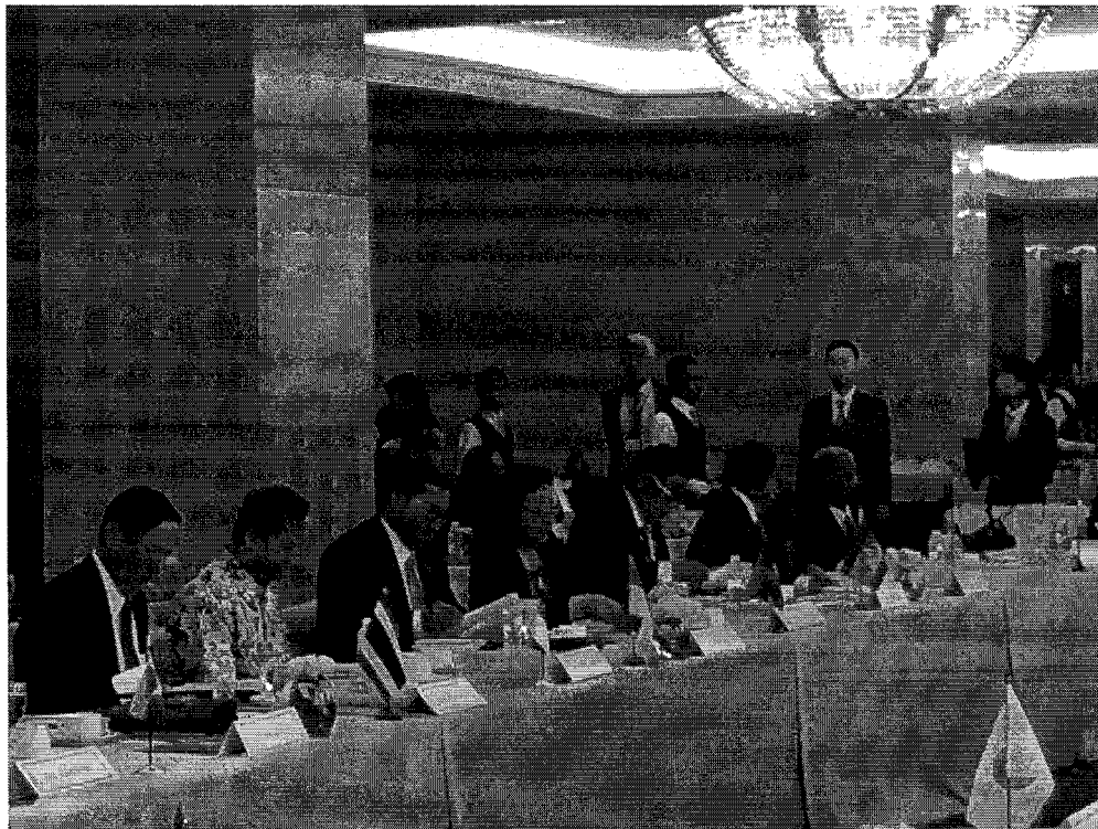
คณะผู้แทนสมาชิกรัฐสภาอาเซียนที่เข้าร่วมการประชุม นำโดยเลขาธิการ AIPA และผู้แทนจากประเทศสมาชิก AIPA ได้แก่ กัมพูชา ลาว อินโดนีเซีย ไทยและเมียนมาร์